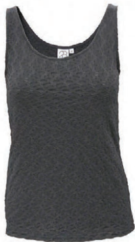
Toppur kr. 6.400. - 3 litir