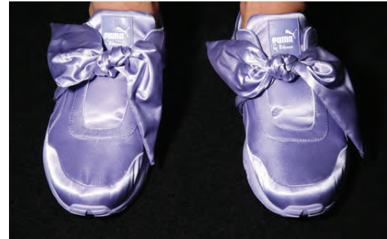
Puma by Rihanna strigaskór með slaufum.