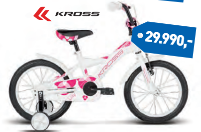
KROSS LYLILLY 12"