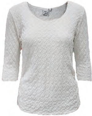
Toppur kr. 7.900. - 2 litir