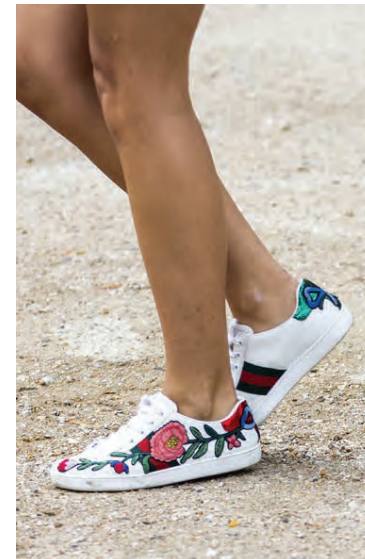
Nýir strigaskór frá Gucci eru skreyttir blómum.