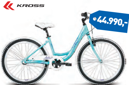
KROSS JULIE 24"