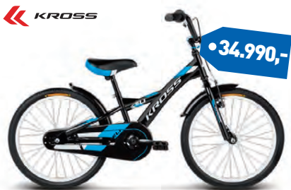
KROSS ELI 20"