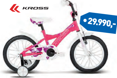
KROSS LILLY 16"