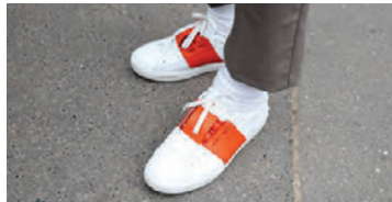
Strigaskór frá Valentino fyrir sumarið.

Þær konur sem vilja ganga á háum hælum hafa líka úr mörgu að velja. Flestir skór í sumar eru með þykkum botni, hvort sem það eru sandalar eða heilir skór. Margir þeirra eru afar litríkir, til dæmis frá Marc Jacobs, Michael Kors, Miu Miu og fleiri.