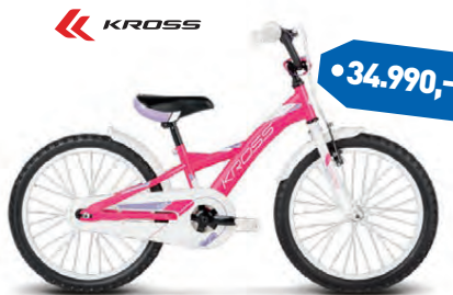
KROSS ELLA 20"