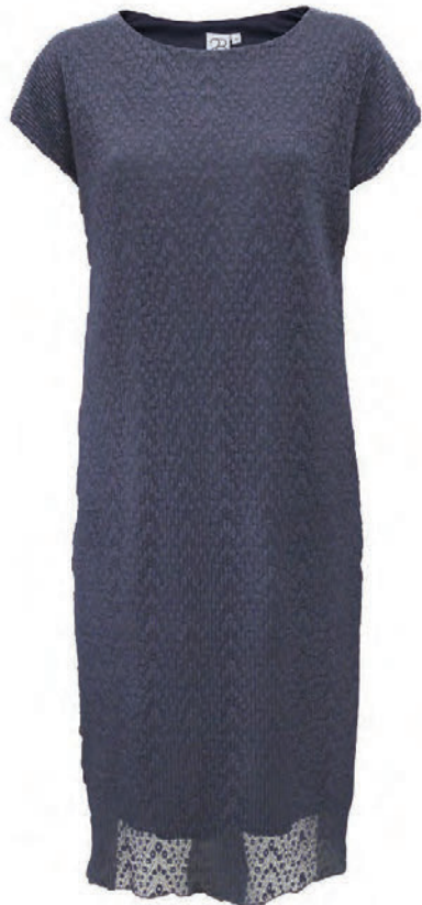
Kjöll kr. 13.900.-