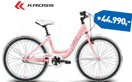
KROSS JULIE 24"