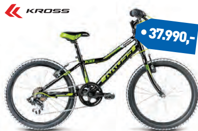
KROSS HEXAGON 20"