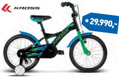
KROSS LEO 16"