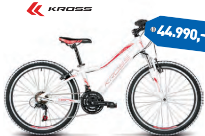
KROSS LEA REPLICICA 24"