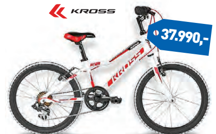
KROSS HEXAGON 20"