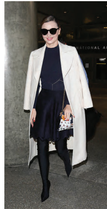
Miranda er ein launahæsta fyrirsæta heims. Hún er trúlofuð stofnanda Snapchat.