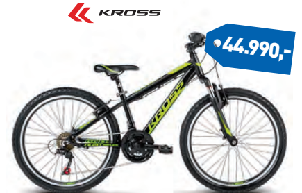
KROSS DUST REPLICICA 24"