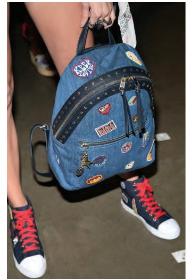
Flottir strigaskór frá Tommy Hilfiger fyrir sumarið.