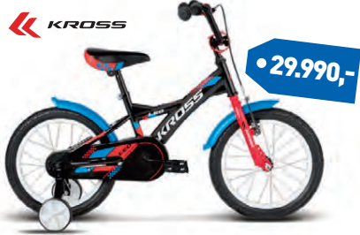
KROSS LEO 16"