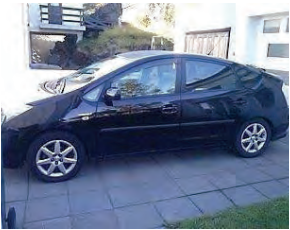
Toyota Prius Hybrid 2009. Sjálfsk. S. 6162597