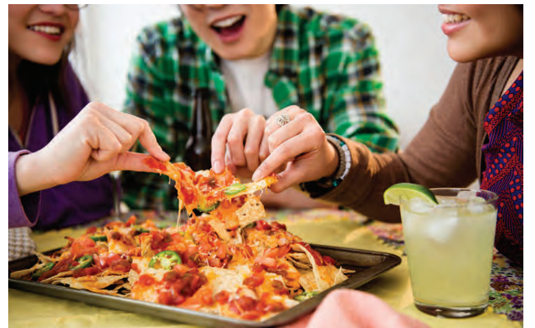
Nachos er alltaf vinsæll réttur hjá flestum aldurshópum.

Steikið hakk, smátt skorinn lauk og chili-pípar á heitri pönnu. Bætið við taco-kryddinu og smá vatni