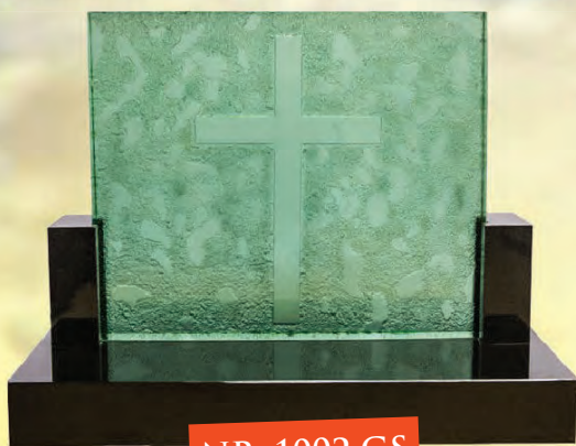
NR. 1002 GS