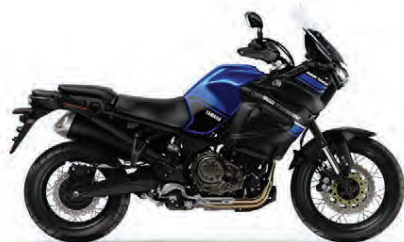
XT1200Z SUPER TÉNÉRÉ

Yamaha mótorhjólín eru þekkt fyrir gæði og einstaka hönnun. Við eigum örugglega rétta hjólið fyrir þig!