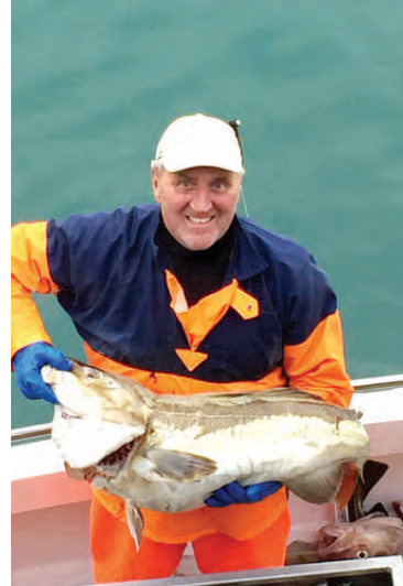
„Ég fann strax að þetta gerði mér gott enda kom í ljós eftir læknisheimsókn síðar um haustið að kólesterólið hafði snarlækkað og einnig var ég látinn minnka sykursýkislyfin um allt að helming.“

„Í kjölfar hjartaáfalls rauk kólesterólið hjá mér upp úr öllu valdi. Rauðrófuhylkin hjálpuðu mér að ná því niður í eðlilegt horf á örfáum mánuðum.“