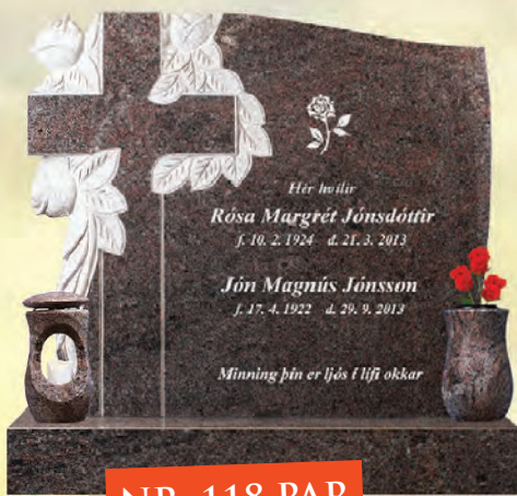
NR. 118 PAR