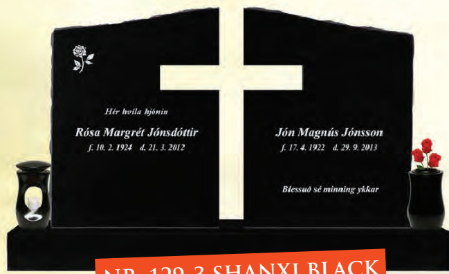
NR. 129-3 SHANXI BLACK

FYLGIHLOTIR FYLGJA EKKI MEÐ AKSTURSGJALD BÆTIST VIÐ UTAN HÖFUÐBORGARSVÆÐISINS