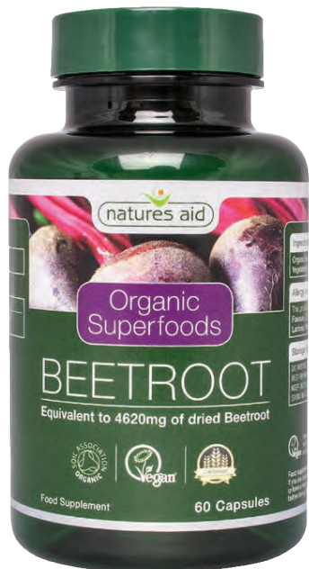
Viðtökurnar við Beetroot hafa verið mjög góðar.