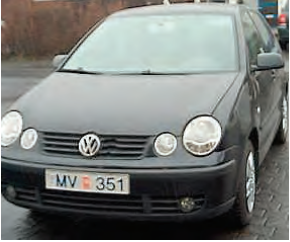
VW Póló árg 02 ek 112 þús skoðaður 18 1,4 beinskiftur ný tímareim góð dekk verð 295 þúsund 8927852