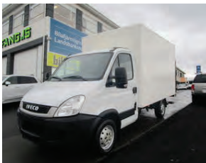
NÚ Á TILBOÐI! Iveco Daily 35S13 kassabíll 11/2010 ek 98 þ.km M/LYFTU verð nú aðeins 2490 þús + VSK !!!