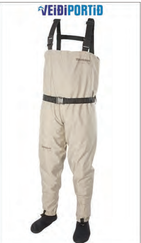
Snowbee 3 laga öndunardödlur Verð 19.900 kr. Veiðiportíð Grandagarður 3 552-9940