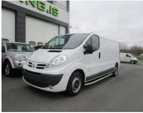
Nissan Primastar Diesel H1-L2 12/2013 (mód 2014) ek 77 þ.km, langur, verð 1950 þús + VSK !!!