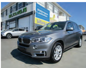
GLÆSILEGUR! BMW X5 Xdrive 30D diesel 05/2016 ek 24 þ.km NAPPA Leður, Glerþak, hlaðinn búnaði, (Nyvirði 12.8 mil) OKKAR VERÐ 9.9 mil !!!

Bílasalan Bílfang Malarhöfða 2, 110 Rvk. Sími: 567 2000 Seljum í dag! www.bilfang.is