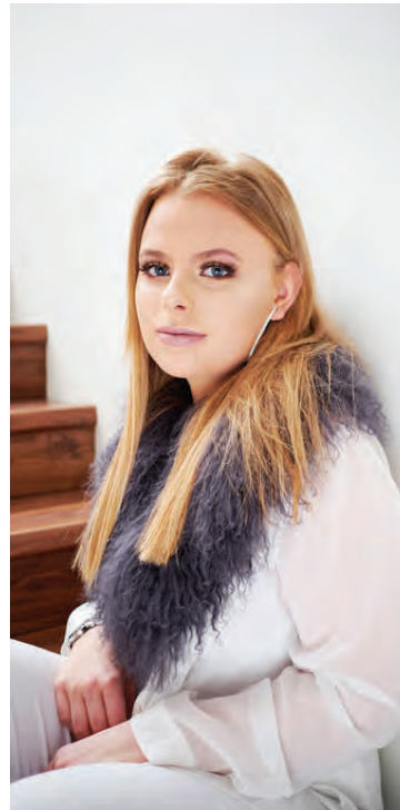
Í hvítum buxum frá Zöru, skyrtu úr H&M og með feld úr Mýrinni.

Hvar kaupir þú fötin þín? Ég kaup mest í útlöndum. Mismunandi hvar og hvað, þá helst það sem mér finnst flott hverju