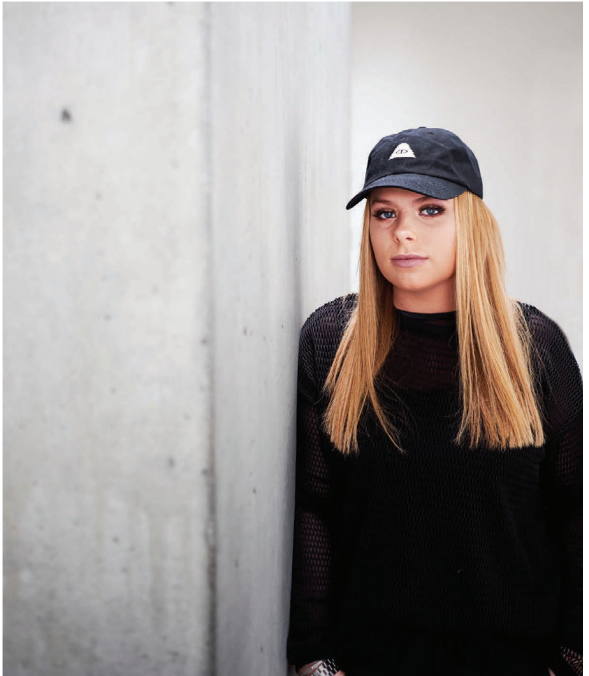
Í svörtum bol úr Zöru með derhúfu frá Urban Outfitters.

Ferðamáskóli Íslands • www.menntun.is • Sími 567 1466