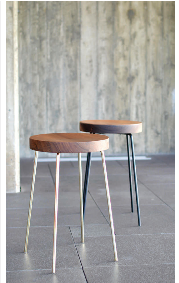
Kollar úr tekki með messinghúðuðu stelli og kollar úr hnotu með leðursetu og stálfötum.