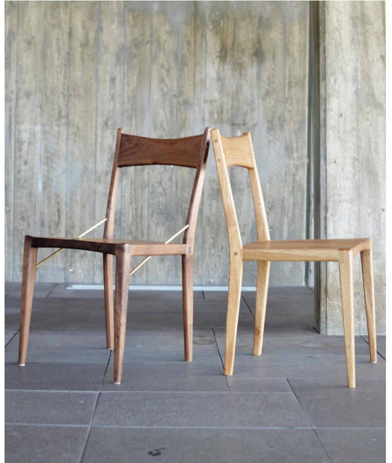
Borðstofustóll II úr hnotu með messingteinum og borðstofustóll I úr eik.