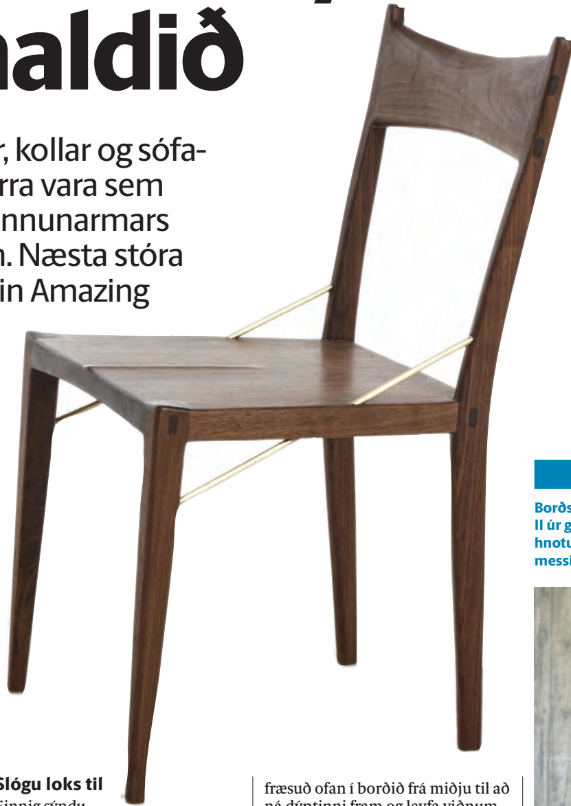
Borðstofustóll II úr gegnheilli hnotu með messingteinum.

Hönnun AGUSTAV má skoða á www.agustav.is , á Facebook og Instagram (@agustavfurniture).