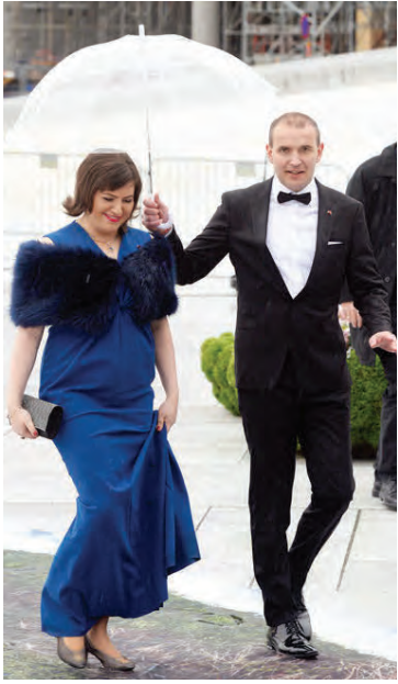
Guðni Th. Jóhannesson og Eliza Reid voru glæsileg í afmælinu í Ósló.