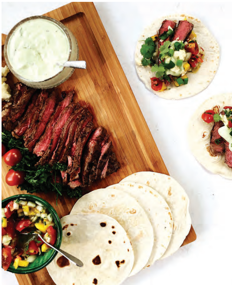
Steikar taco með mangósalsa og lærperusósu.