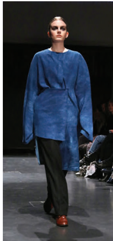
Sýningin gekk hnökralaust fyrir sig.