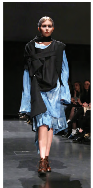
Mikil vinna liggur að baki tiskulínunni.

Til að mynda voru móðir mín og systir í fullri vinnu við að vefa 100 búta úr stuttermabolum sem voru notaðir í bleika jakkann og buxurnar.