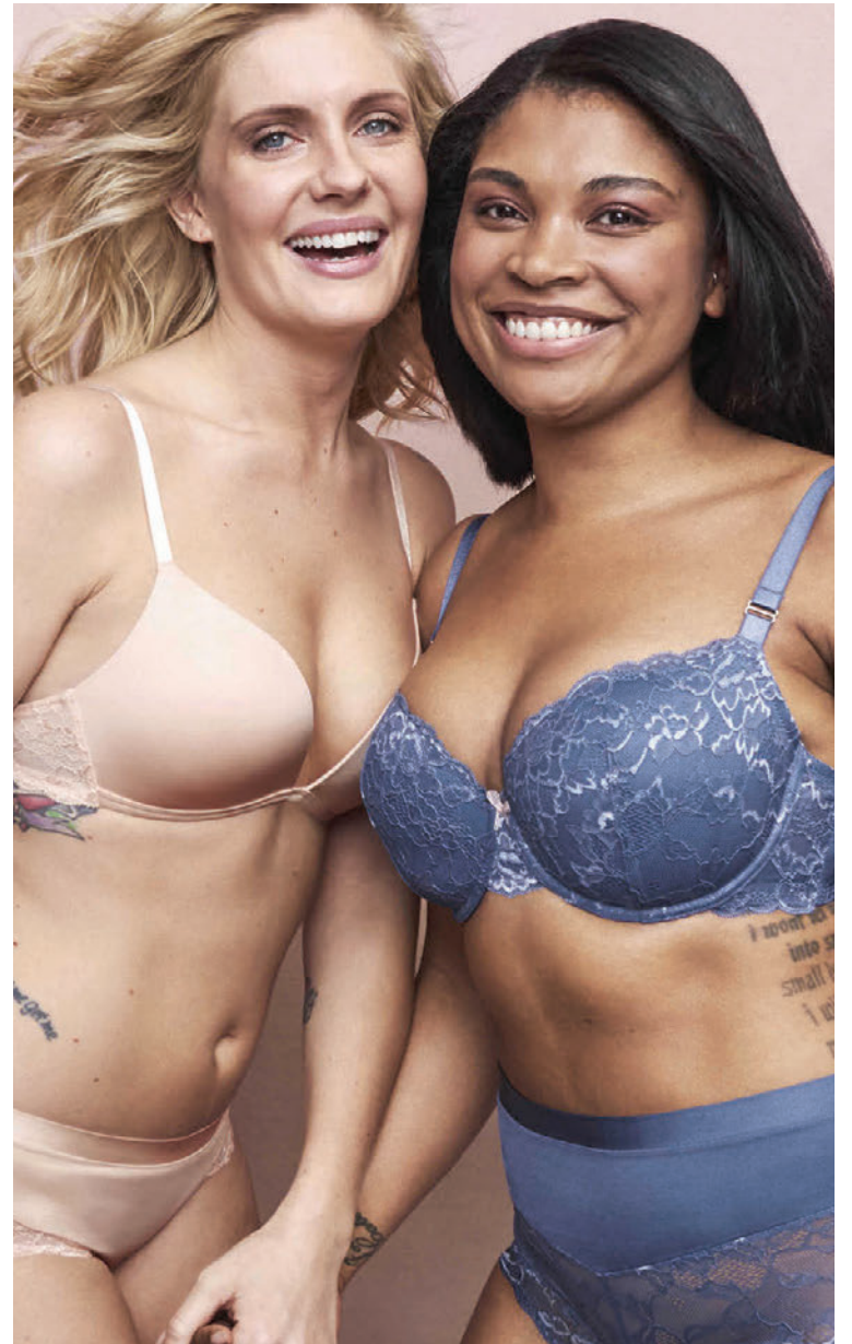
Lindex hannar undirföt fyrir konur í mismunandi stærðum.

Nýja verslunin verður með nýtt útlit Lindex verslana á Íslandi en fyrirtækið hefur hlotið verðlaun