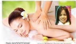
THAI NUDDSTOFAN Joom is offering her Thai health massage Súðurlandsbraut 16, Lýsa hæð, 108. Reykjavík

Ekta vigsla í leyndardóma Tantra með Tantra nuddi. Einstæð upplifun fyrir þór, konur og karla. S. 698 8301 www.tantratemple.is