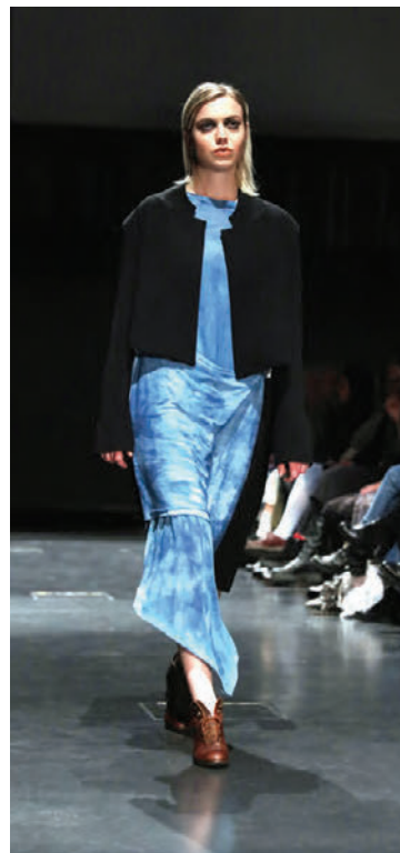
Blá klæði úr náttúrulegum indígóliti.