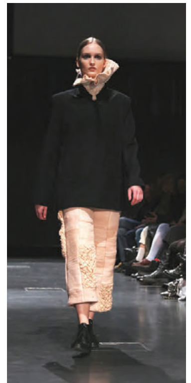
Bleiki liturinn fékkst með avókadósteini.