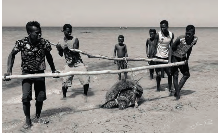
Veidimennirnir á rifinu veiddu risasæskjaldbóku sem allir þorpsbúar gæddu sér á um kvöldið.