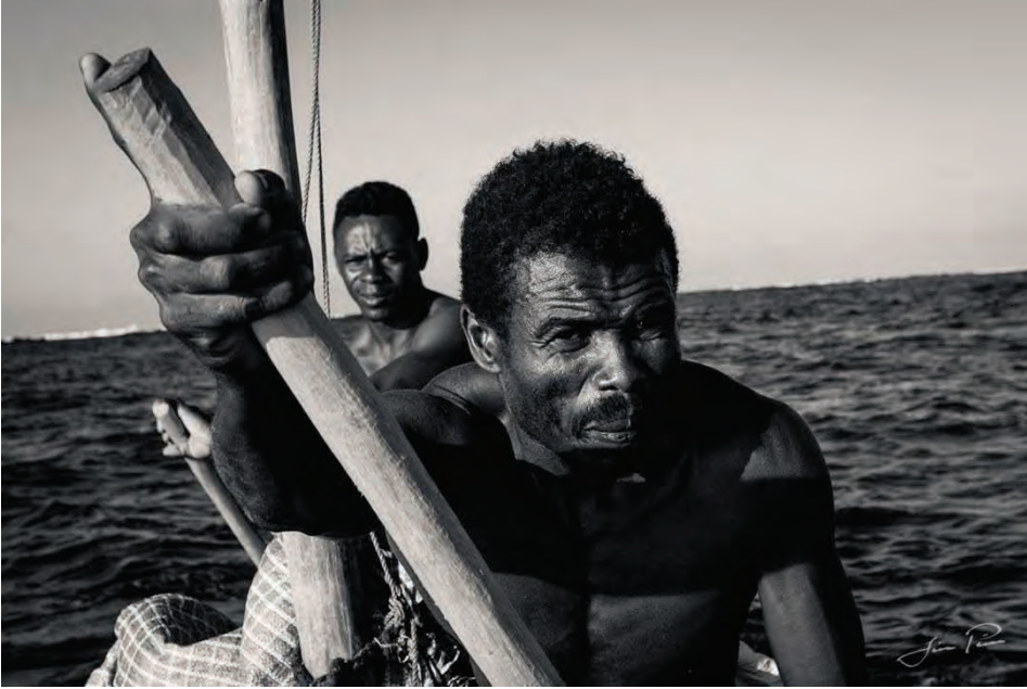
Ljósmyndasýningin Madagaskar – mora mora verður opnuð í ljósmyndastúdíói Jóns Páls að Snorrabraut 56a á næstu dögum.