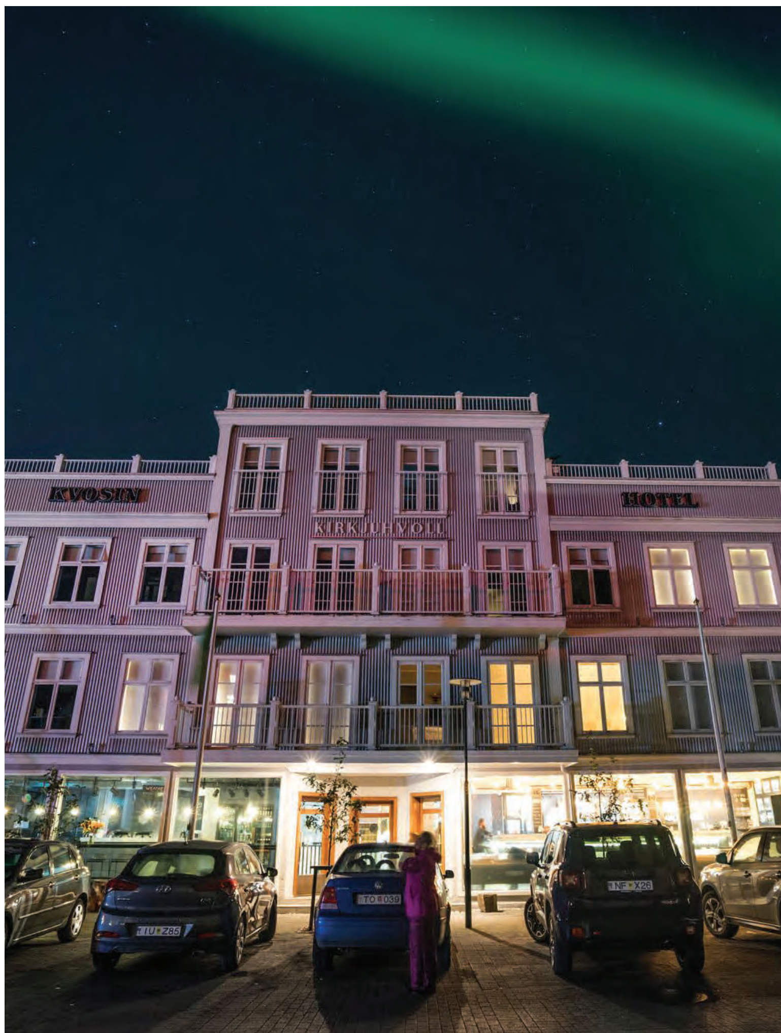
Kvosin Downtown Hotel er frábærlega vel staðsett í hjarta Reykjavíkurborgar.