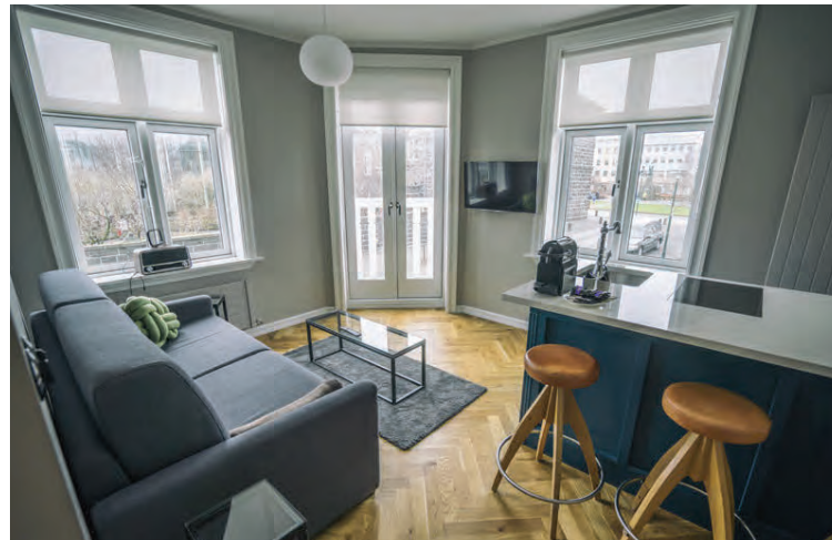
Mörg fallett herbergin hafa útsýni yfir Alþingi.

Joe segir starfsfólkið gefa hóteliinu sál. „Allt frá fyrstu spurningum um bókanir þar til löngu eftir brottför hafa gestir okkar stöðugt aðgengi að starfsmanni í móttöku í gegnum tölvupóst, síma og skilaboðakerfi. Það skiptir sköpum