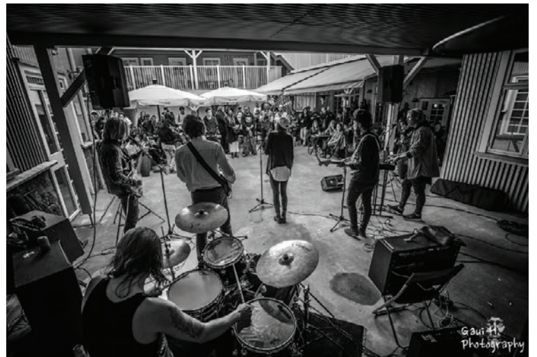
Garður hótelsins er opinn yfir sumarið og hýsir reglulega tónleika og ýmsa viðburði.

fyrir gesti að hafa leiðsögn fyrir og á meðan dvöl stendur og þeir eru yfirleitt hissa og gladdir að hitta manneskjuna augliti til auglitis sem aðstoðar þá við bókanir og ferðir