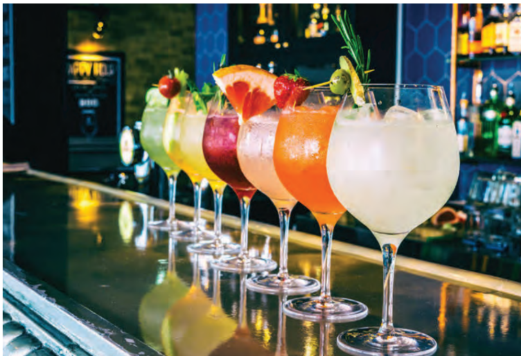
Klaustur Downtown Bar býður m.a. upp á gin & tonic seðil. Allir drykkir innihalda íslenskt hráefni.

Hönnun hótelsins er einstök og flest herbergjanna hafa svalir með útsýni yfir Alþingishúsið og dómkirkjuna. „Ýmislegt í herbergjunum er sérsmiðað, t.d. eldhúsinnrétt-