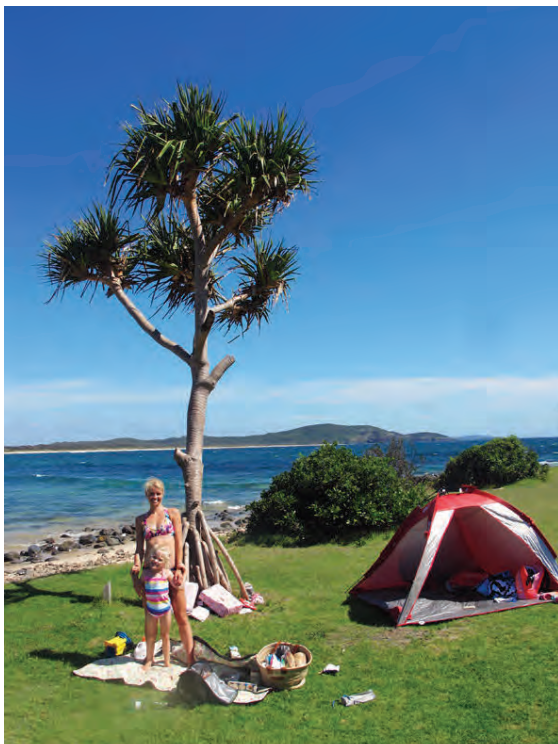
Jólatré fjölskyldunnar eitt árið. Pökkunum raðað undir.