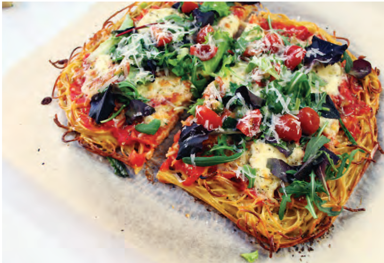
Spagettipitsla með mozzarella og basilíku.

Hitið olíu á pönnu, saxið niður hvítlauk og lauk og steikið upp úr oliunni í smástund þar til laukurinn er orðinn mjúkur. Bætið söxuðum tómötum út á pönnuna ásamt hálfum kjúklinga-