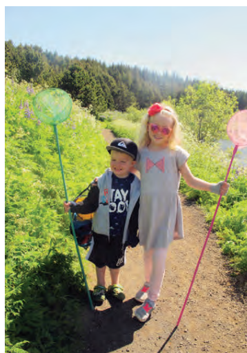
Nói og Ninja Ýr við Hvaleyrarvatn.

Mér fannst auðvitað ótrúlega gaman að fylgjast með bæði þríþrautinni og hjólréiðunum vaxa á Íslandi. Það er auðvitað frábært að fólk sé að hreyfa sig. Svo smitar þetta út frá sér. Dóttir mín er til dæmis farin að æfa sund og tók þátt í tvíþraut um daginn. Það var stundum fyndið að fylgjast með henni hjóla þegar við bjuggum úti en hún stókk alltaf af hjólinu til að hlaupa, eins og ég var að gera. Hún á eftir að verða efnileg þríþrautarmanneskja. Mér finnst að allir sem hafa áhuga ættu að prófa þetta sport. Ég verð þó að vara fólk við, þríþraut er ávanabindandi sport.“