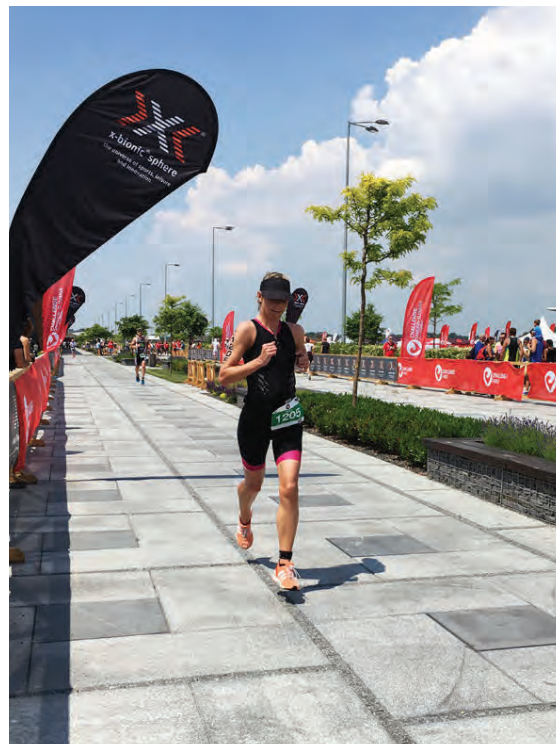
Á lokametrunum á heimsmeistaramótinu í Slóvakíu.