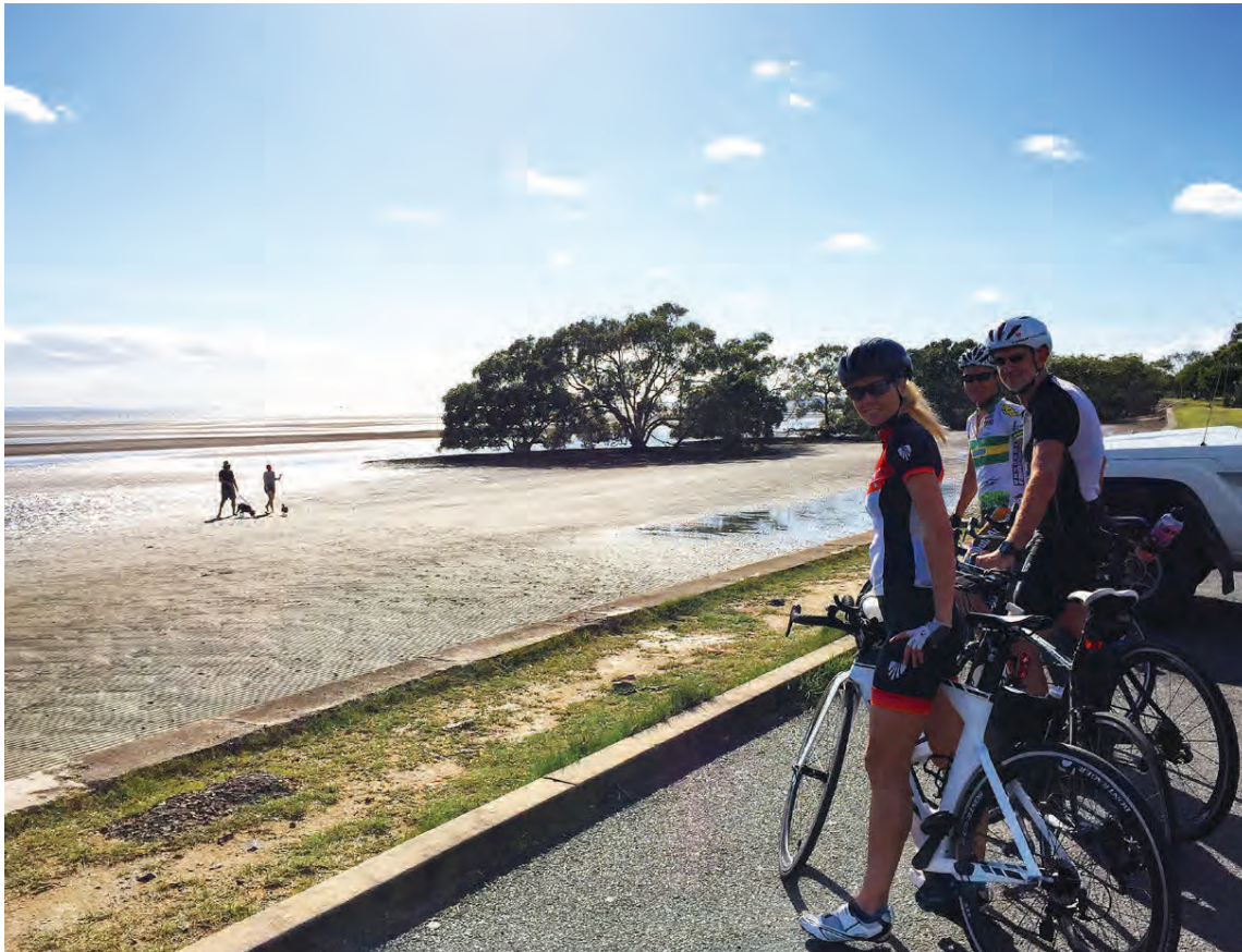
Úti í Ástralíu fóru hjólaæfingarnar fram annaðhvort uppi í fjöllum eða meðfram strandlengjunni.