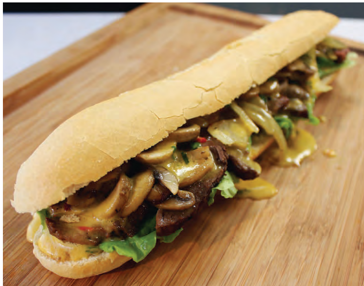
Steikarloka með chili bernaie sósu.

teningi, saxið niður basilíku og bætið henni saman við. Hrærið vel í sósunni og kryddið til með salti og pipar. Leyfið sósunni að malla í nokkrar mínútur. Smyrjið spagettibotninn með tómát- og basilíkusósunni.