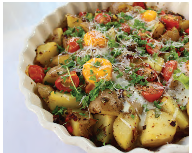
Ljúffeng baka með kartöflum, beikoni og eggjum.

Siðumúla 6 | 108 Reykjavík | 560 4802 verslun.sibs.is | Finndu okkur á fb