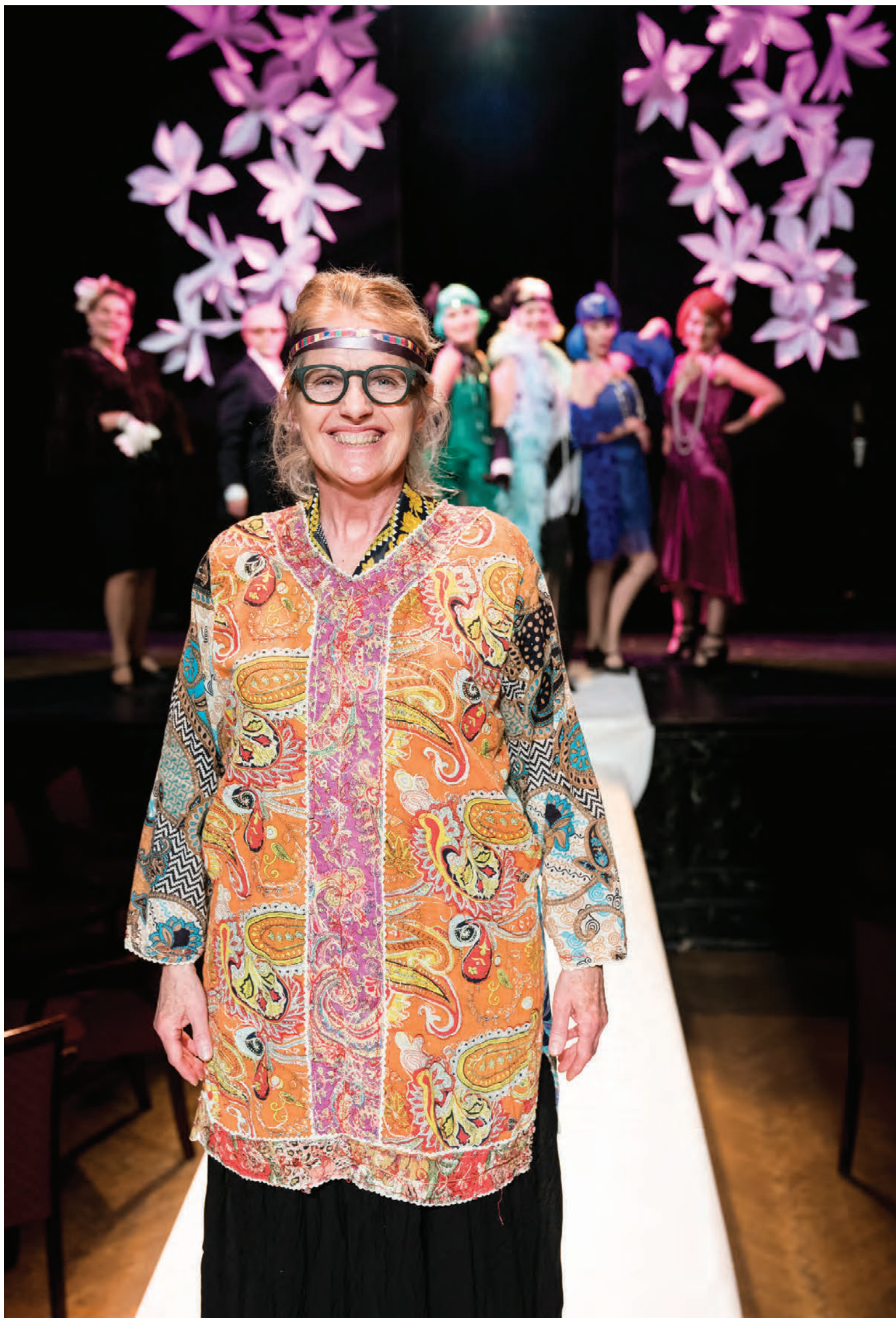
Edda verður sögumaður og mun leiða gjörninginn áfram.