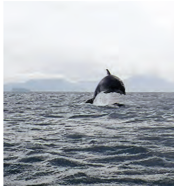
Höfrungar léku listir sínar fyrir þá félagi í nærri klukkutíma.