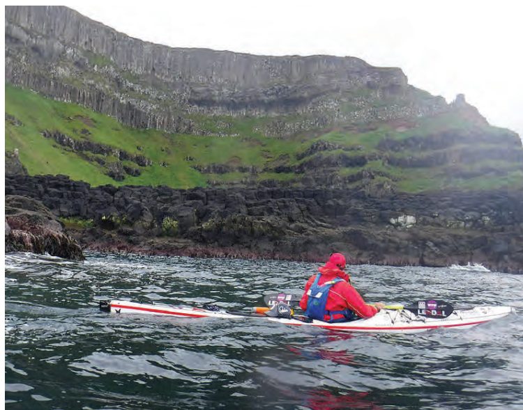
Landslagið á Írlandi er ægífastur enda þykir kajakfólki afar spennandi að ró við Írlandsstrendur. Veður geta þó verið válynd og straumarnir erfiðir.