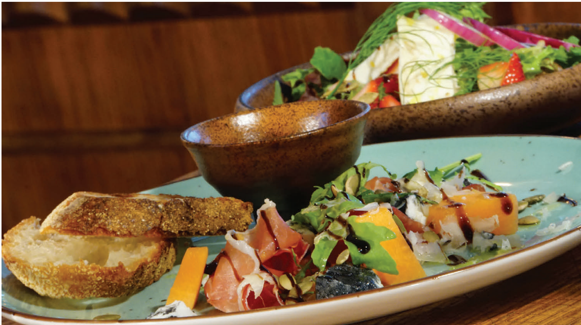
Þurrkað grísalæri „jamón“ með melónu, geitaosti og truffluolíu.