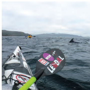
Ferðafélagar kajakræðaranna á hafi úti eru af ýmsum toga.