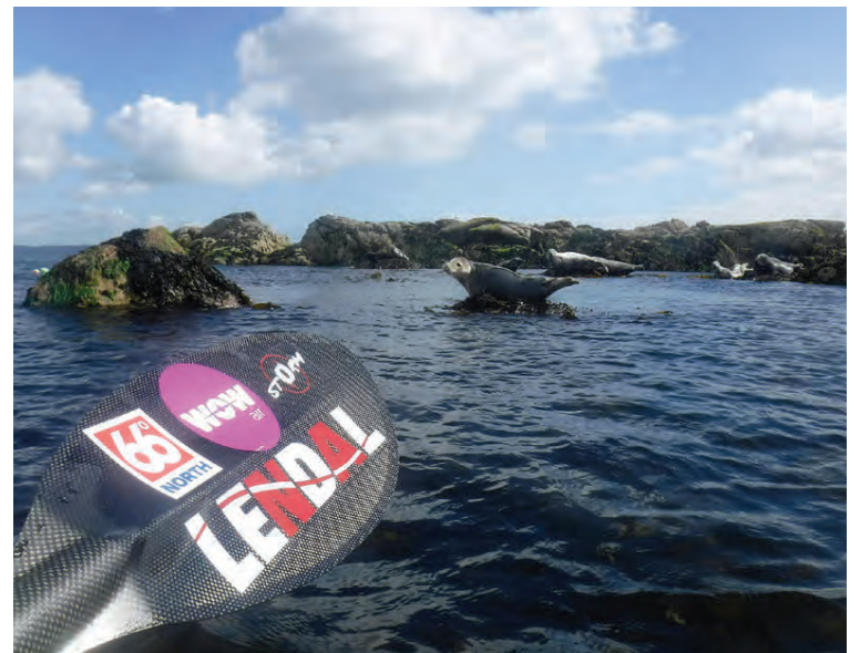
Dýralífið er fjölbreytt við strendur Írlands. Hér fylgjast nokkrir forvitnir seilr með ræðurunum fara hjá en virðast lítið kippa sér upp við truflunina.