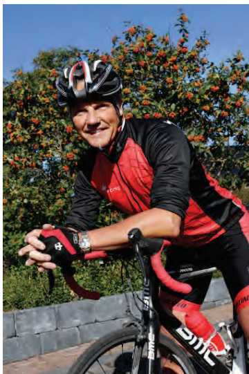
Hartmann fann kraftinn aftur þegar hann fór að taka Amínó 100% FISKPRÓTÍN og gat í kjölfarið stundað hjólræið af krafti á ný.

Þremur dögum seinna fór mér að liða betur, var kraftmeiri og