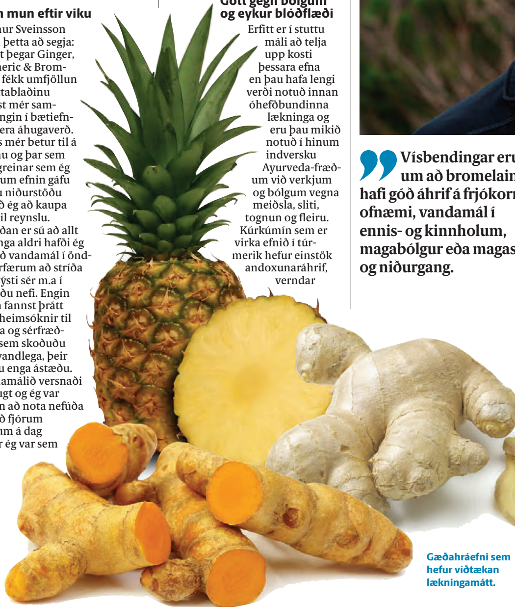
Gæðahræfni sem hefur viðtækan lækningamátt.

Sólustaðir: Flest apótek, heilsuþúðir og heilsuhillur verslana.