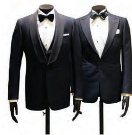
Hér má sjá dæmi um sjalkragasmóking (til vinstri) og smóking með tvíhneppuhyrndum kraga.

til kringum 1970 í tilraun til að nútímavæða smókinginn og hinn eini sanni James Bond (Sean Connery) var alltaf í þessari kragagerð. Hvaða kragi er valinn fer eftir því hvaða ímynd hinn smókingklæddi vill varpa fram, einhneppu kraginn er öruggur við allar aðstæður á meðan sá tvíhneppu vekur meiri