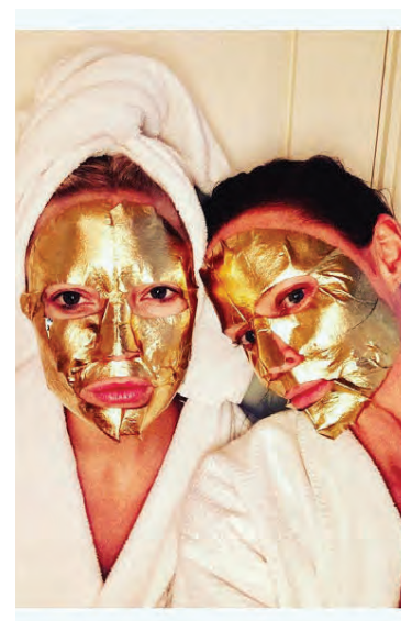
Leikkonan Kate Hudson og Stella McCartney tiskuhönnuður sýndu mynd á Instagram þar sem þær eru með gullmaska. Hann á að vera sérlega góður fyrir húðina.

Kóreskar konur hafa alla tíð hugsað sérstaklega vel um húðina. Vísindin þar í landi hafa fylgt því eftir og eru mjög framarlega á þessu sviði.