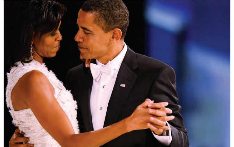
Barack og Michelle Obama en sá fyrrnefndi er þarna í einhneppuhyrnda smókingnum sínum.