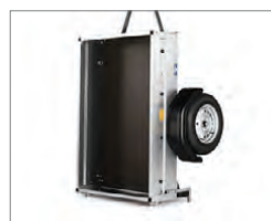
Hægt að geyma uppá rönd