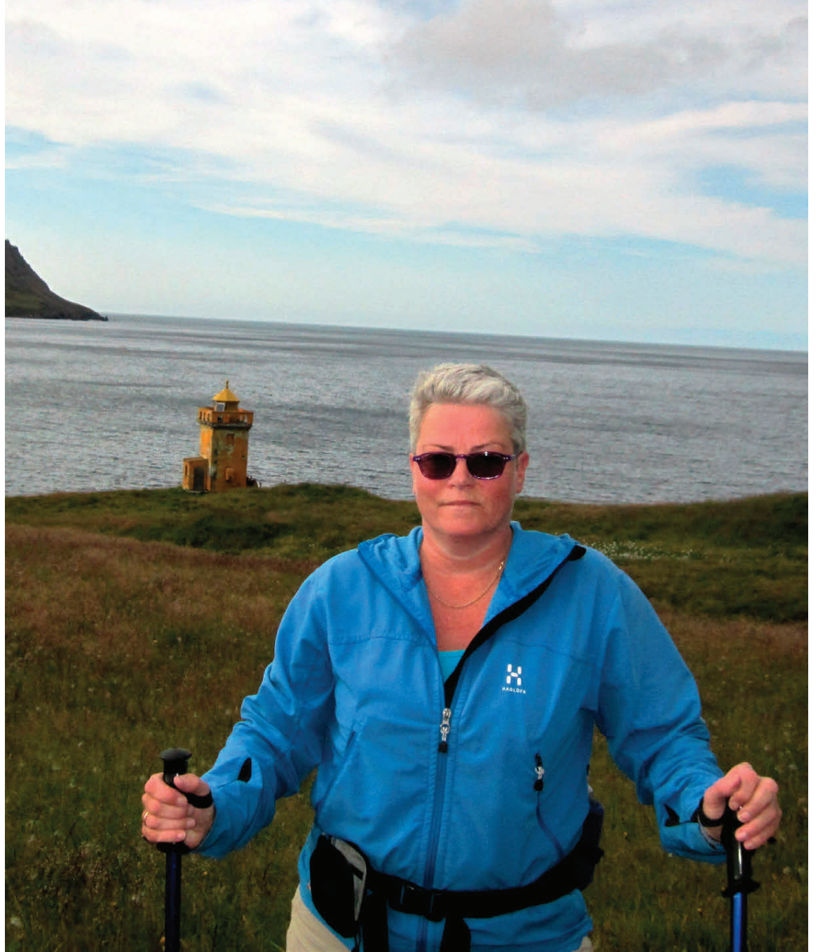
„Ég tel að einn merkasti áfangi sem ég hef náð með nemandi sé ungur einstaklingur sem hafði fengið heilablóðfall og núna, tveimur árum seinna, syndir hann daglega einn kílómetra þrátt fyrir að vera lamaður öðrum megin.“