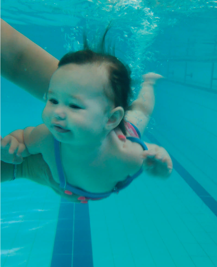
Sóley segir að það sé ótrúlegt hvað lítil börn geti gert í ungbarnasundinu.