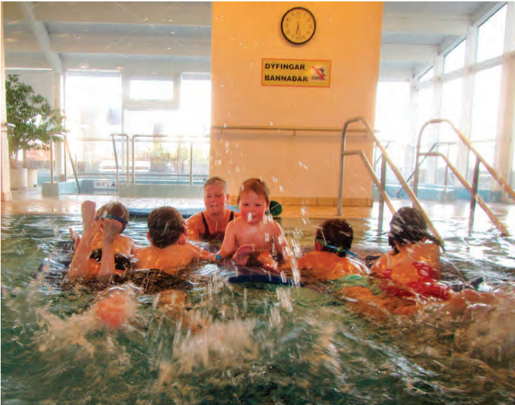
Það er oft mikið fjör á sundnámskeiðunum.