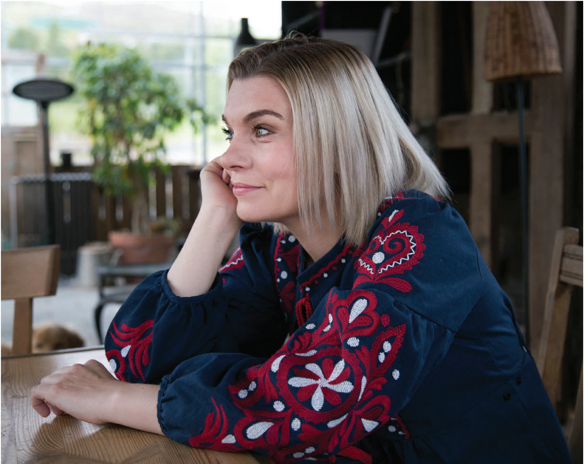
Nýja platan heitir Dare to Dream Small, eða Leyfðu þér litla drauma, en titillinn vísar í að vera sátt við lífið eins og það er hverju sinni.