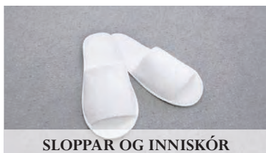
SLOPPAR OG INNISKÓR

SÍÐUMÚLI 1 | 108 REYKJAVÍK | SÍMI 788-2070 & 787-2070 | HOTELREKSTUR@HOTELREKSTUR.IS