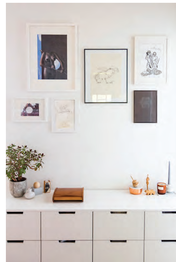
Á skenknum í forstofunni er samansafn hluta sem hjónin halda upp á.