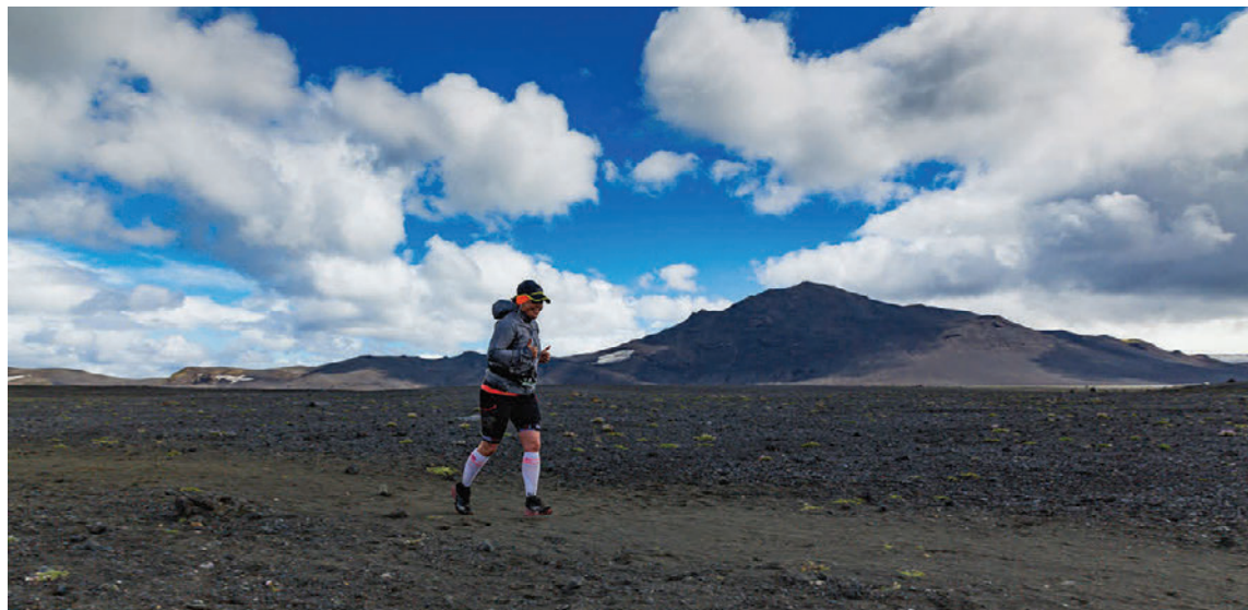
Ingvaldur hleypur Laugavegin 15. júlí í sumar.

Lífrænu rauðrófuhylkin frá Natures Aid eru 100% náttúrulegt bætiefni og góð fyrir alla sem vilja viðhalda góðri heilsu. „Það er mikill hægðarauki fyrir marga að geta tekið inn rauðrófuhylki því ekki eru allir jafn hrifnir af bragðinu af rauðrófunni eða rauðrófusafanum. Viðtökur Íslendinga