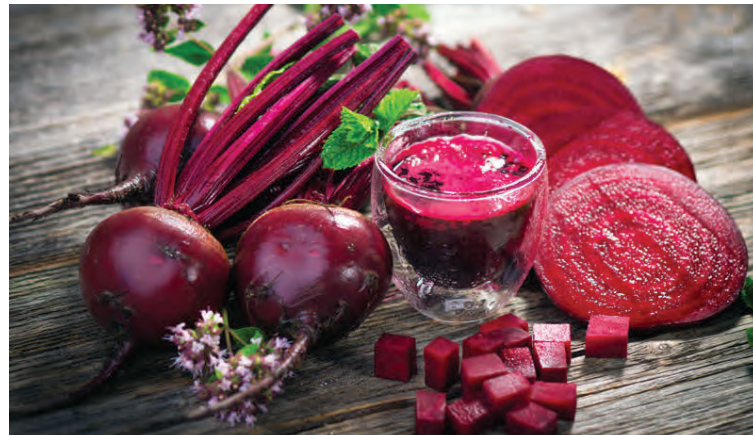
Rauðrófur eru sneisafullar af næringar- og plöntuefnum og innihalda m.a. ríkulegt magn af járn, A-, B6- og C-vítamíni, fólínsýru, magnesium og kalíum.

Rauðrófur eru af sömu plöntuætt og spínat, skrauthalaætt (Amaranthaceae) og tilheyra tegundinni Beta vulgaris. Þær eru sneisafullar