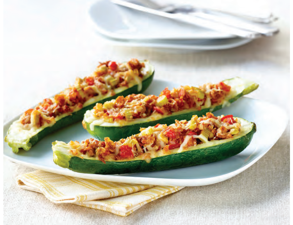
Kúrbíturinn er mildur en fyllingin þeim mun bragðmeiri.

Skerið lokið ofan af paprikunum, fræhreið þær og stingið þeim í sjóðandi vatn í 3-4 mínútur. Það er líka hægt að skera paprikurnar langsum. Saxið laukinn smátt og brúnið hann í olíu á pönnu. Sjóðið hrísgrjón. Hellið þeim í skál. Bætið svörtum baunum og tómötum í dós saman við. Bætið öllu kryddinu við og hrærið vel. Hellið loks megninu af ostinum saman við og blandið. Fyllið hverja papriku með hæfilegum skammti af fyllingu. Toppjið með rifnum osti. Bakið í 30 mínútur eða þar til osturinn er orðinn gullinbrúnn. Berið fram með góðu salati, tortillaflögum og salsa, ef vill.