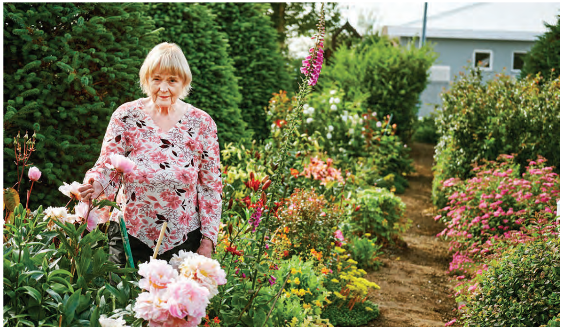
Nanna er 82 ára en sér um öll garðverkin sjálf, enda segist hún eldhress.

Nanna setur reglulega inn myndir af garðinum sínum á Facebook-síðuna Ræktaðu garðinn þinn – Garðyrkjuráðgjöf, sem er afar virkur og skemmtilegur hópur. „Ég fæ heilmikil viðbrögð. Fékk til dæmis sex hundruð læk á síðustu færsluna mína. Núna er jú allt mælt í lækum,“ segir hún og hlær.