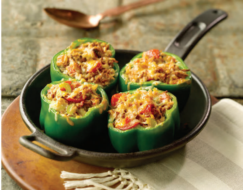
Paprikurnar smakkast vel með nachos og góðu salati.

Hvort sem þú ert grænmetisæta eður ei er vert að prófa meðfylgjandi rétti. Þeir eru báðir saðsamir og geta þess vegna staðið einir sem máltíð. Flestir mættu við því að bæta við sig grænmeti og er alls ekki vitlaust að bjóða stundum upp á grænmetismat í staðinn fyrir kjöt og fisk.