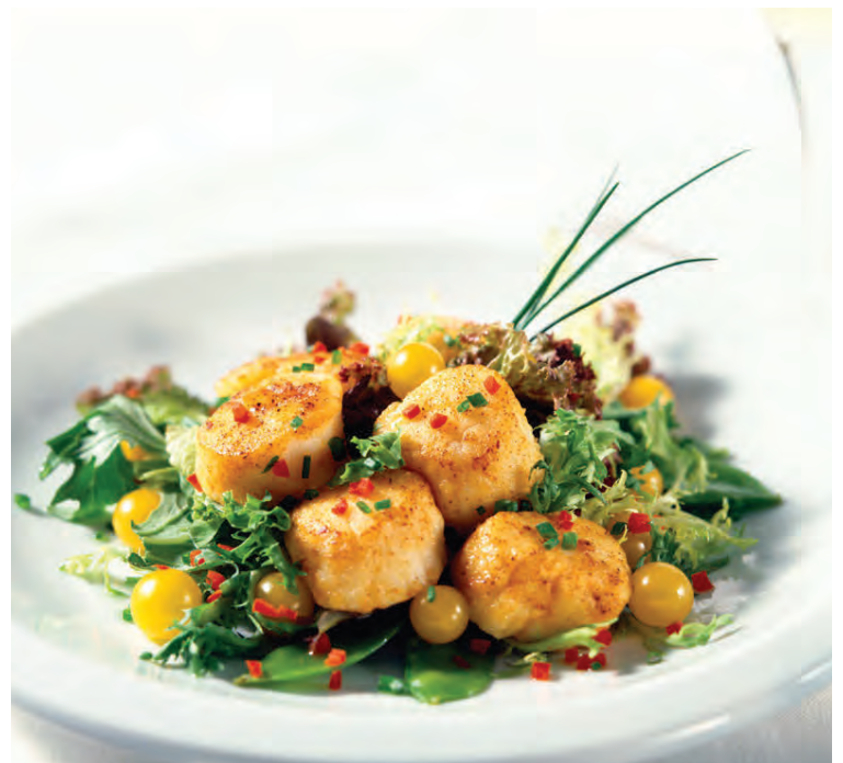
Girnilegur, fljótlegur og góður réttur. Upplagt að elda í góðu veðri.

Skerið hvítlaukinn smátt og vorlaukinn í litlar sneiðar. Setjið smjör á pönnu og steikið laukinn í smástund. Bætið þá bauninum á pönnuna og hitið í gegn. Hellið kjúklingakraftinum yfir og látið suðuna koma upp. Kælið aðeins en maukið síðan með töfrasprota og bætið salti og pipar við eftir smekk. Haldið maukinu volgu. Skerið fennel í þunnar sneiðar.