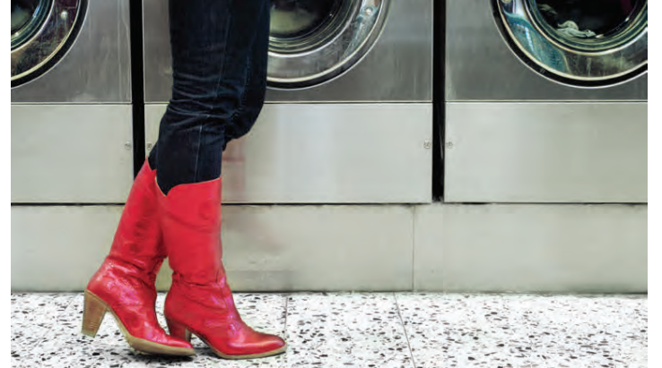
Rauð kúrekastígvél verða hæstmóðins í vetur.

á djamminu. Glitrandi sokkar innan undir hælaskó, bandaskó og sandala verða leyfðir og svo verða hvítir eða svartir skór með lógóum, mynstri og texta áberandi. Tvílitir skór í svörtu og hvítu skora hátt í vetrartiskunni en einnig verða skór í skærum jarðlitum í tisku. Líkt og undanfarið verða íþróttaskór í tisku, enda þægilegir og hentugir við mörg tækifæri en þeir verða í einföldum litum með glitrandi mynstri eða öðru sem lífgar upp á þá.