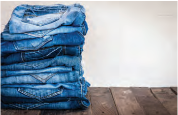
Sé vafi á hvaða númer af gallabuxum eigi að kaupa, á alltaf að velja minna númerið.

Kim Kardashian er fædd 21. október 1980. Hún er þekktust sem fyrirsæta og leikkona í eigin raunveruleikabáttum, Keeping Up with the Kardashians og Dancing With the Stars. Hún hefur verið gift bandaríska rapparanum Kanye West frá árinu 2014. Þau eiga tvö börn. Bæði Kim og Kanye eru elskuð af ljósmyndurum um allan heim. Þau hafa tvisvar heimsótt Ísland.