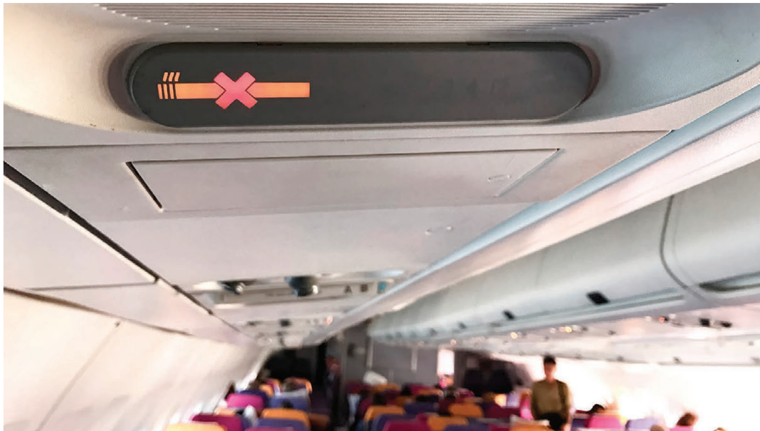
Máttu ekki reykja? Zonnic mint skammtapokinn hentar þar.

Athugið að lesa vandlega upplýsingar á umbúðum og í fylgiseðli fyrir notkun lyfsins. Leitið til læknis eða lyfjafræðings sé þörf á frekari upplýsingum um áhættu og aukaverkanir. Sjá nánari upplýsingar um lyfið á www.serlyfjaskra.is , www.zonnic.is