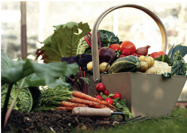
Garðyrkjufraeðingar Grasagarðs Reykjavíkur og matjurtaklúbbur Garðyrkjufélags Íslands, Hvannir, bjóða gestum og gangandi í spurt og spjallað í kvöld.

”Ef maður er ekki duglegur að hausti kemur það illilega í bakið á manni þar sem svo miklu meiri vinna biður að vori.