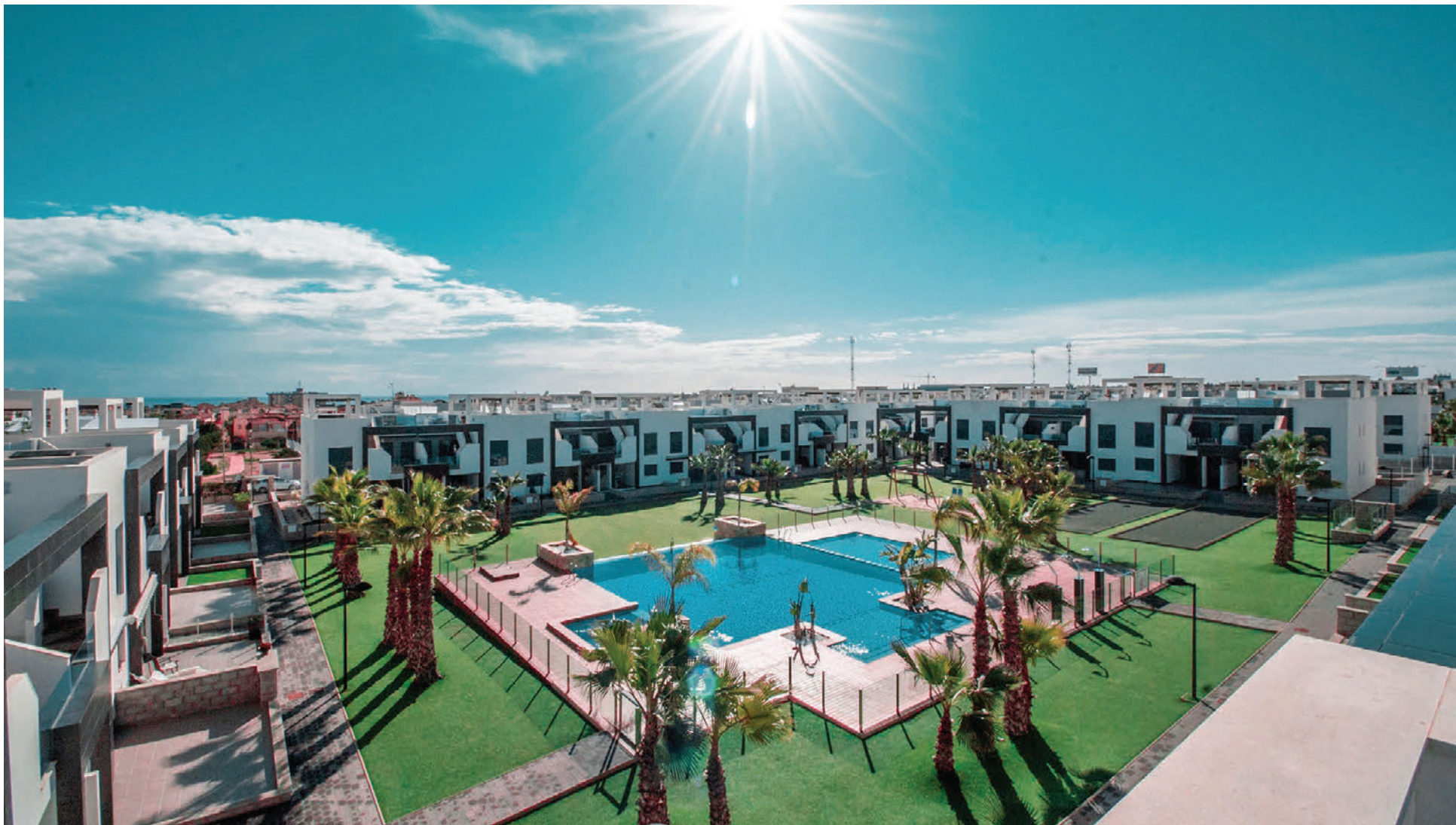
Glæsilegar íbúðir með sundlaug. Stutt í alla grunnþjónustu.