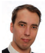
Artjón Ámi Löggiltur fasteignasali Sími 612 1414