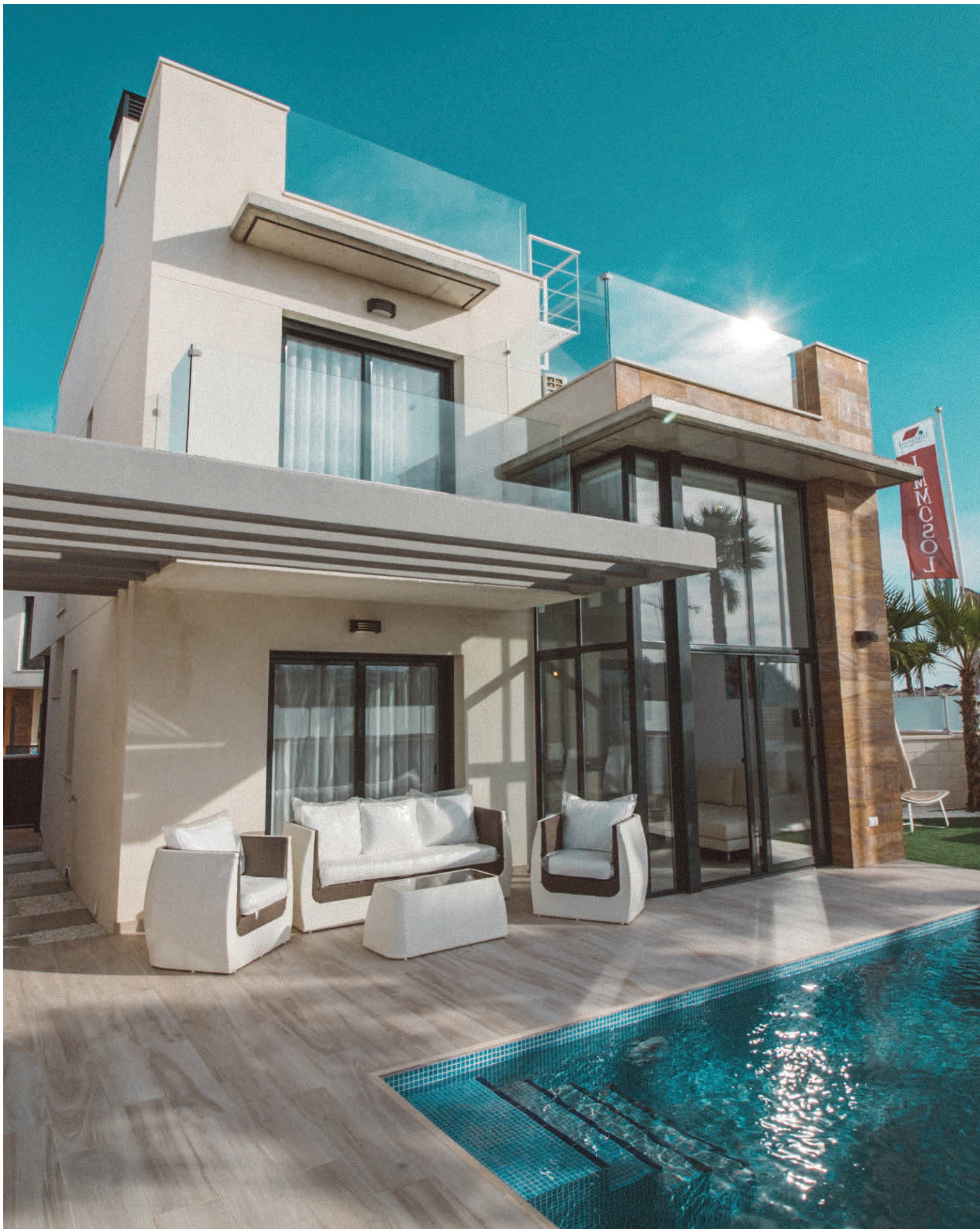
Fallegt einbýli með sundlaug.