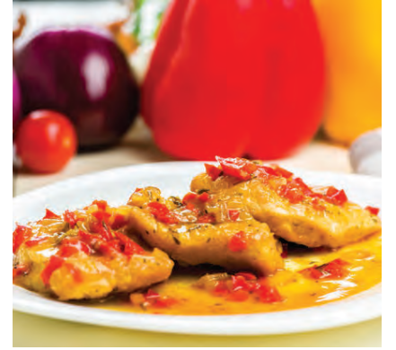
Kjúklingur í mangósósu er ákaflega ljúffengur réttur fyrir alla fjölskylduna.

Kjúklingabringurnar eru saltaðar og pipraðar. Brúnið þær á pönnu á báðum hliðum og setjið síðan í eldfast mót. Blandið saman mango chutney og appelsínusafa, jógúrt, karri, salti og pipar. Hellið blöndunni yfir kjúklinginn og bakið við 180-200°C í um það bil 30 mínútur. Þegar rétturinn er tekinn út er ferskt kóriander sett saman við. Rauður chilli-pipar, agúrka og rauðlaukur eru síðan til að punta réttinn í lokin. Borið fram með hrisgrjónum og naan-brauði.