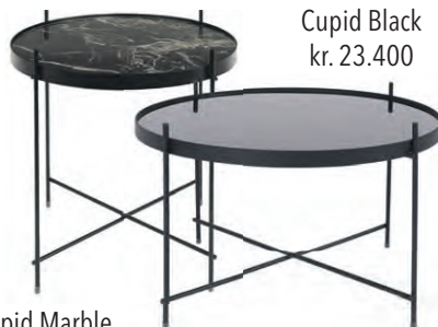
Cupid Black kr. 23.400