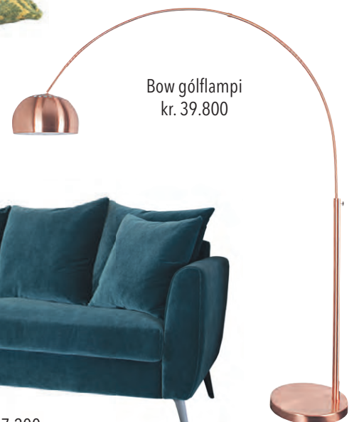
Bow gólf lampi kr. 39.800