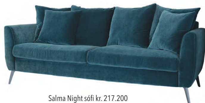
Salma Night sófi kr. 217.200