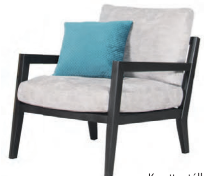
Karetta stóll kr. 88.600