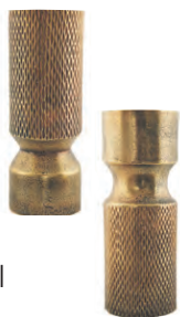
Cast vasar kr. 5.490