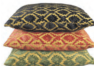
Glory púðar kr. 6.700