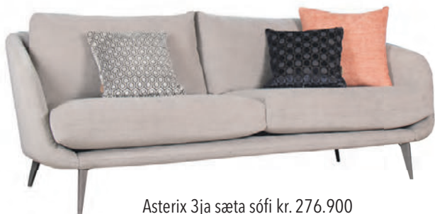
Asterix 3ja sæta sófi kr. 276.900