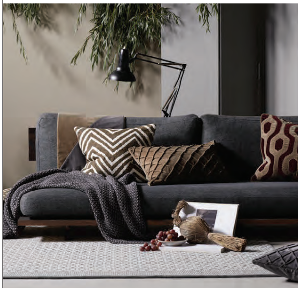
MOTTUR OG PÚÐAVER

Vorum að opna á nýjum stað. Verið hjartanlega velkomin til okkar á Hljómalindarreit | Hverfisgötu 32.