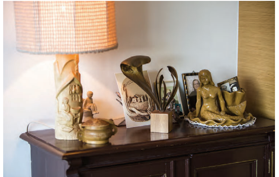
Magnea er listakona af guðs náð. Hún skar út askinn og lampafótinn eftir eigin teikningu af konu í baðstofu, skapaði hafmeyjuna úr leir og listaverk úr kopar.