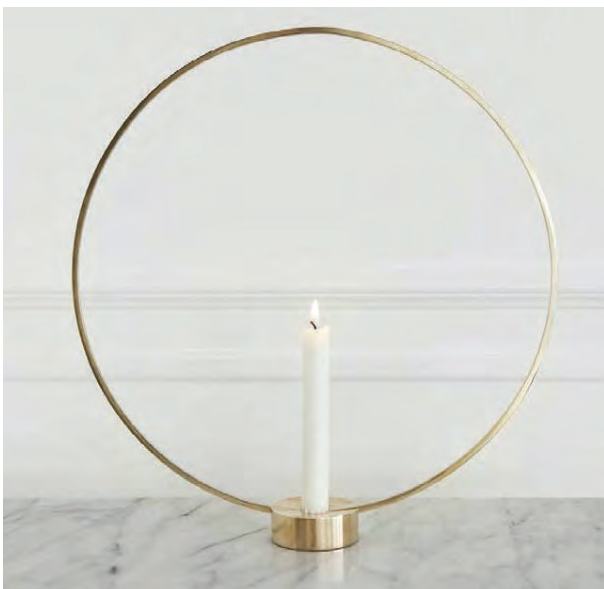
GJAFA- OG LÍFSTÍLSVÖRUR