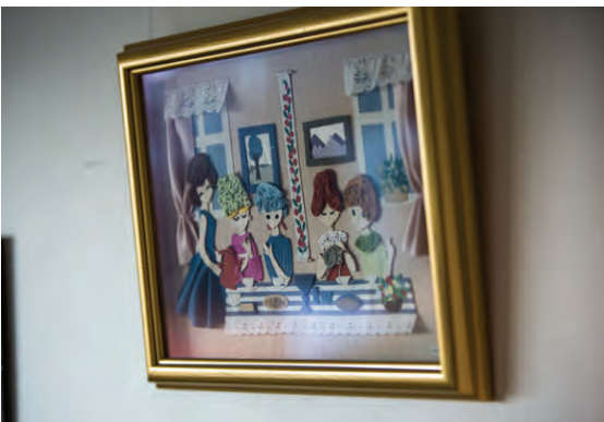
Þessi mynd af vinkonum er í dálæti hjá Magneu sem sá hana í blaði og ákvað að endurgera hana úr filti, garni, blúndum og efnum.