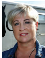
Femarelle skiptir Valgerði miklu máli.