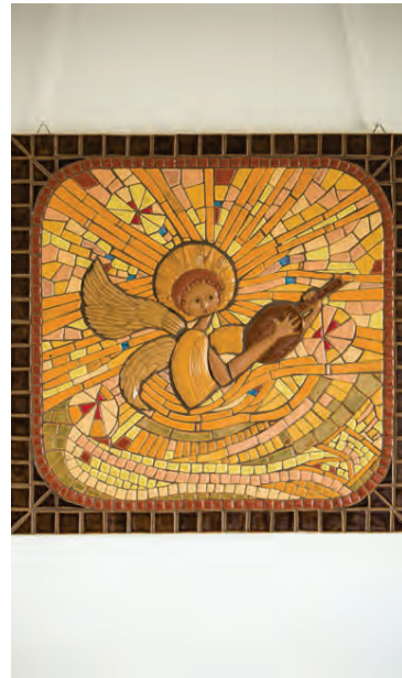
Magnea handgerði hverja einustu flís í þessu gullfallega mósaikverki sínu.