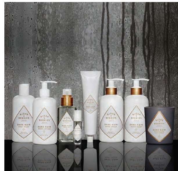
SNYRTI- OG ILMVÖRUR