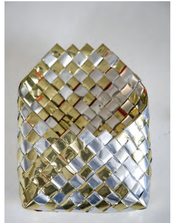
Kaffipokar verða að hátísku í meðförum Astridar.