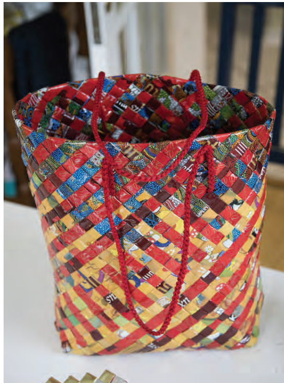
Taska úr kaffipokum.

Á unglingsárunum lærði Astrid orkeringu en það er gamalt handverk sem tilheyrir íslenska þjóðbúningnum og var um tíma við það að deyja út. „Þegar ég var komin í gaggó langaði mömmu að kenna mér að orkera en hún hafði lært