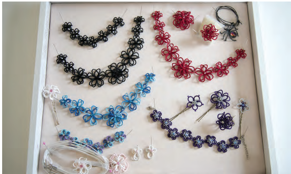
Skart sem er gert með orkeringu.