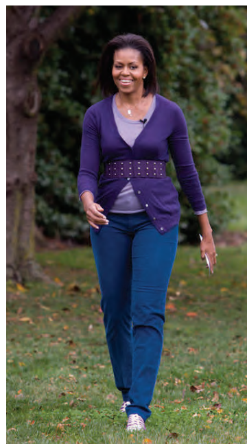
Michelle Obama er ófeimin við óformlegan klæðnað.