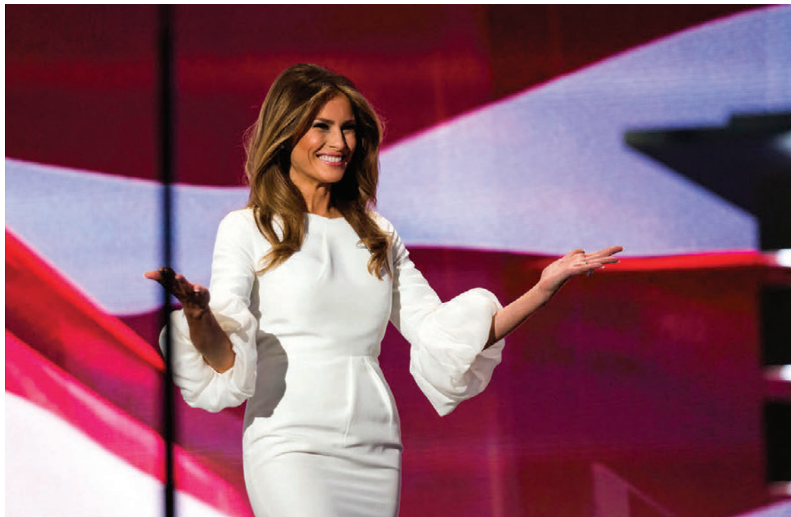
Melania Trump vandar sig við fatavalið.

Grandagarði 9 - Sími 517 3131 - sjavarbarinn.is