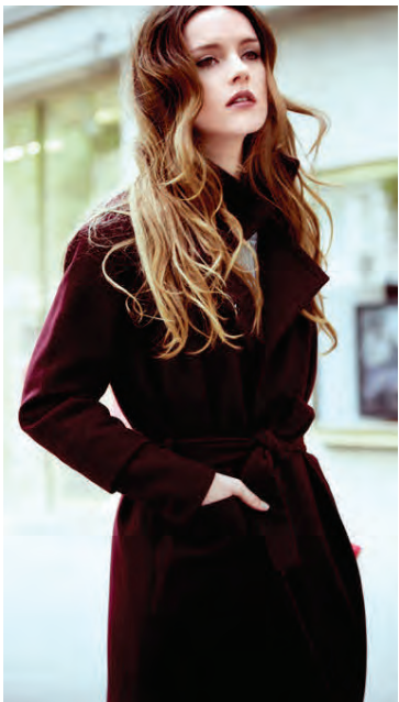
Vínrauður hefur verið áberandi í hausttískunni í ár.

Senn koma jólin, en fyrst jólahlaðborðin. Tími til að skarta sínu fegursta og skína eins og glitrandi jólasbraut í góðra vina hópi. Við slík tækifæri er punkturinn yfir i-ið réttur varalitur í stíl við spari-dressið. Djúpir litir í bland við léttu og ljóssanseraða tóna eru hæstmóðins í vetur, hvort sem það er klassiskur jólarauður, fölbleikur, dumbrauður, appelsínugulur með frostáferð, vínrauður, mattur hörundslitur eða glansandi glært gloss. Þó er einn litur í varalitatisku vetrarins sérlega viðeigandi þegar nær dregur hátíðum og það er brons, sanserað eða gull til að fullkomna kyssilegan stútinn og slá í gegn. Gull er enda hlýlegt, djarft, konunglegt og töff.