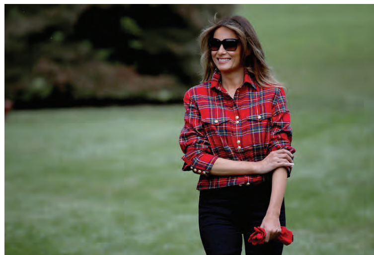
Melania í 150 þúsund króna köflóttri skyrtu.

Auðvitað er í góðu lagi að ríkt fólk klædist dýrum fötum. Fötin í fataskáp Melaniu eru ekki borguð með skattpeningum og aðdáendur hennar dást að útliti hennar og