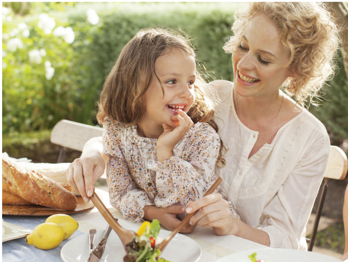
Það þurfa allir að leggjast á eitt að huga að umhverfi sínu. Framtíðin liggur í hreinni náttúru.

Kryddjurtir á borð við timían, rós-marín, majoran, estragon, baunajurt, dill og steinselju henta vel til þurrkunar. Flækjustigið er ekki hátt, því á sumrin getur verið nóg að leggja jurtirnar í gluggakistuna. Vika ætti oftast að duga en þá er