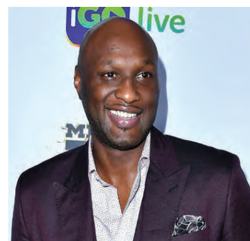
Lamar Odom fagnar eflaust hverjum afmælisdegi.