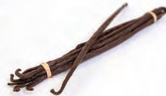
Með góðri vanillustöng er hægt að útbúa eigin vanillussykur.

500 g haframjöl 80 g smjör 80 g sykur 80 g síróp að smekk eða eplasafi 75 g möndlumsmjör ¼ tsk. salt ½ tsk. kanilduft 50 g hnetur