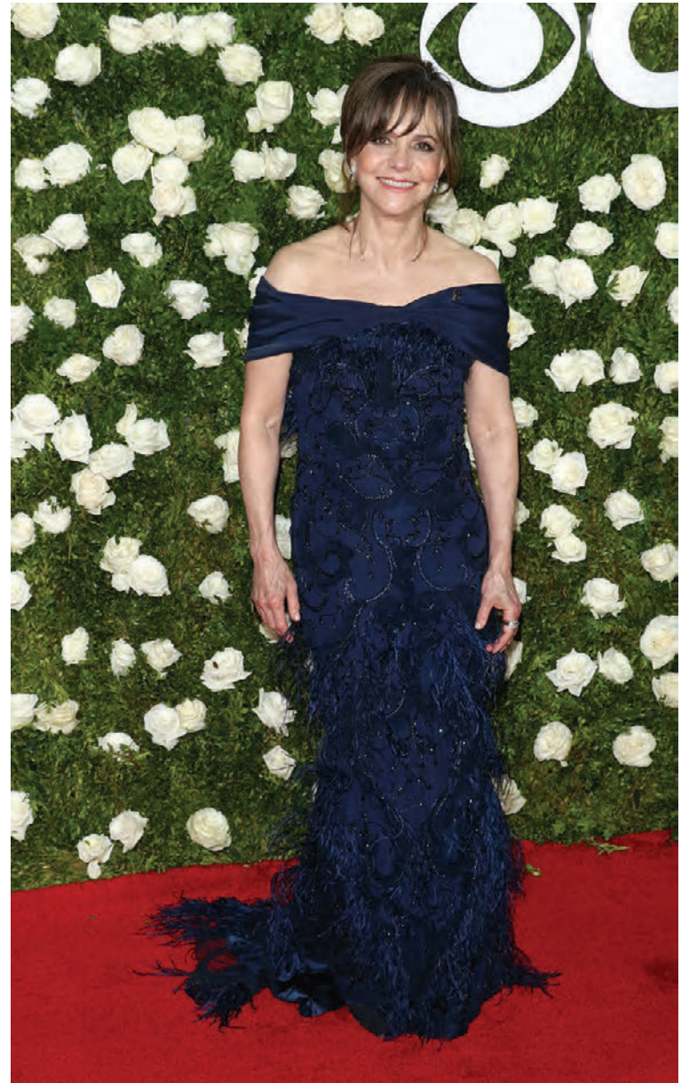
Sally Field fagnar 71 árs afmæli í dag.