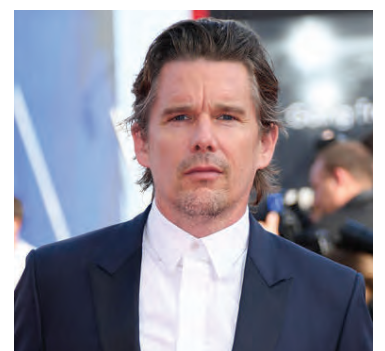
Ethan Hawke leikari á afmæli í dag.