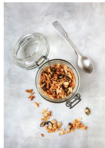
Heimager múslí er hollt og bragðgott.

1) Hitið ofninn í 180°C gráður. Bræðið saman sykur, síróp og vatn. Bætið síðan möndlumsmjöri og vanillussykri saman við og hrærið. 2) Dreifið haframjöli og möndlum á bökunarplötu, blandið öðru hráefni út á og veltið saman. 3) Bakið í 15-20 mínútur og hrærið í blöndunni á meðan hún bakast. Múslíð er tilbúið þegar það hefur brúnast með sykurblöndunni og er orðið stökkt.