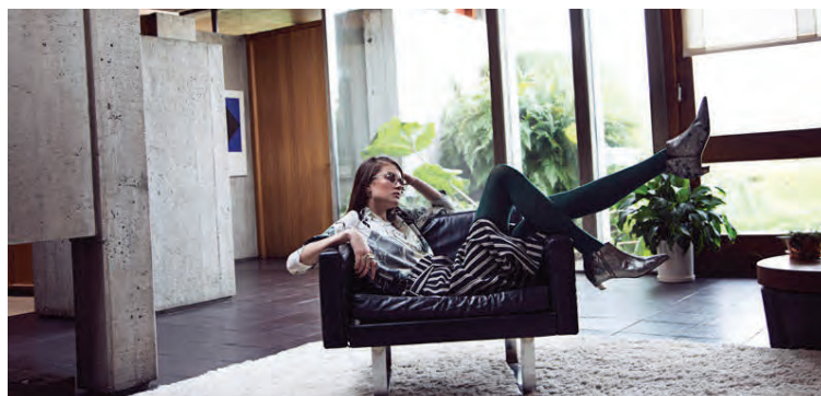
Litatonar njóta sín vel með hrárra steypu og mildum við.