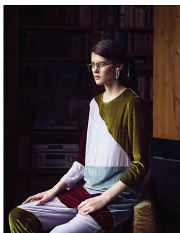
Litavalið tengist einnig gönguferðinni, dumbrauðum litum hraunsins og gulgrænum mosa.