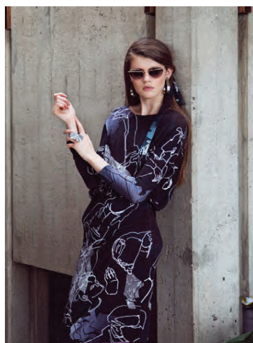
„Mynstur hverrar línu verður þannig eins konar ferðasaga," segir Hilda.

BANKASTRÆTI 7A - 101 REYKJAVÍK - S. 562 3232