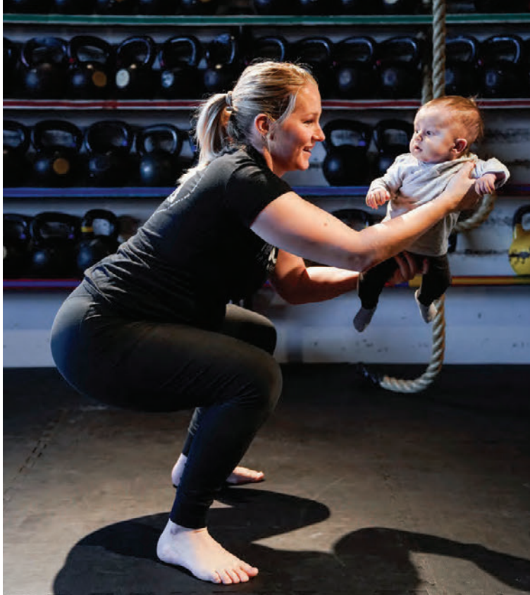
Halla í æfingaprógrammi með barnið.

En hvornig hreyfingu er mælt með ef allt er með felldu? „Hvers kyns hreyfing er af hinu góða og ættu flestar konur að geta haldið áfram þeirri hreyfingu sem þær eru