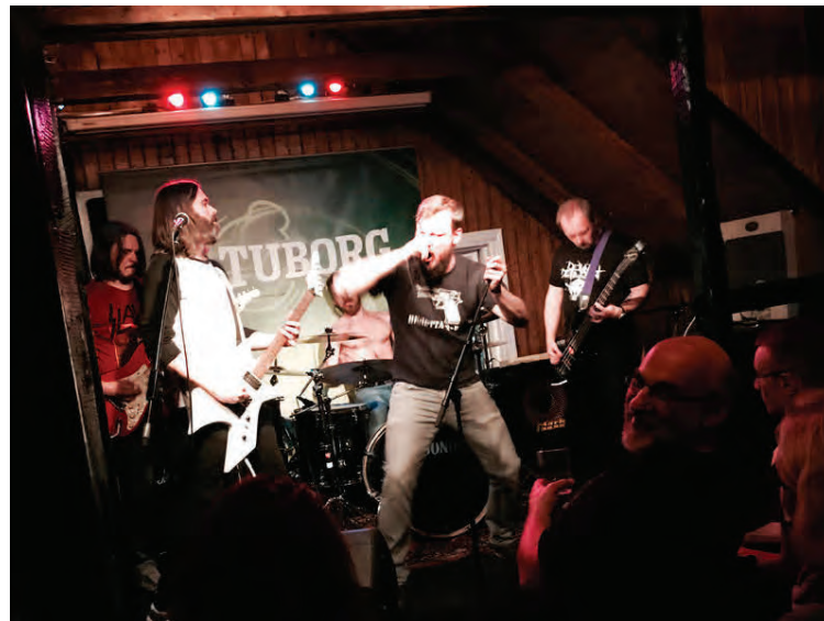
Óværa á sviði.

dag hlusta ég á alls konar tónlist, en í rokkinu finnst mér til dæmis Deafheaven, Full of Hell, Nails og Converge vera að gera áhugaverða hluti. Ég hef alltaf haldið mig við blöndu af pönki og þungarokki. Ég hef aldrei spilað neitt sem er mjög áhlustanlegt,“ segir hann og hlær.