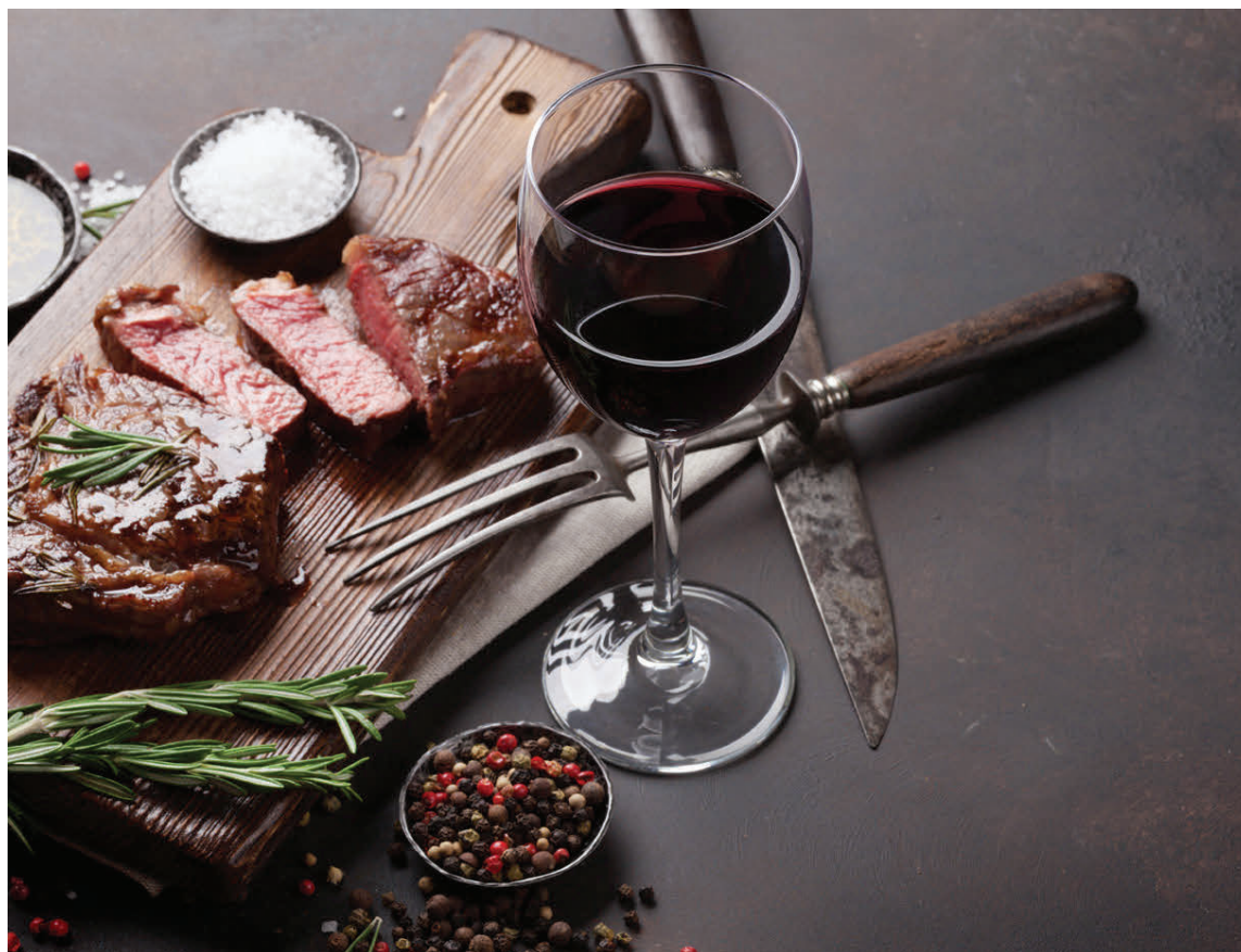
Hvað er betra en nautasteik á dimmu vetrarkvöldi.

Skrælið kartöflur og lauk og skerið í sneiðar. Leggið kartöflusneiðarnar í eldfast mót og bragðbætið