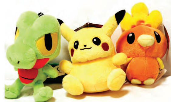
Það er gaman að fara á skiptimarkað með dótið sitt.

Upplýsingar um aðengi er að finna á www.andrymi.org .