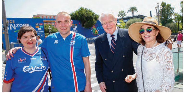
Guðni Th. Jóhannesson, forseti Íslands, gaf Hollvinum Grensás landsliðstreyjuna frægu sem verður boðin upp í dag.

Á basarnum verður hægt að fá margs konar handunna listmuni, ullarvörur, skinnavörur, kransa og jólaljós, sem og nýbakaðar tertur og brauð. Mörg fyrirtæki gefa veglega happdrættisvinninga og liðsmenn Sniglanna, vélhjólasmataka lýðveldisins, baka vöflur og hita súkkulaði. Allur ágóði af jólabasarnum fer í kaup á nauðsynlegum búnaði og endurbætur á allir aðstöðu fyrir skjólstaðinga og starfsfólk Grensáss.