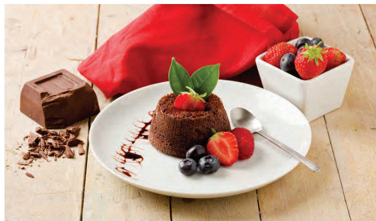
Guðdómleg súkkulaðikaka sem allir elska.

með salti og pipar. Laukurinn fer yfir þær en síðan rjómi og rifinn ostur. Bakið í 200°C heitum ofni í 45-50 mínútur.