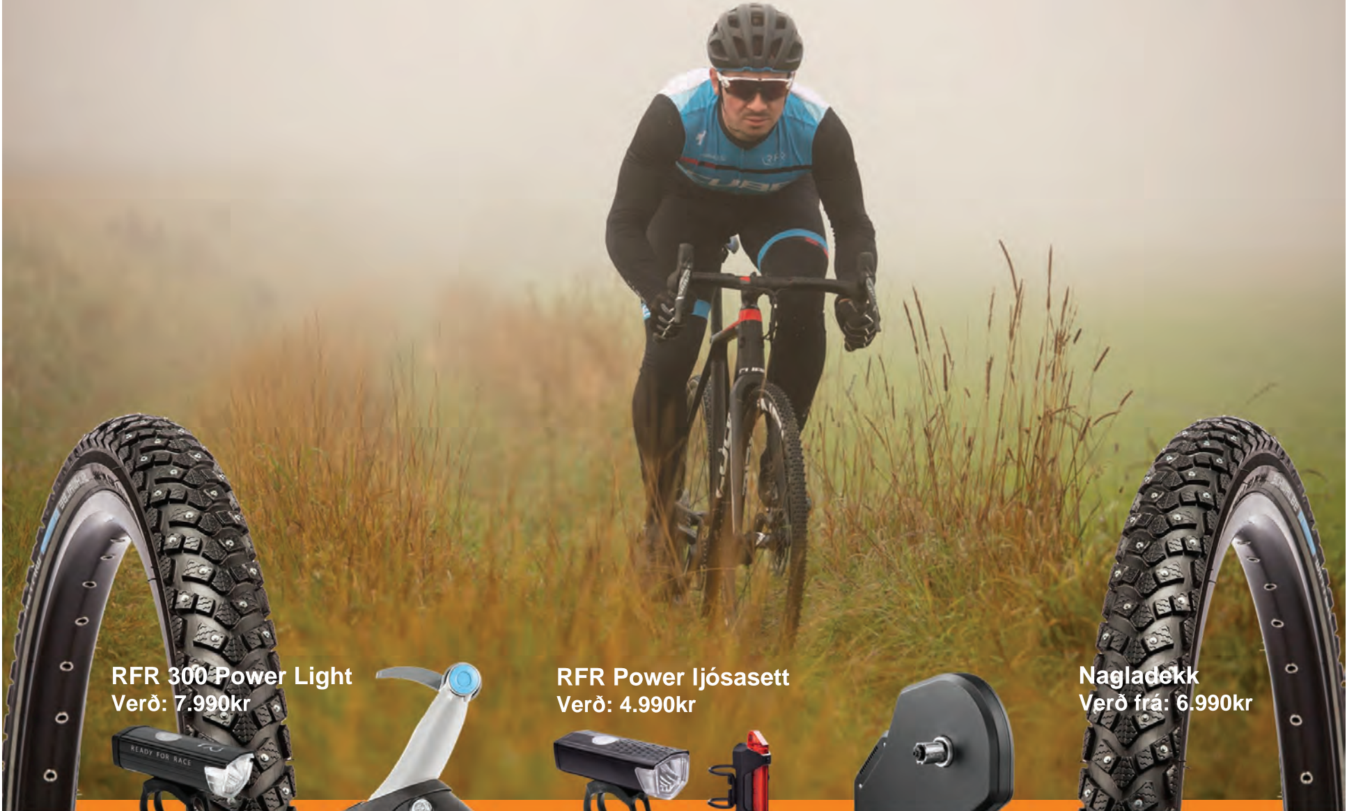
RFR 300 Power Light Verð: 7.990kr