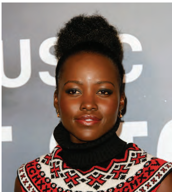
Lupita Nyong'o er fyrsta konan frá Kenía til að hljóta Óskarsverðlaun.

» Breytingin á Lupitu var ekki gerð af einhverju hatri heldur mun frekar af fáfræði þótt það sé engin afsökun.