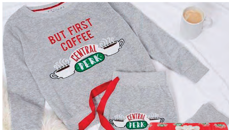
Þessi renna út í Primark í Bretlandi.

eiga að vera í falletum náttfötum í rúminu, maður á alltaf að gæta að virðingu gagnvart sjálfum sér,“ segir sérfræðingurinn.