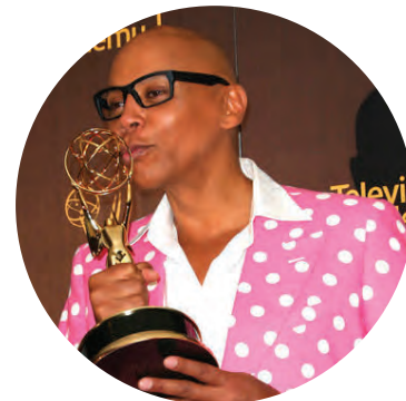
RuPaul Charles með Emmy-verðlaunin sem hann vann fyrir RuPaul's Drag Race.

hliðarþættir og þáttaröð sem gefur nánari innsýn bak við tjöldin.