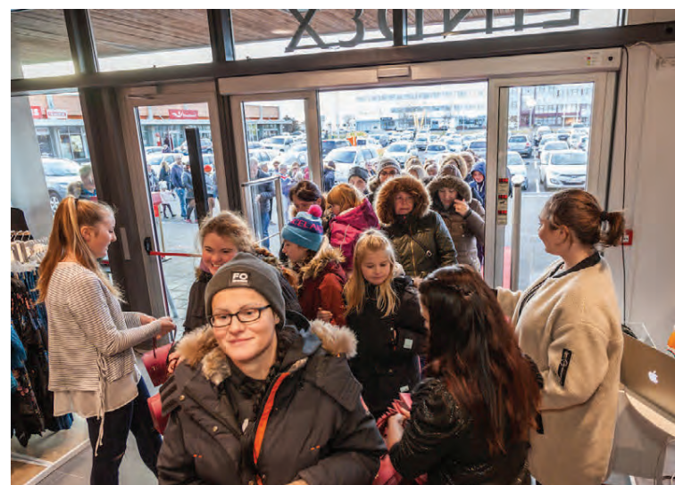
Löng röð myndaðist fyrir utan verslunina fyrir opnun.