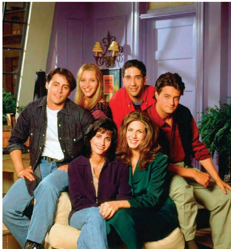
Svo virðist sem vinirnir í bandarísku þáttunum Friends fari aldrei úr tisku.