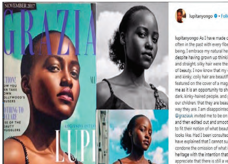
Þessi mynd er fengin á Instagram þar sem Lupita fjallar um hárklippinguna

Lupita Nyong'o fékk Óskarsverðlaun fyrir leik sinn í 12 Years A Slave árið 2014 og hefur vakið mikla athygli. Hún á ættir að rekja til Kenía og var alin upp þar til sextán ára aldurs þegar hún flutti til Mexíkó þar sem hún lærði spænsku. Þegar Lupita hlaut Óskarsverðlaunin var hún fyrsti