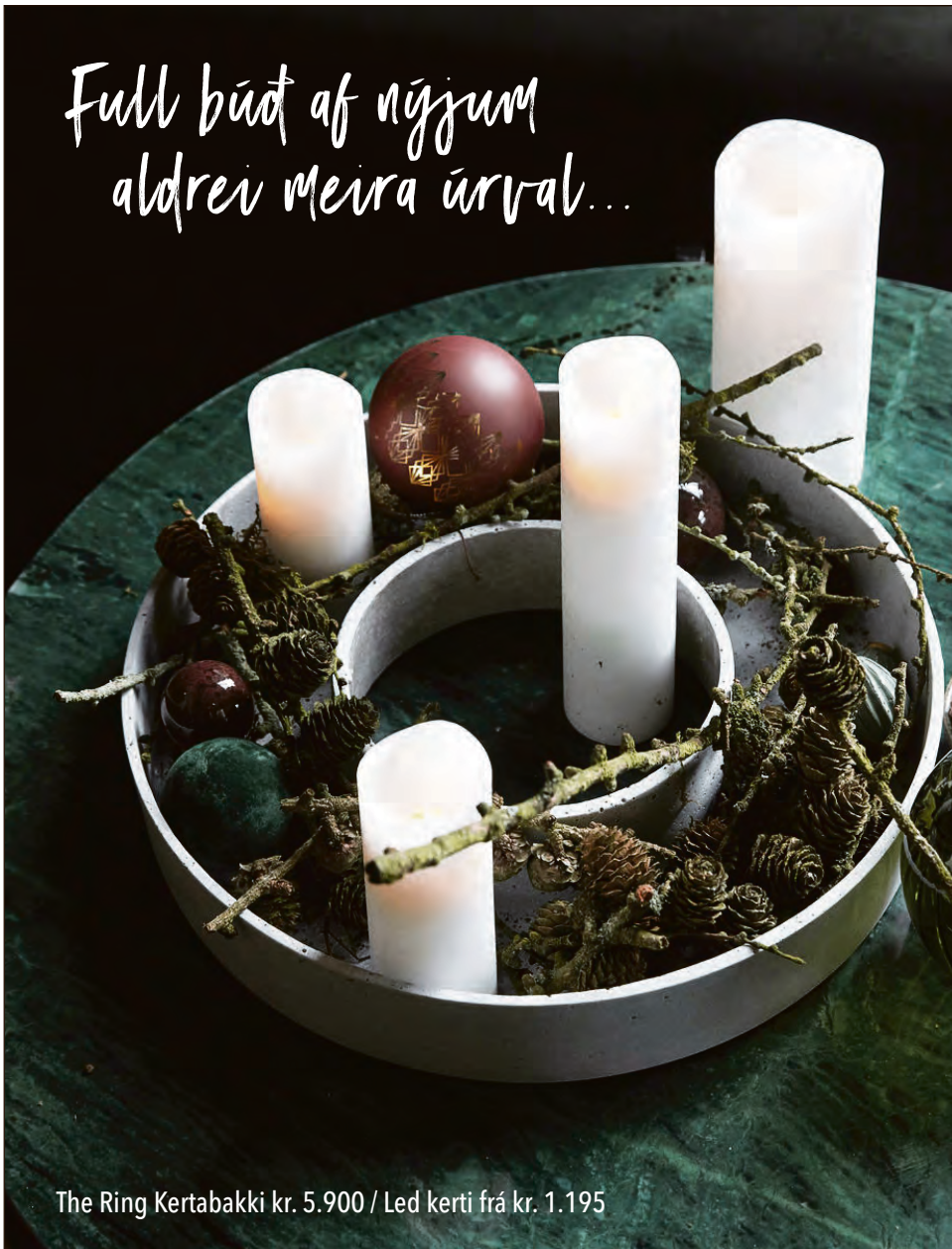
The Ring Kertabakki kr. 5.900 / Led kerti frá kr. 1.195