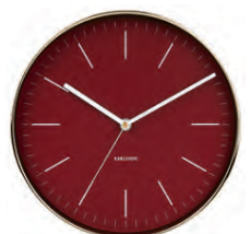
Minimal Klukkur kr. 8.900