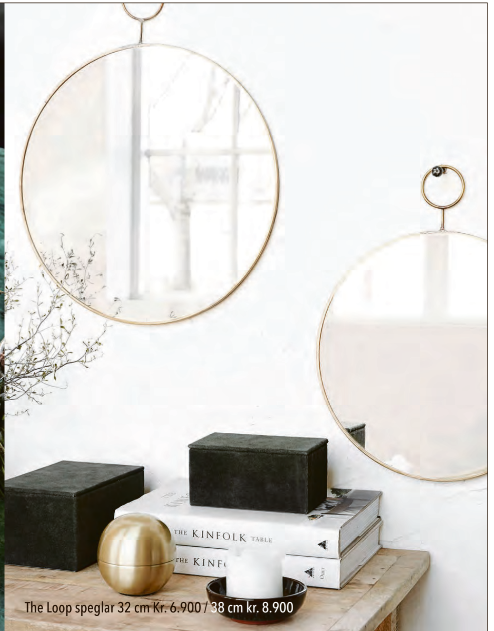
The Loop speglar 32 cm Kr. 6.900 / 38 cm kr. 8.900