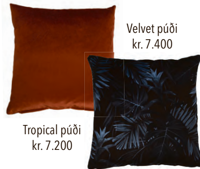
Velvet púði kr. 7.400