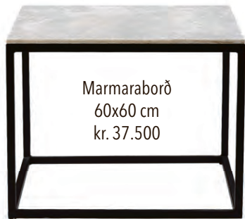
Marmaraborð 60x60 cm kr. 37.500