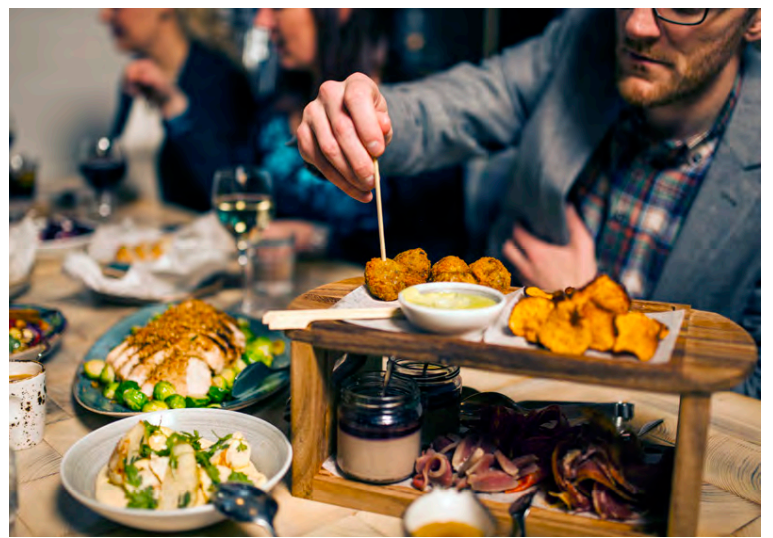
Hér má sjá deilirétti frá Slippbarnum en hægt er að kaupa gjafabréf sem gildir sem inneign á öllum hótélum, veitingastöðum og heilsulindum Icelandair hótela. Handhafi velur svo þá upplifun sem heillar mest.

Geiri Smart Restaurant: Þriggja rétta kvöldverður fyrir tvo. VOX Restaurant: Lystauki og tveggja rétta kvöldverður fyrir tvo. Slippbarinn: Klassík fyrir fjóra – fjölbreyttir réttir til að deila og njóta saman. Satt Restaurant: Þriggja rétta kvöldverður með vinnflösku hússins fyrir tvo. Það er því kjörið að velja sér jólaboð við hæfi og þegar þú ert á staðnum getur þú grajað jólagjafirnar um leið og notið aðventunnar.