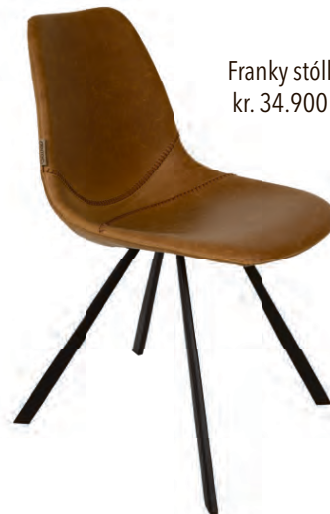
Franky stóll kr. 34.900