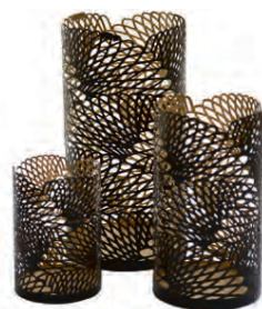
Fan luktir frá kr. 2.400