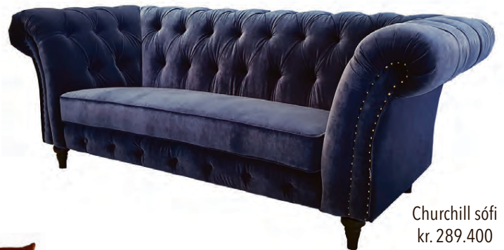
Churchill sófi kr. 289.400