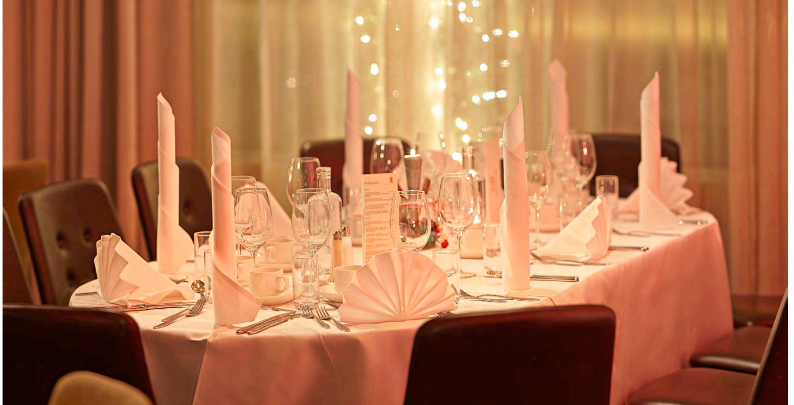
Hátiðleg stemning á Satt Icelandair hótél Reykjavík Natura.

„Að vinna að markaðsmálum og viðskiptaþróun hjá Icelandair hótélum er ótrúlega fjölbreytt starf