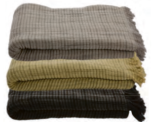
Skagerak Kúruteppi kr. 12.400