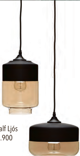
Half&Half Ljós kr. 17.900