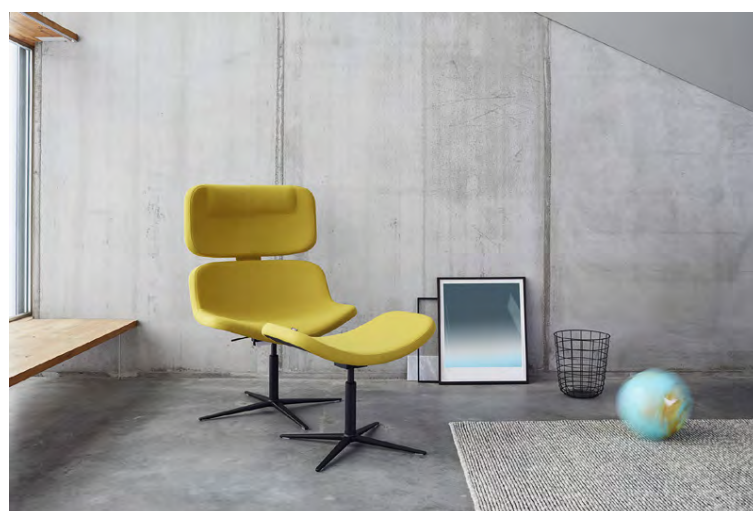
Hljóðstóll. Kiktu við til að fá að vita meira.