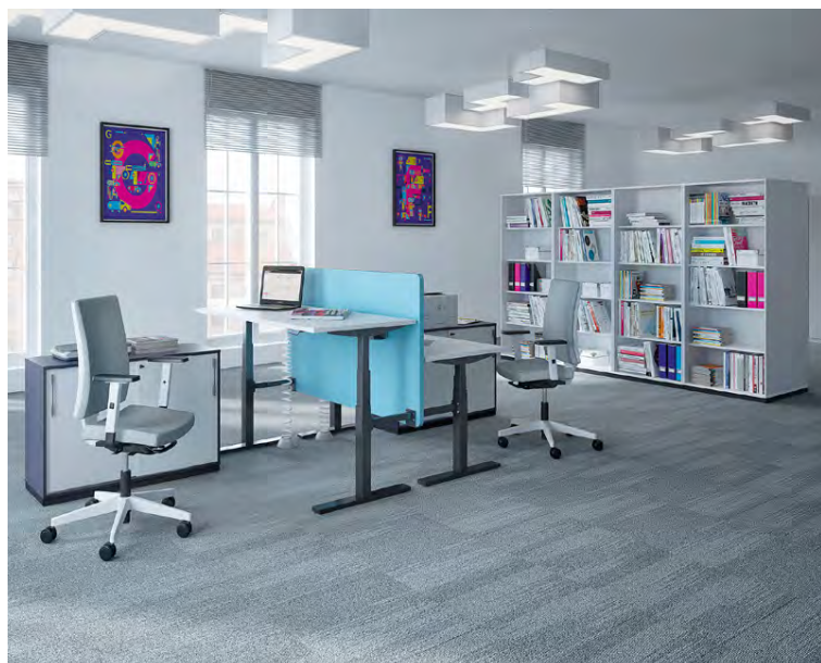
Nútímaleg skrifstofa með öllum þægindum.