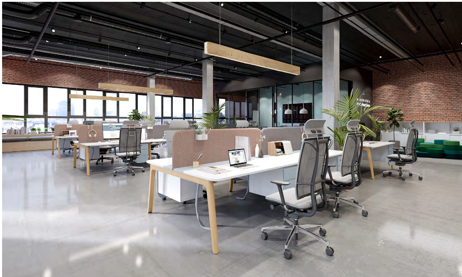
Á morgun verða sérfræðingar í versluninni og aðstoða með rétt val á skrifborðsstólum og öðrum húsgögnum.

Áriðandi er að skrifborðsstólar sú þægilegir.