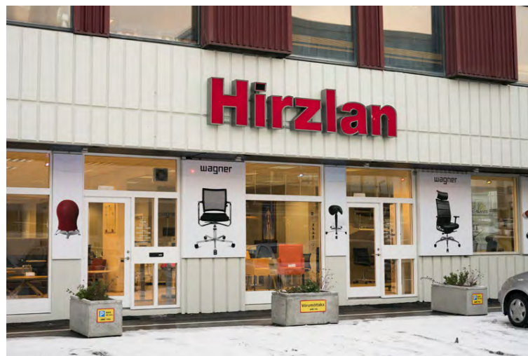
Hirzlan er í Siðumúla 37.