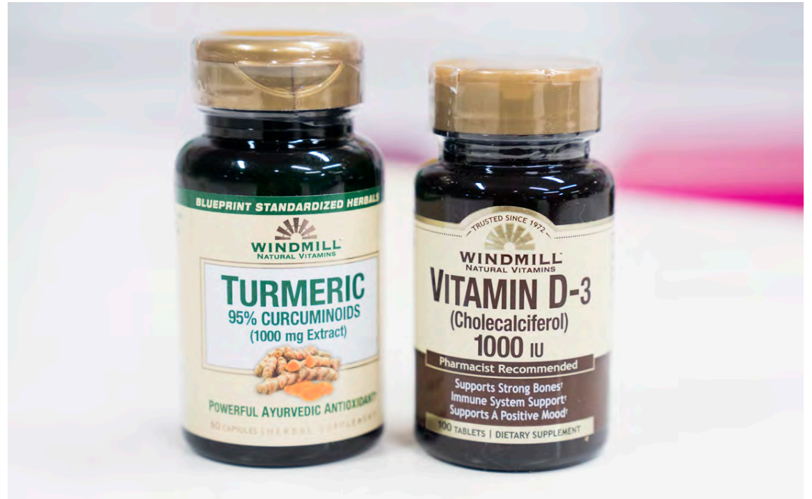
Túrmerik og D-vítamín hafa frá upphafi verið vinsælust í flokki vítamína og fæðubótarefna.