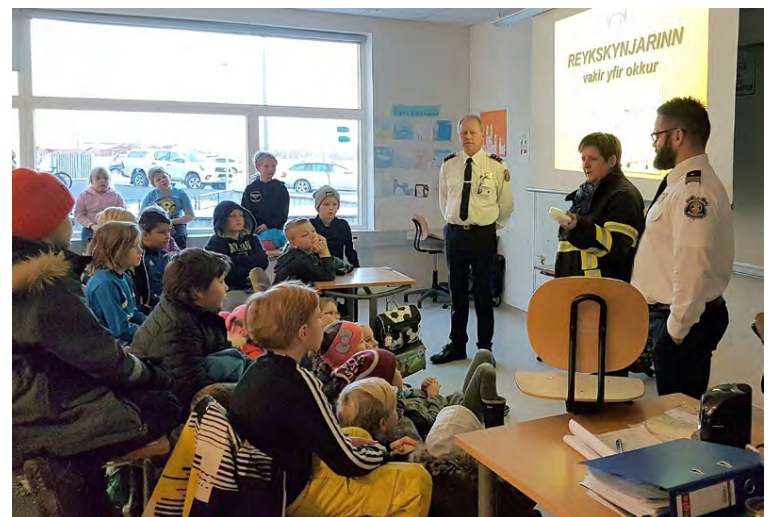
Sunnulækjarskóli á Selfossi var fyrsti skólinn sem var heimsóttur í ár.