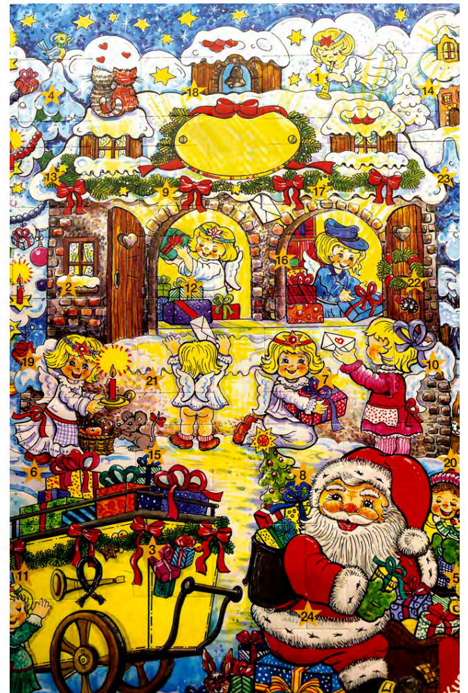
Börnin mega opna fyrsta gluggann í jóladagatalinu á föstudaginn.

Jólaþorpið í Hafnarfirði verður opnað á föstudag. Venjulega er margt um manninn í jólaþorpinu og margt um að vera.