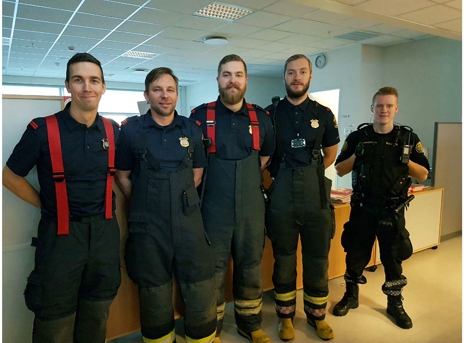
Nokkrir hressir liðsmenn Brunavarna Árnessýslu sem heimsækja nokkra grunnskóla á næstu dögum.

ár, að sögn Hauks. „Það eru fáir sem taka eins vel á móti okkur og börnin. Þau eru líka mun meðvitaðri um eldvarnir í dag en áður fyrr. Flest þeirra muna líka eftir því þegar við heimsóttum þau í elstu deild leikskólanna.“