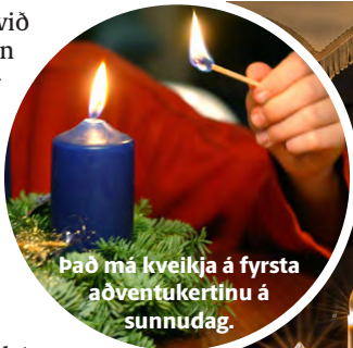
Það má kveikja á fyrsta aðventukertinu á sunnudag.

Að öllum líkindum eru margir að fara á jólahlaðborð eða í annars konar jólaveislu um helgina. Þá munu jólalögin hljóma á útvarpsstöðvunum.