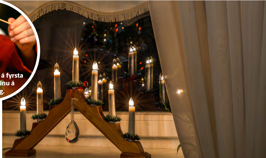
Aðventuljósir prýða glugga landsmanna frá og með sunnudeginum næsta.