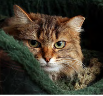
Mikilvægt er að kisu fái tækifæri til að leita skjóls á öruggum stað á meðan sprengjuresnið dynur yfir.