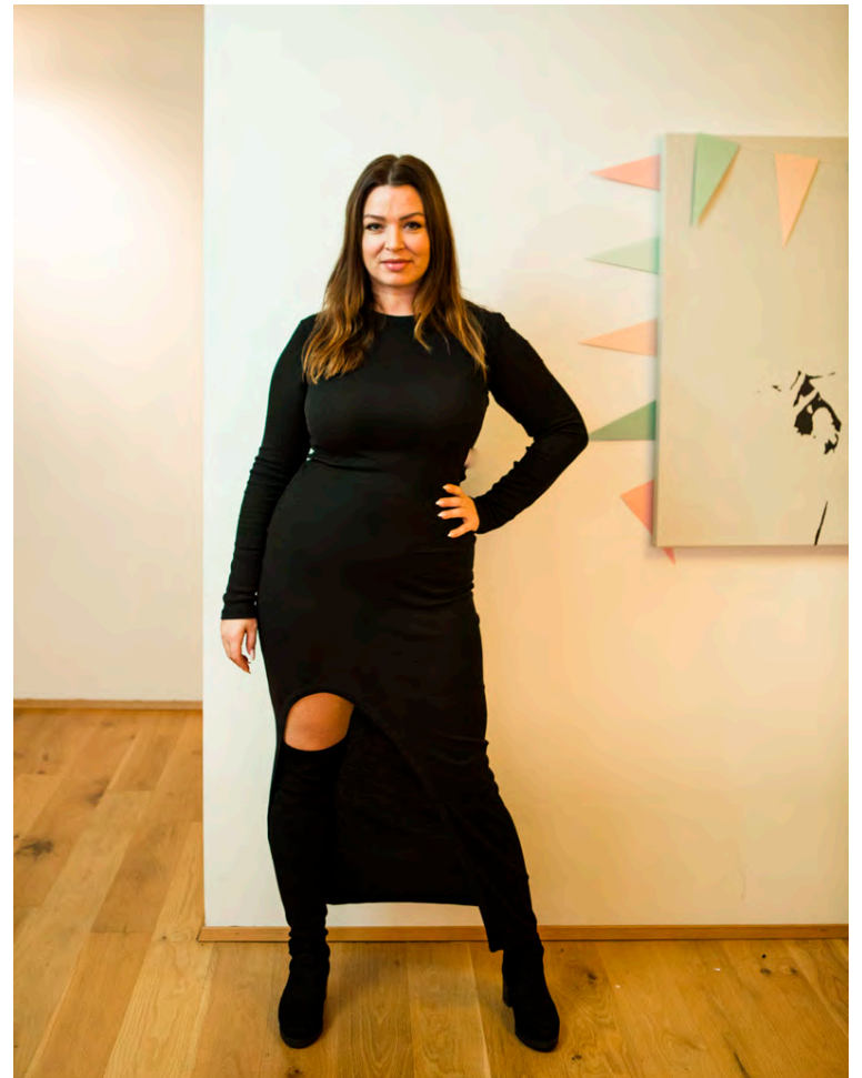
Svarti kjóllinn frá BACK er í dálæti hjá Stínu enda einstaklega þægilegur.

Tónleikarnir í Gerðubergi eru frá klukkan 12.15 til 13 í dag og á sama tíma í Borgarbókasafninu í Grófinni á morgun. Á laugardag verða þeir í Spönginni frá klukkan 13.15 til 14. Aðgangur er ókeypis og allir velkomnir.