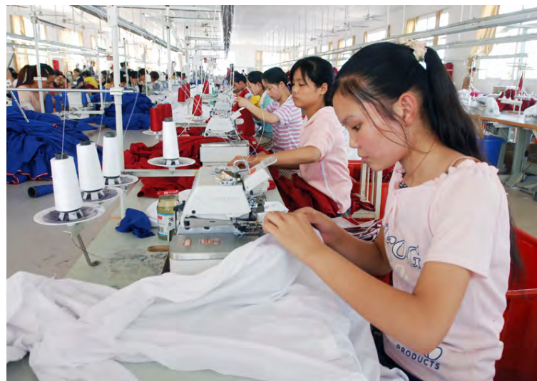
Stór hluti af fötum sem eru seld á Vesturlöndum er framleiddur í asiskum fataverksmiðjum.

Margir fylgjast vandlega með hugsanlegum áhrifum sjálfvirkra vélmenna á fataiðnaðinn. Iðnaðurinn er lífsnauðsynlegt haldreipi fyrir milljónir litíð menntaðra verkamanna í Asíu og annars staðar, þó oft sé illa farið með starfsfólk og mörg starfanna séu hættuleg.