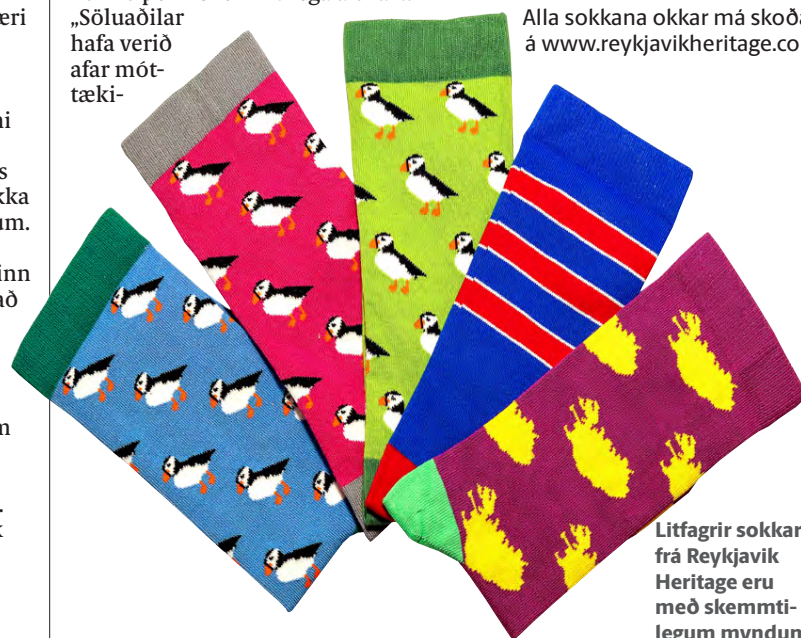
Litfagrir sokkar frá Reykjavík Heritage eru með skemmtilegum myndum.

Alla sokkana okkar má skoða á www.reykjavikheritage.com .