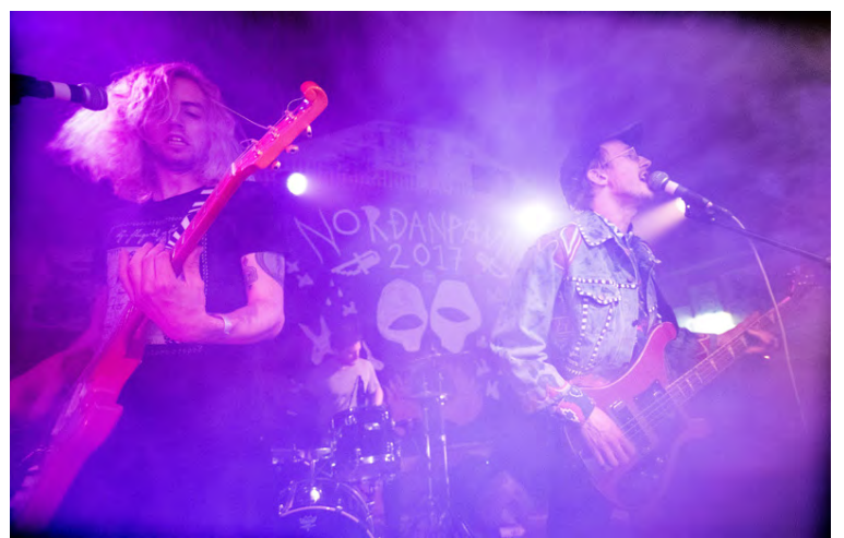
Godchilla ætlar að leggja mikið í sviðsmynd og andrúmsloft tónleikanna um næstu helgi.