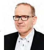
Nánari upplýsingar veitir:

Lögg. fast. / Eigandi freyja@hraunhamar.is