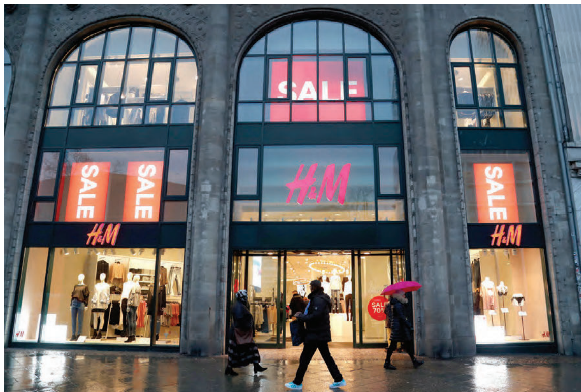
Sænski fatarisinn H&amp;M er í vanda.