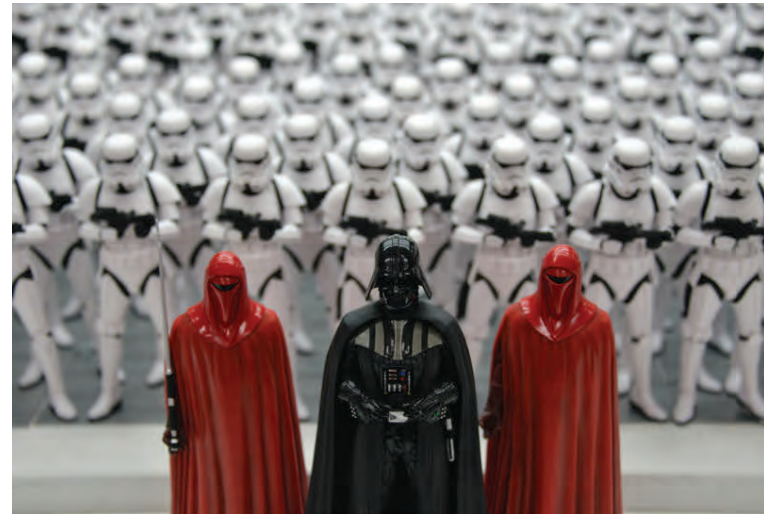
Star Wars þema verður á Bókasafni Kópavogs og söguhetjur myndanna etja kappi.

Á laugardeginum 3. febrúar hefst Sundlauganótt og mun ljósadýrðin