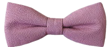
Fallegar og litríkar slaufur gera mikið fyrir heildarútlit og henta öllum aldurshópum.

dömunar líka. „Ég ákvað því að útbúa spöng og teygju í hárið með sömu slaufu og faðirinn er með. Eftirspurnin var til staðar þannig að ég ákvað að slá til og er ég virkilega ánægð með útkomuna.“