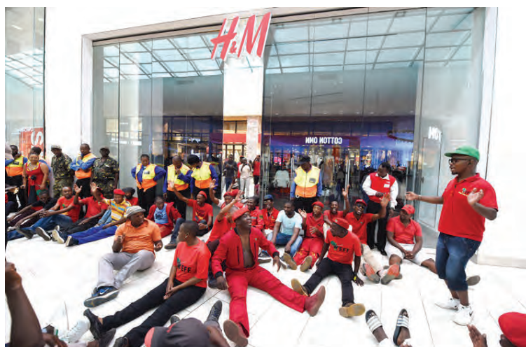
Það var mótmælt fyrir utan verslun H&amp;M í Suður-Afríku fyrr í þessum mánuði.

» Fataverslun á netinu hefur aukist verulega og fyrir vikið heimsækja færri búðir H&M.