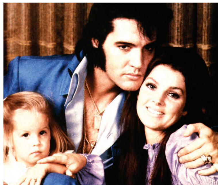
Lisa Marie er einkabarn rokkkóngsins Elvis Presley en missti föður sinn níu ára. Hér er hún á þriðja árinu með Elvis og móður sinni, Priscillu Presley.

Lisa Marie var um tíma meðlimur í Vísindakirkjunni en sagði sig úr henni árið 2016. Hún vinnur ótúllega að góðgerðarmálum.