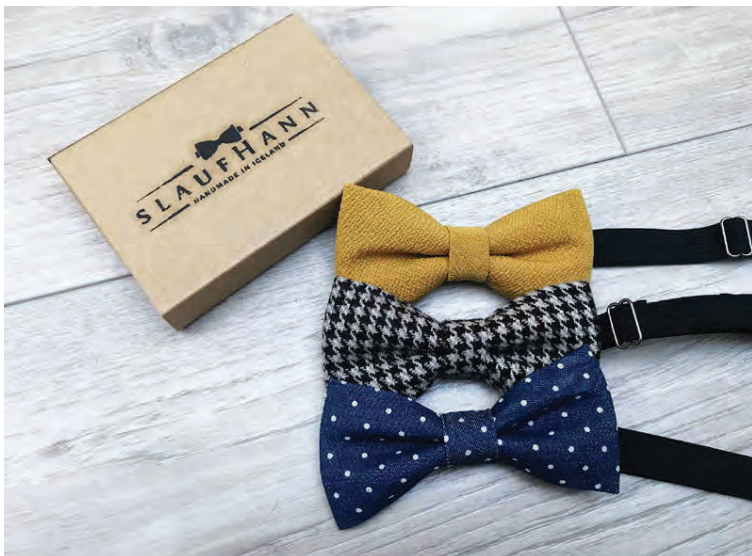
Slaufurnar fást víða, meðal annars á Facebook og á söluvef Já.is.