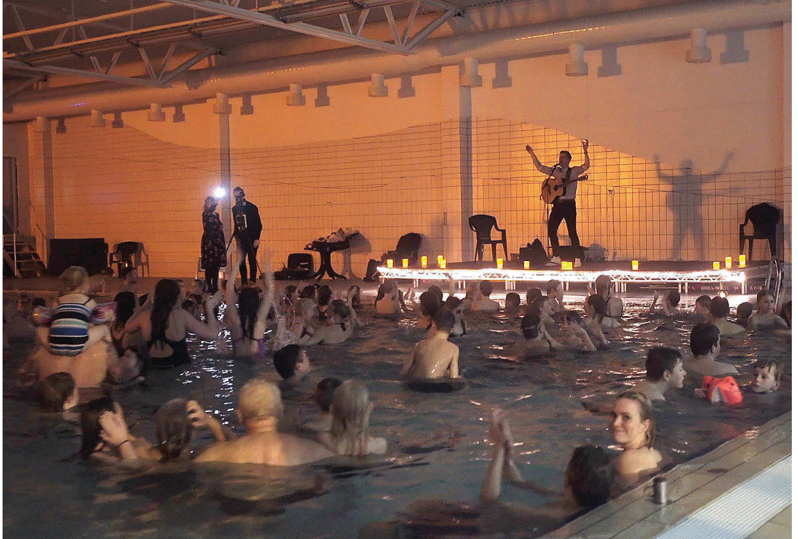
Mikil stemming hefur löngum myndast á Sundlauganótt í Kópavogi eins og sjá má á þessari mynd frá í fyrra.

Í Salnum verður Sigtryggur Baldursson í aðalhlutverki. Sigtryggur mun fara yfir sinn langa og