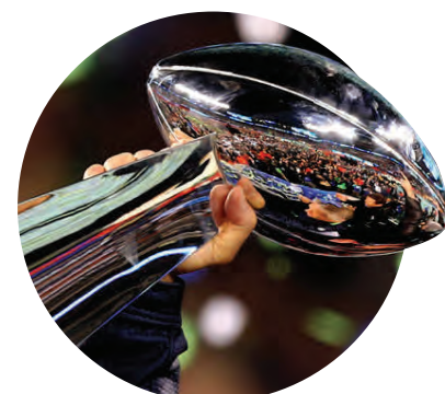
Margir ætla að fylgjast með Super Bowl leiknum milli New England Patriots og Philadelphia Eagles um helgina.

Við erum heilluð af afburðahæfni, hvort sem það er í íþróttum, listum