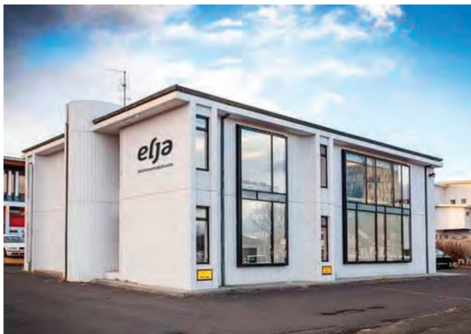
Elja starfsmannaþjónusta er til húsa í rúm-góðu húsnæði að Hátúni 2B í Reykjavík.