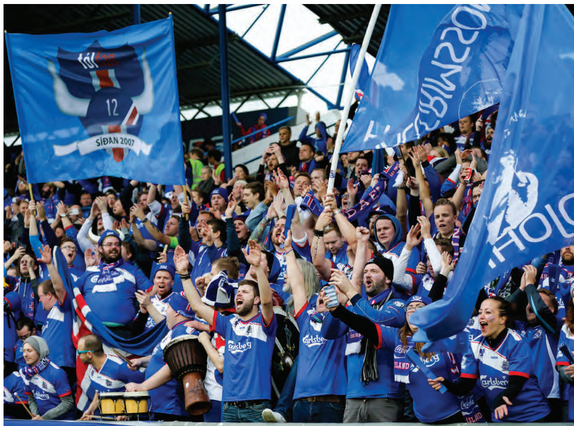
Íslenskir fótvoltaáhugamenn styðja landsliðið af krafti.

Keppnisíþróttir endurspeglar átök og þess vegna eru vinsælar íþróttir yfirleitt frekar átakamiklar. Íþróttir