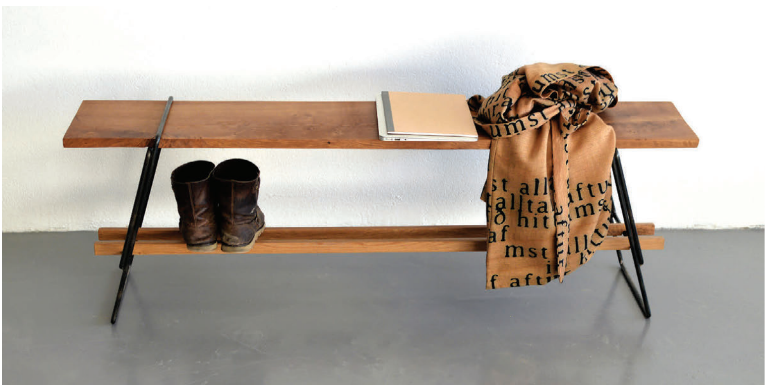
Nýi trébekkurinn er úr gegnheilum við með svörtum stálfótum. Hann er hægt að nota víða innan veggja heimilisins.

Fyrir utan nýjar vörur hyggjast þau einnig kynna nýja hugmynd