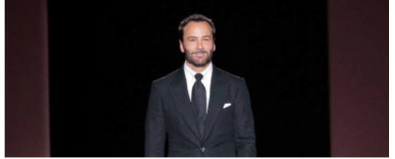
Tom Ford ætlar að nota gervifeldi í hönnun sína hér eftir.

staðinn fyrir dýraloðfeldi ætlar Tom Ford að nota gervifeldi í sína hönnun. Tom Ford hefur verið gagnrýndur af dýraværdunarsamtökum á borð við PETA fyrir að nota feldi af dýrum í fatahönnun sína og fyrir nokkru skvetti kona úr samtökunum tómatrafa yfir hann í mótmælaskyni. Hann viðurkennir að það hafi haft áhrif á þessa ákvörðun en þessi stefna er að verða æ meira áberandi innan tiskuiðnaðarins.