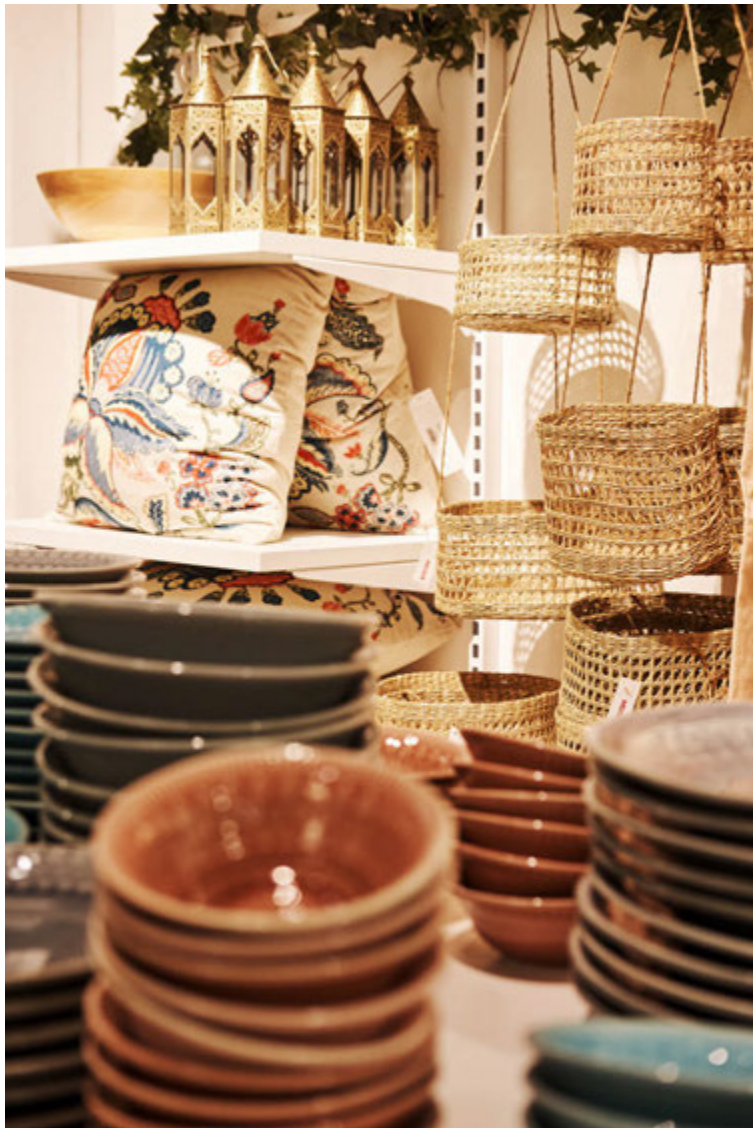
Körfur, púðar, luktir og litrík matarstell eru meðal þess sem fæst í Indiska.