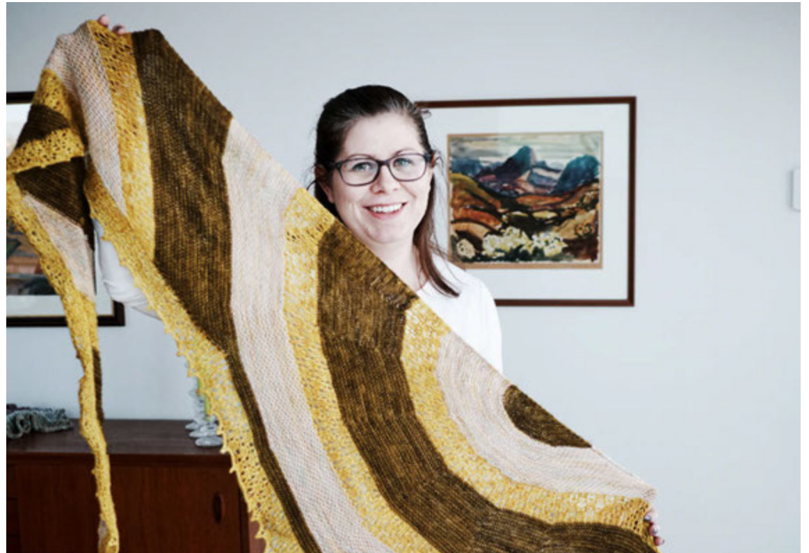
Hale-Bopp sjalið sem Eva þrjónaði „leyniprjóni“ sem höfundurinn, Ambah O'Brien, stóð fyrir.