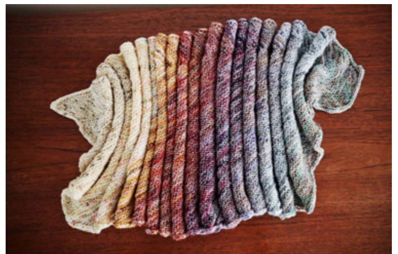
Sjalið Speckled face eftir Stephen West sem Eva þrjónaði í janúar sl.

Félagar í hópnum Svöl sjöl eru nú á sjöunda þúsundið og fer sífellt