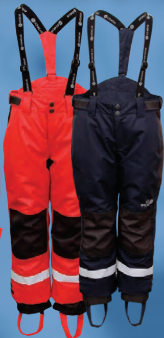
Keilir snjóboxur Verð 6.742.- Áður 8.990.-