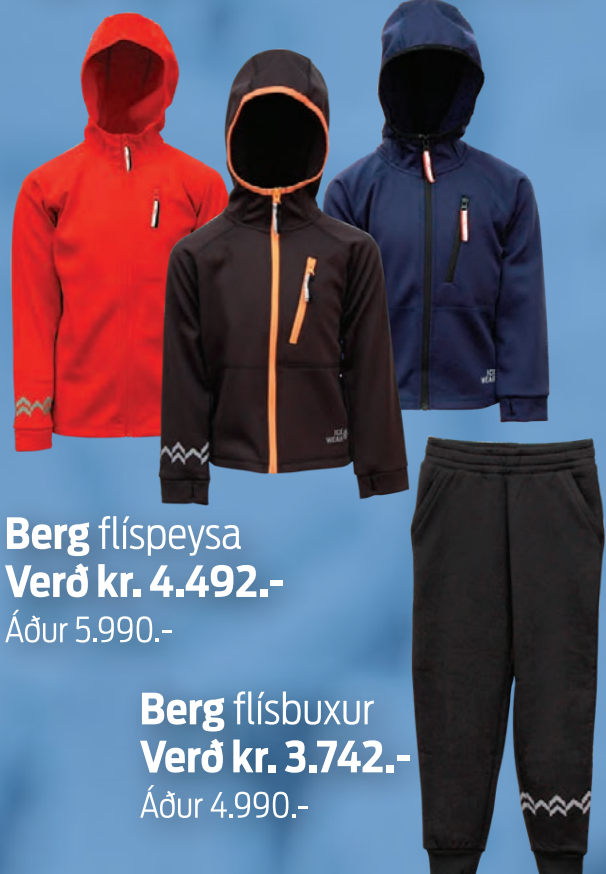
Berg flíspeysa Verð kr. 4.492.- Áður 5.990.-