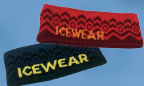
Brekka eyrnaband Verð 1.042.- Áður 1.390.-