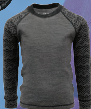
Straumnes undirbolur Verð kr. 3.367.- Áður 4.490.-