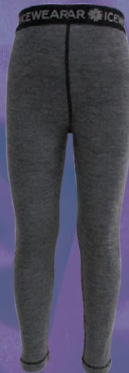
Straumnes undirbuxur Verð 2.992.- Áður 3.990.-