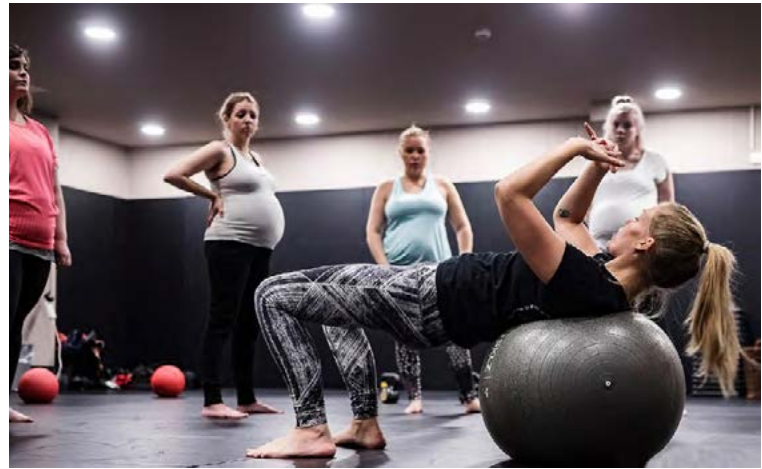
Á fullu að kenna óléttum konum leikfimi.