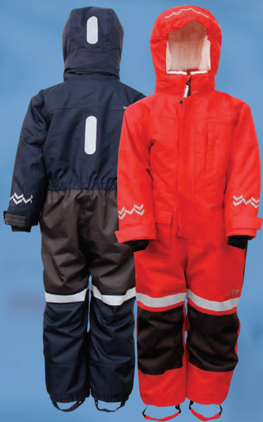
Keilir snjógalli. Verð 11.243.- Áður 14.990.-