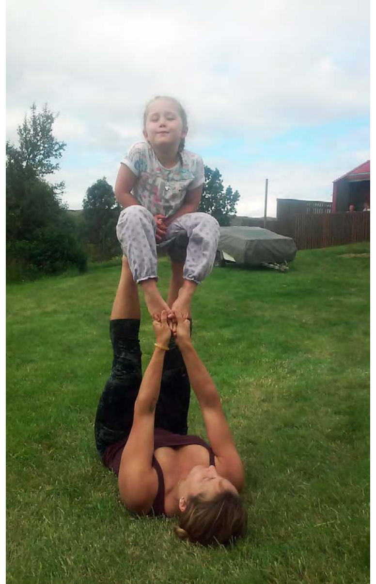
Ingibjörg segir hægt að stunda akró hvar sem er, til dæmis úti í garði.

Hægt er að fá nánari upplýsingar á Facebook-síðunni Akró Ísland – Acro Iceland.