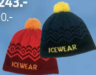
Brekka húfa Verð 1.267.- Áður 1.690.-