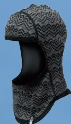
Straumnes lambhúshetta Verð 1.492.- Áður 1.990.-