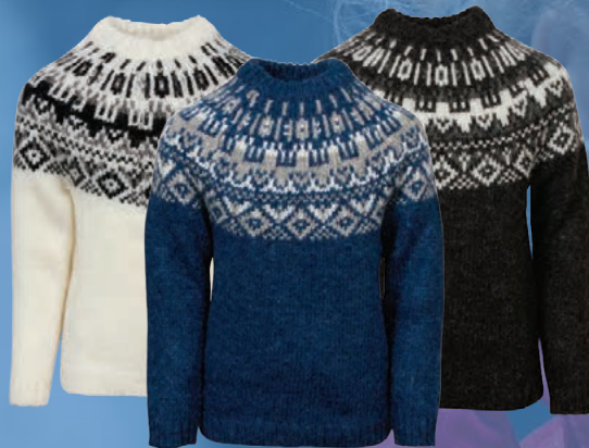
Elmar lopapeysa. Verð 6.742.- Áður 9.990.-