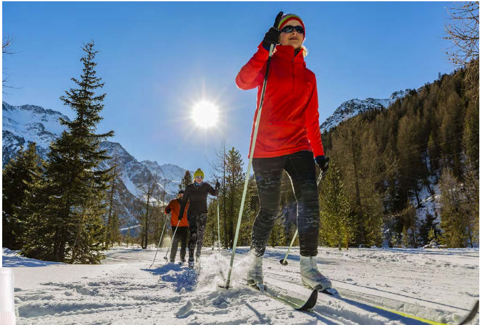
Magnesium Recovery er staðalbúnaður fyrir og eftir hreyfingu og hentar bæði íþróttafólki sem þeim sem stunda mikla hreyfingu.