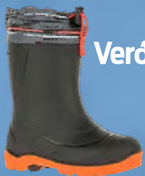
Kamik Snobuster Barnaskór Verð kr. 10.493.- Áður 13.990.-