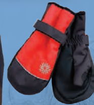
Keilir lúffur Verð 2.092.- Áður 2.790.-