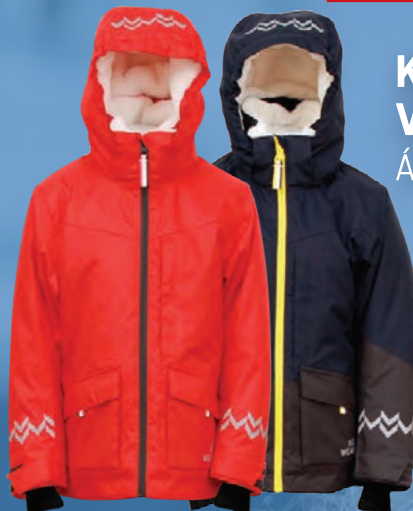
Keilir vetrarúlpa Verð 8.992.- Áður 11.990.-