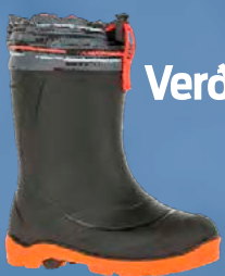
Kamik Snobuster barnastigvél Verð kr. 10.493.- Áður 13.990.-