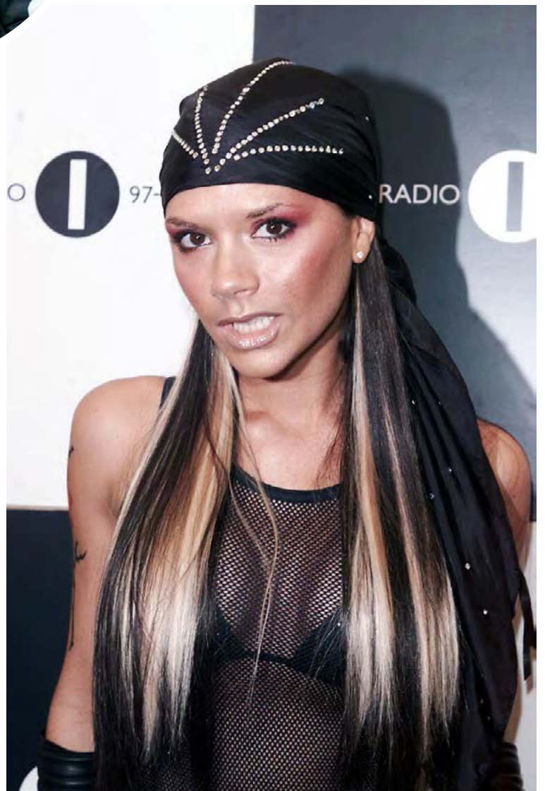
Victoria Beckham hefur alltaf verið tiskutákn, af augljósum ástæðum.