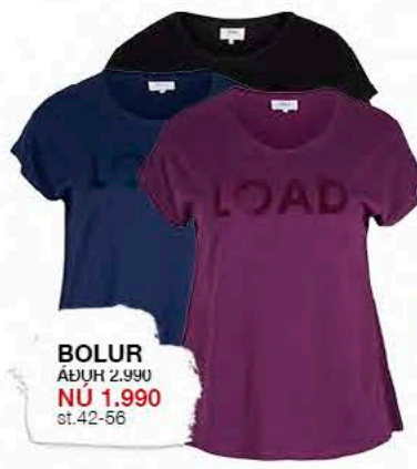
BOLUR ÁÐUR 2.990 NÚ 1.990 st.42-56