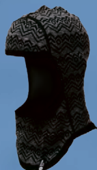
Straumnes lambhúshetta Verð kr. 1.492.- Áður 1.990.-