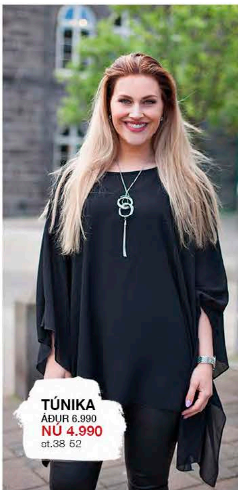
TÚNIKA ÁÐUR 6.990 NÚ 4.990 st.38-52