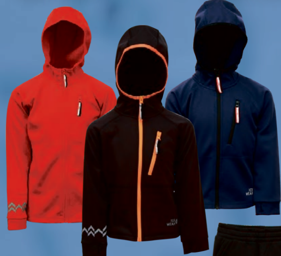
Berg flíspeysa Verð kr. 4.492.- Áður 5.990.-