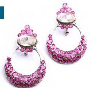
Gullfalegir eyrnalokkar gleðja allar konur, eins og flestallt skart.

Unaðsleg og þokkafull angan hittir alltaf í mark.