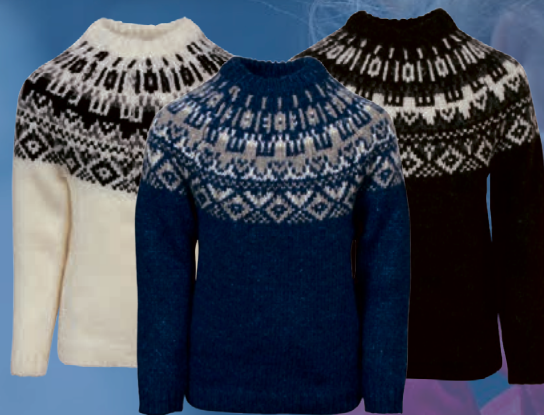
Elmar lopapeysa. Verð kr. 6.742.- Áður 9.990.-