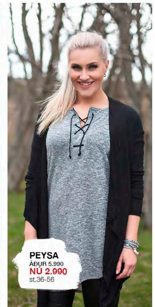
PEYSA ÁÐUR 5.990 NÚ 2.990 st.36-56