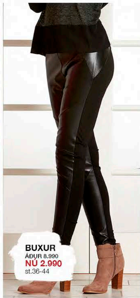
BUXUR ÁÐUR 8.990 NÚ 2.990 st.36-44