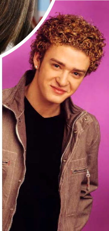
Justin Timberlake átti vandræðalegt tímabil á yngri árum.

David Beckham með eftirminnilega glæsilegt hár. Takið eftir skegginu.