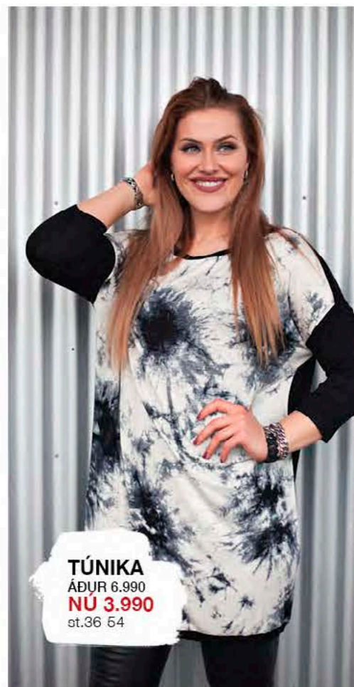
TÚNIKA ÁÐUR 6.990 NÚ 3.990 st.36-54