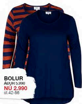
BOLUR ÁÐUR 5.990 NÚ 2.990 st.42-56