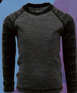
Straumnes undirbolur Verð kr. 3.367.- Áður 4.490.-