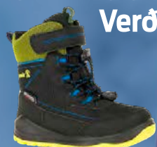
Kamik Indiana barnaskór Verð kr. 9.743.- Áður 12.990.-