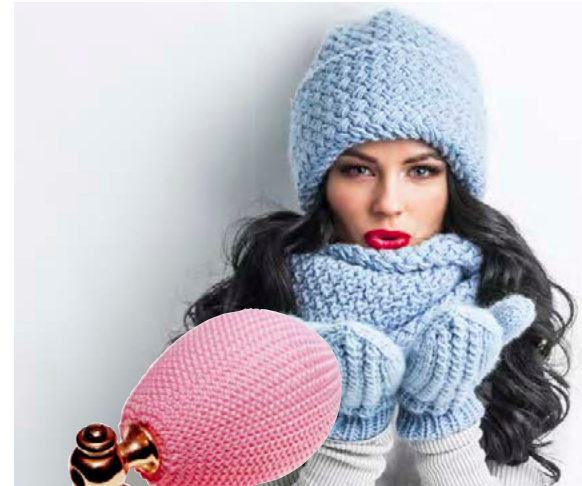
Vettlingar, húfa og trefill eru hugulsöm gjöf í vetrarkuldanum.

Unaðsleg og þokkafull angan hittir alltaf í mark.