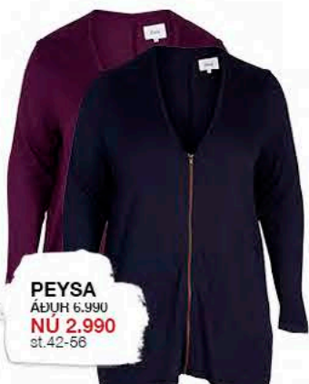
PEYSA ÁÐUR 6.990 NÚ 2.990 st.42-56