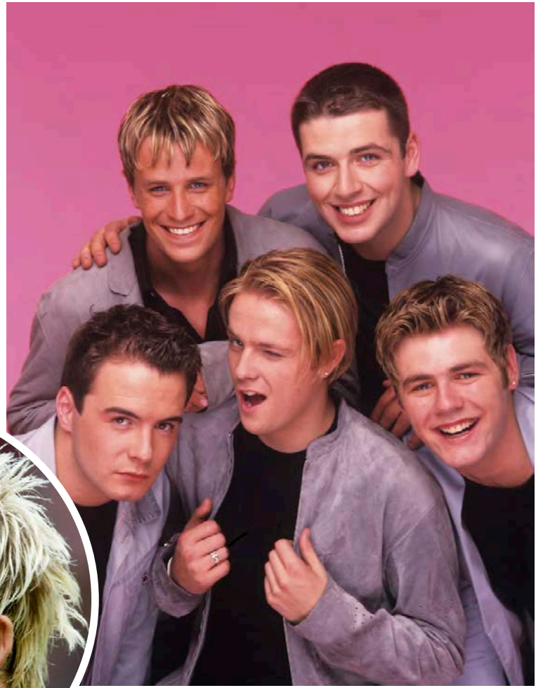
Strákarnir í Westlife töldust glæsilegir á sínum tíma.