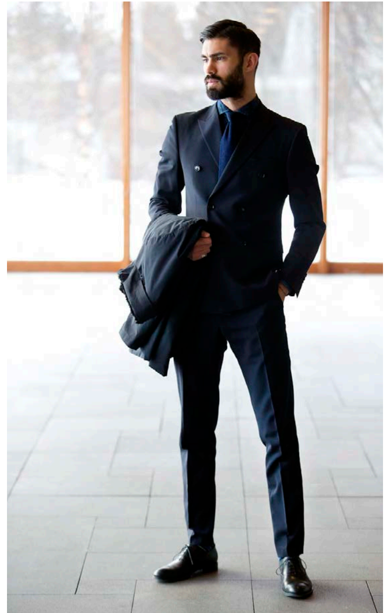
Dökku jakkafötin eru frá Sand. Skyrtan, bindið og skórnir eru frá Boss en frakkinn er frá Armani.

Eyðir þú miklu í fót miðað við jafnaldrá þína? Já, það myndi ég