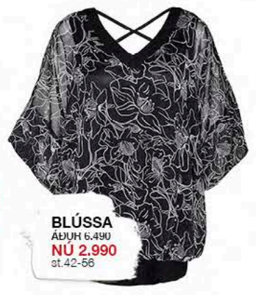
BLÚSSA ÁÐUR 6.490 NÚ 2.990 st.42-56