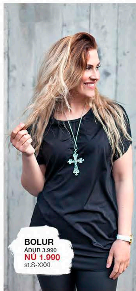
BOLUR ÁÐUR 3.990 NÚ 1.990 st.S-XXXL