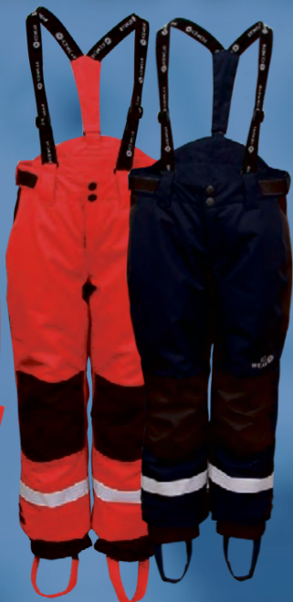
Keilir snjóboxur Verð kr. 6.742.- Áður 8.990.-