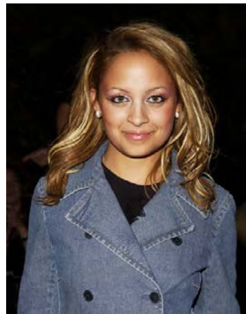
Raunveruleikasjónvarpsstjarnan Nicole Richie með óraunverulegt hár.