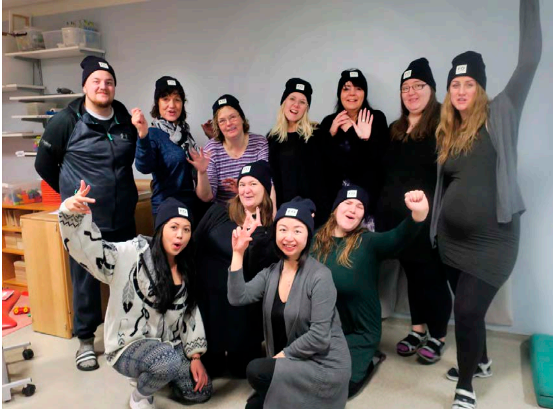
Starfsfólk leikskólans Vinaminni í Asparfelli með FO-húfurnar en með því að kaupa þær styrkja þau gott málefni.