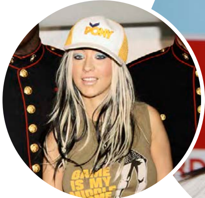
Christina Aguilera var alltaf ófeimin, þar á meðal við strípurnar.

Idol-stjarnan Kelly Clarkson rokkaði strípurnar, mjöu augabrúnirnar og þröngu hálsfestina.