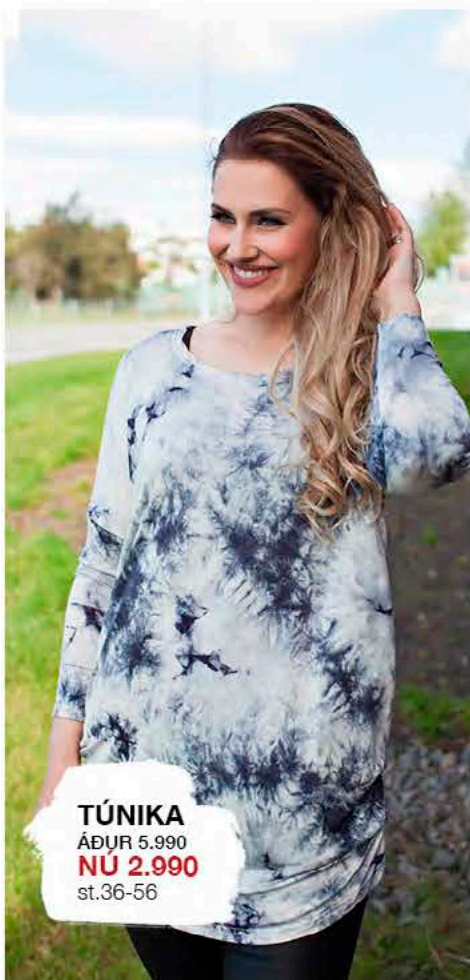
TÚNIKA ÁÐUR 5.990 NÚ 2.990 st.36-56

af völdum vörum dagana 15-18. febrúar í Kringlunni og á Glerártorgi