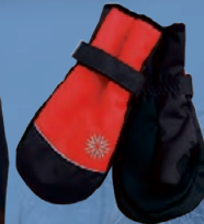
Keilir lúffur Verð kr. 2.092.- Áður 2.790.-