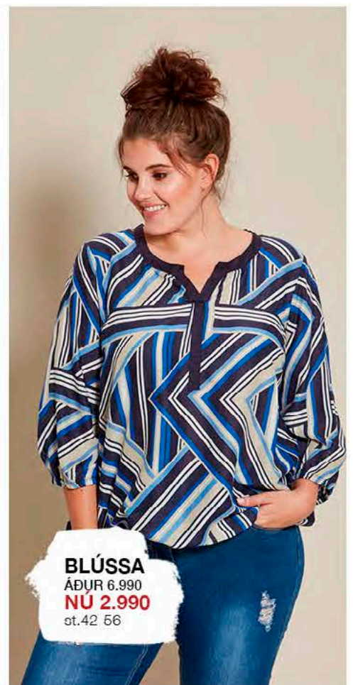
BLÚSSA ÁÐUR 6.990 NÚ 2.990 st.42-56