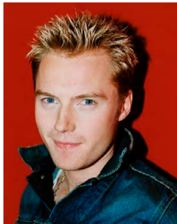
Ronan Keating bræddi mörg hjörtu með þessum bláu augum og ljósu strípum.