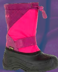
Kamik Snowtrax barnastigvél Verð kr. 7.117.- / 5.993 Áður 9.490.- / 7.990