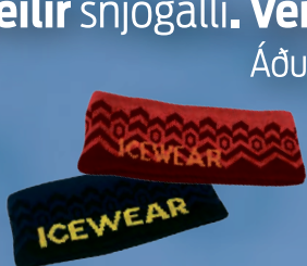
Brekka eyrnaband Verð kr. 1.042.- Áður 1.390.-