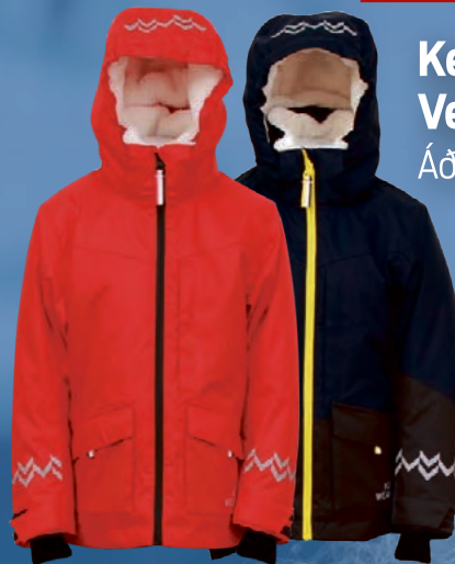
Keilir vetrarúlpa Verð kr. 8.992.- Áður 11.990.-