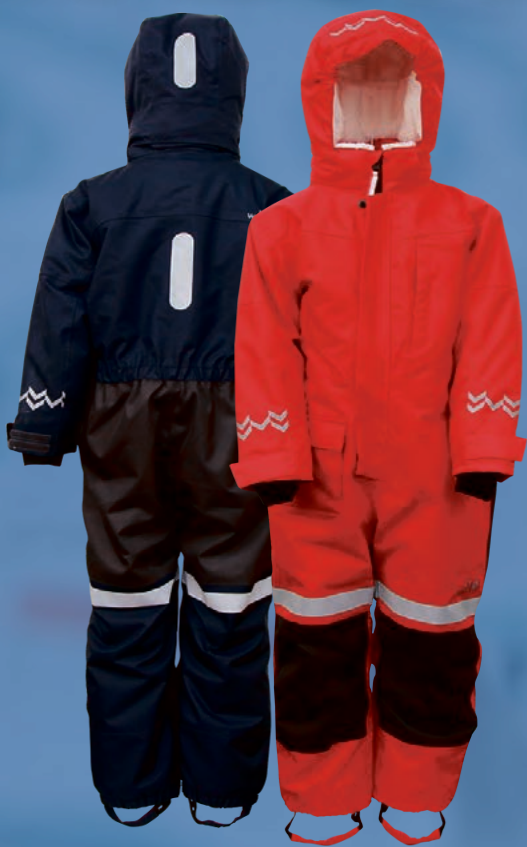
Keilir snjógalli. Verð kr. 11.243.- Áður 14.990.-