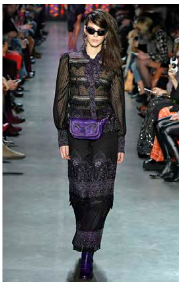
Mittistöskur eru vinsælar í dag.

Reyndar var kominn einhver brestur í sambandið fyrir jólin en fréttir sögðu frá því að Justin hefði stormað frá heimili þeirra hjóna fyrr í haust og bókað sig inn á lúxushótel. Viku fyrir afmæli Jennifer sáu hjónin saman í Mexíkó og töldu þá margir að þau væru að reyna að lappa upp á hjónabandið. Þau reyndust þó ekki tvö því nokkrir vinir þeirra voru með í för. Ískalt andrúmsloft virtist á milli þeirra. Jennifer og Justin gengu í hjónaband í ágúst 2015.