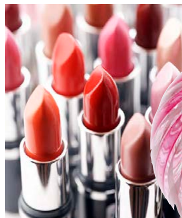
Varalitur er rómantísk gjöf sem líka kemur að góðum notum.

Margir gefa blóm og konfekt, sem eru sígildar og sannar konudagsgjafir, en kvenlegar, persónulegar gjafir eru víðeigandi á konudaginn og hitta konuna í hjartastað ef valið er af gaumgæfni. Aðlaðandi er konan ánægð og því er alltaf í móð að gefa konu fallega flik, sko eða fylgihluti, og eins dýrindis ilm eða skart. Mestu skiptir þó að gefa sjálfan sig í konudagsgjöf; tíma, gleði, ást og athygli, og tala frá hjartanu til að virða tímans þunga nið. Þannig upplifir konan sig dýrmæta, mikilvæga og elskaða.