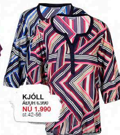
KJÓLL ÁÐUR 6.990 NÚ 1.990 st.42-56