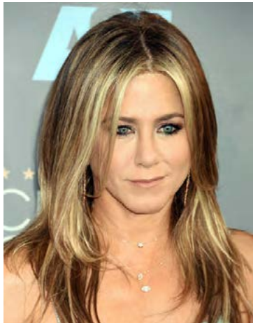
Jennifer virðist ekki vera heppinn í ástarmálum.