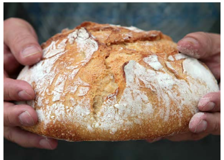
Ekkert er betra en nýbakað brauð.

Hrærið allt sem á að fara í brauðið. Deigið á að vera svolítið blautt. Setjið í skál og breiðið plastfilmu yfir. Látið standa í tólf tíma. Hitið ofninn á 250°C. Setjið pottinn í ofninn og hitið hann upp í sama hita. Á meðan er deigið tekið úr skálinni og hnoðað smástund á hveitistráðu borði. Takið pottinn út en gætið að því að hann er mjög heitur. Setjið rúgmjöl í botninn og síðan deigið. Lok er haft á pottinum þegar