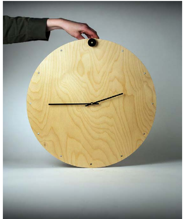
Tíminn var þema í verkefni sem tengdist Litla-Hrauni.