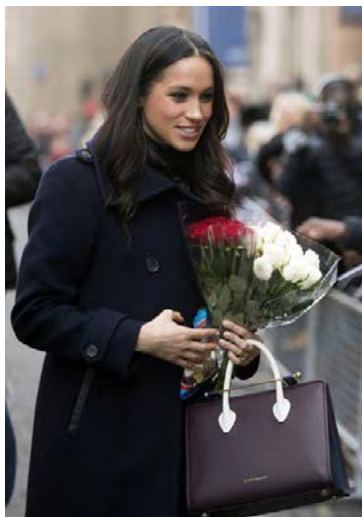
Handtaskan stal senunni í heimsókn Megan og Harrys til Nottingham og hefur nú selst í bilförmum.