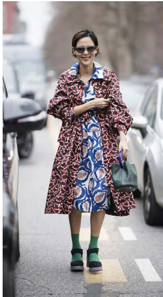
Upplifandi litir og mynstur sem tekið er eftir á götum stórborgarinnar.