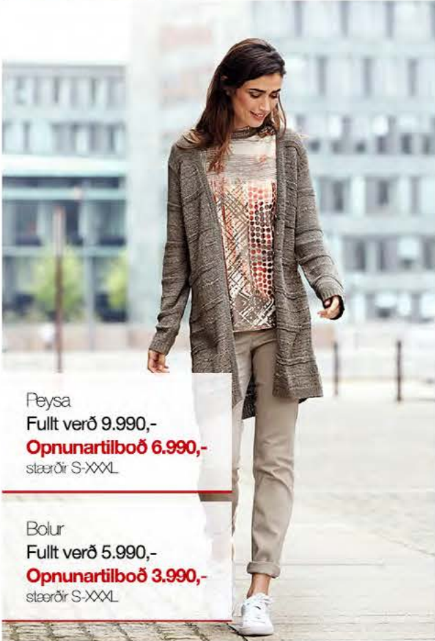
Peysa Fullt verð 9.990,- Opnunartilboð 6.990,- stærðir S-XXXL