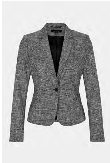
Jakki var á 22.990, fer í 16.990 krónur.