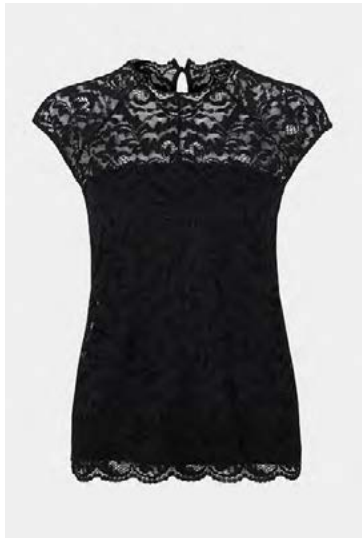
Toppur, var á 11.490 fer í 8.990 krónur.

Glæsileg vor- og sumarföt eru að koma í verslunina Comma í Smáralind.