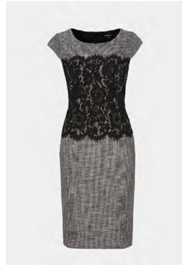
Kjöll var á 22.990, fer í 16.990 krónur.