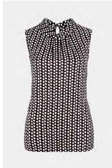
Toppur, var á 8.490, fer í 5.990 krónur.