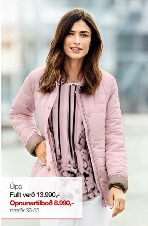
Úlpa Fullt verð 13.990,- Opnunartilboð 8.990,- stærðir 36-52