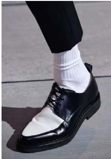
Hvítu sokkarnir – því meira áberandi, því betra.