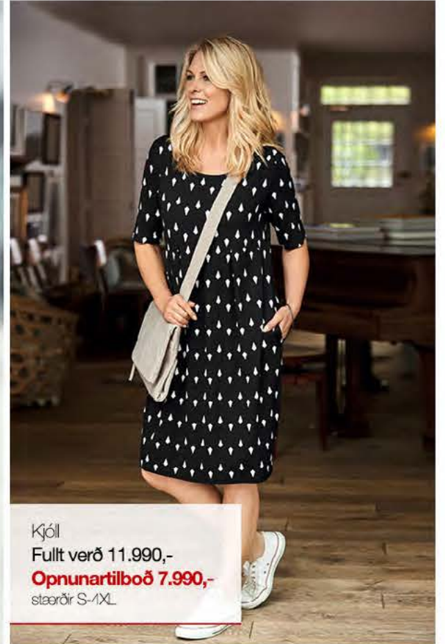
Kjól Fullt verð 11.990,- Opnunartilboð 7.990,- stærðir S-1XL