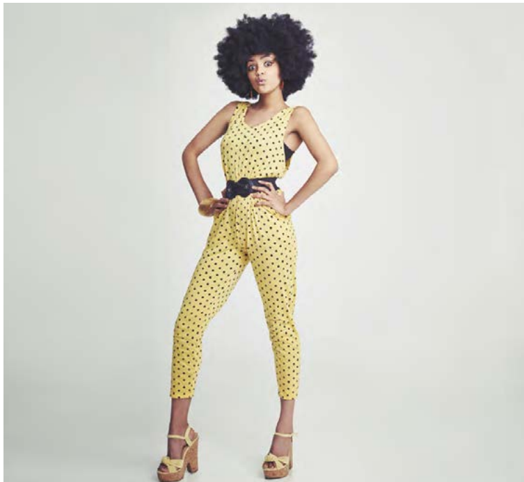
Á þessari mynd er vélinni beint upp á fyrirsætuna sem horfir beint í myndavélina. Moss telur að myndir sem sýna sterkar konur séu að verða algengari.