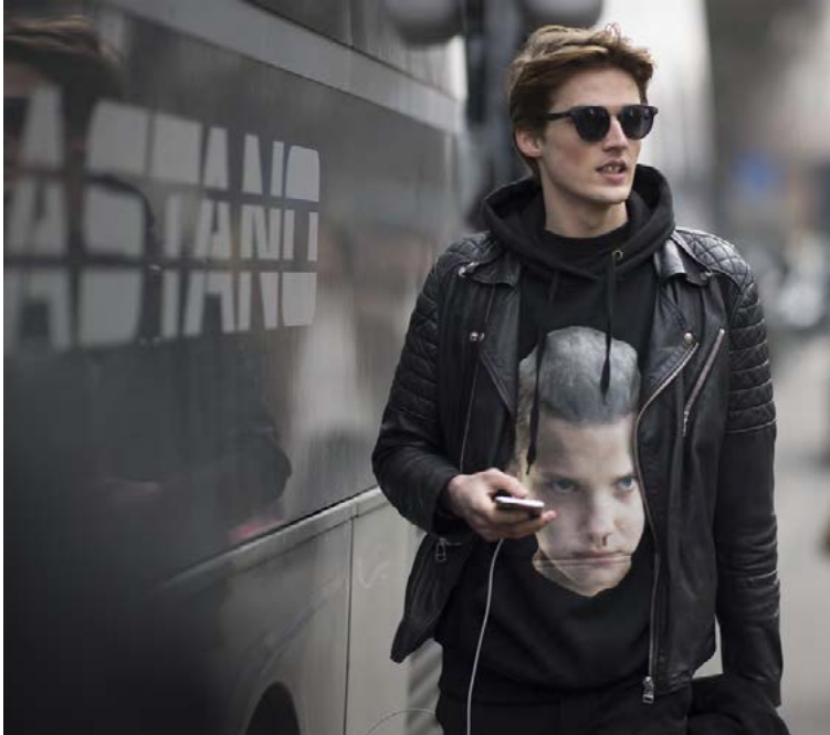
Myndir af Millie Bobby Brown sem leikur Eleven í Stranger Things eru komnar á boli. Kannski ekki skritið þar sem stúlkan er á hraðri leið upp á stjörnuhimininn.