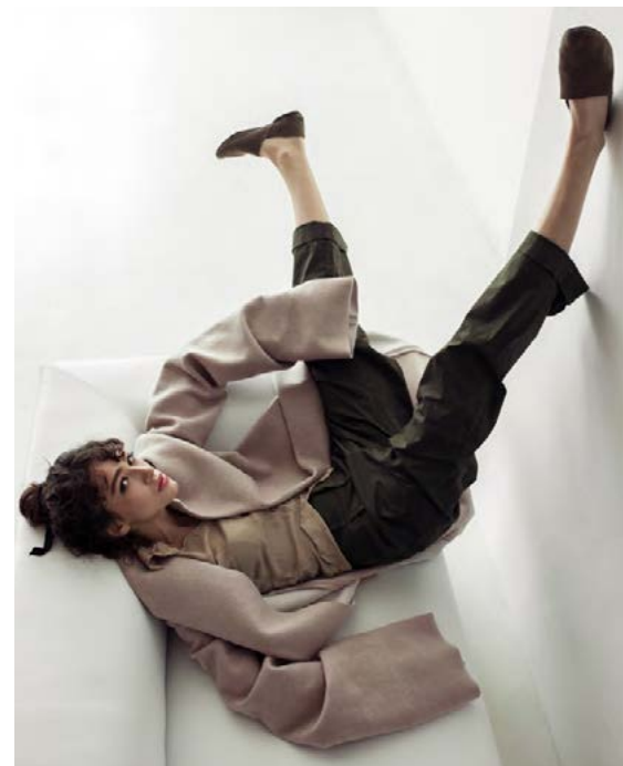
Hér er virðist fyrirsætan varnarlaus og í liggur á bakinu með fótleggina í sundur.