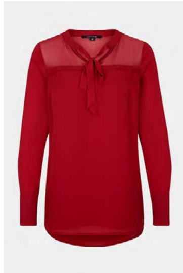
Blússa sem var á 9.990 fer í 6.990 krónur.