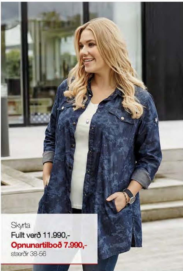
Skyrta Fullt verð 11.990,- Opnunartilboð 7.990,- stærðir 38-56