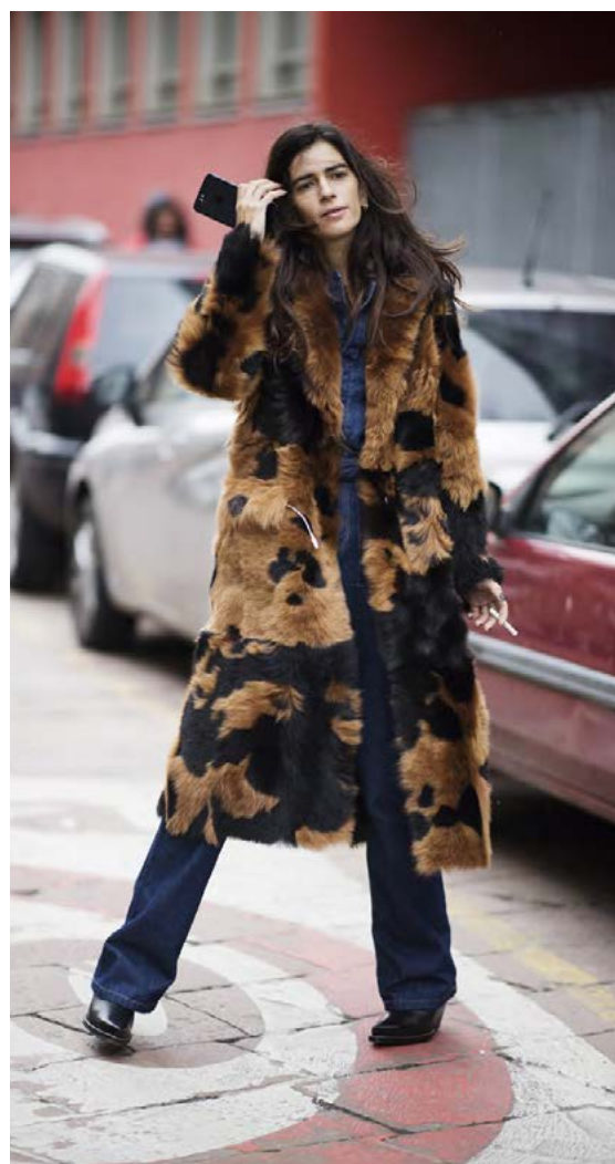
Götutískan er alls konar. Líka ekta pelsar sem þó eru smám saman að vika fyrir gervipelsum.