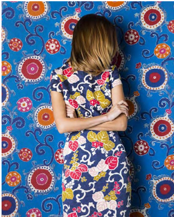
Hér er einstaklingurinn aukaatriði og andlit fyrirsætunnar sést ekki.