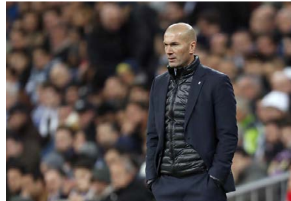
Zinedine Zidane, þjálfari Real Madrid, er alltaf flott klæddur.

Annars er fólki sem þarf að þola Síberíukuldann bent á að leggja öllum fatnaði úr pólýester en klæðast ull og skinni í staðinn til að halda að sér hita. Íslendingar hafa verið framarlega í hönnun hlýrra dúnúlpna og þær ættu að koma sér vel úti í Evrópu þessa dagana. Kuldinn verður áfram næstu daga. Þá þarf einnig að pakka símanum sínum í hlýjan hanska því hann þolir illa kuldan.