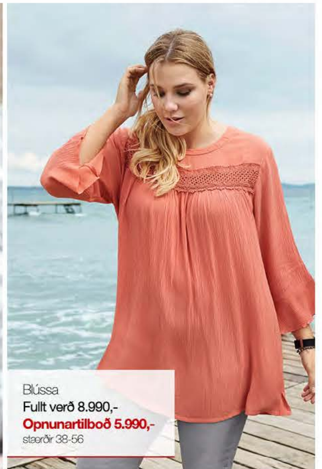
Blússa Fullt verð 8.990,- Opnunartilboð 5.990,- stærðir 38-56