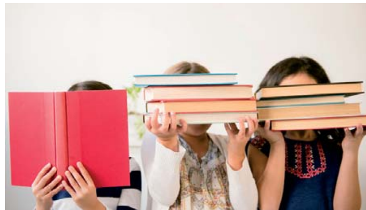
Árleg ráðstefna um barna- og unglíngabækur verður haldin í Borgarbókasafninu í Gerðubergi í dag.