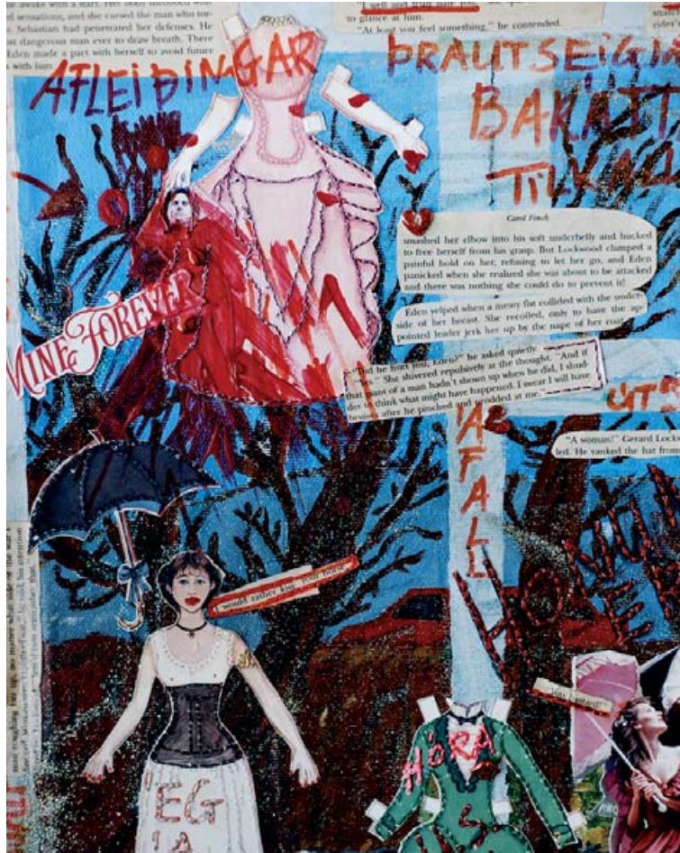
Klippimyndir teljast til hannyrðapönks og hér má sjá eitt feminískt klippiverk eftir Sigrúnu.