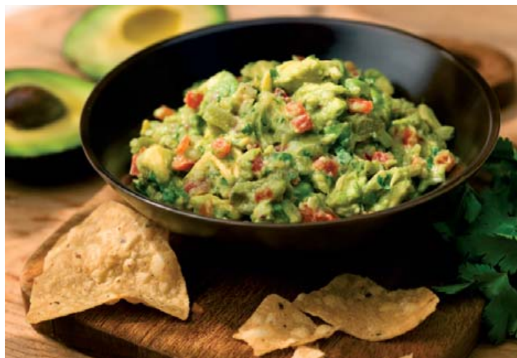
Guacamole passar með alls kyns tex-mex mat.