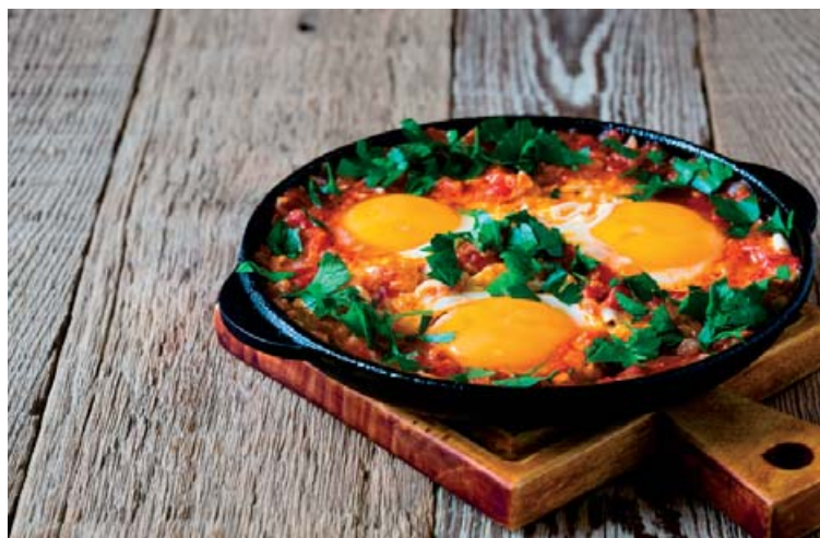
Fljótлагаður kúrekaréttur fyrir svanga sem vilja hafa lítið fyrir matnum.