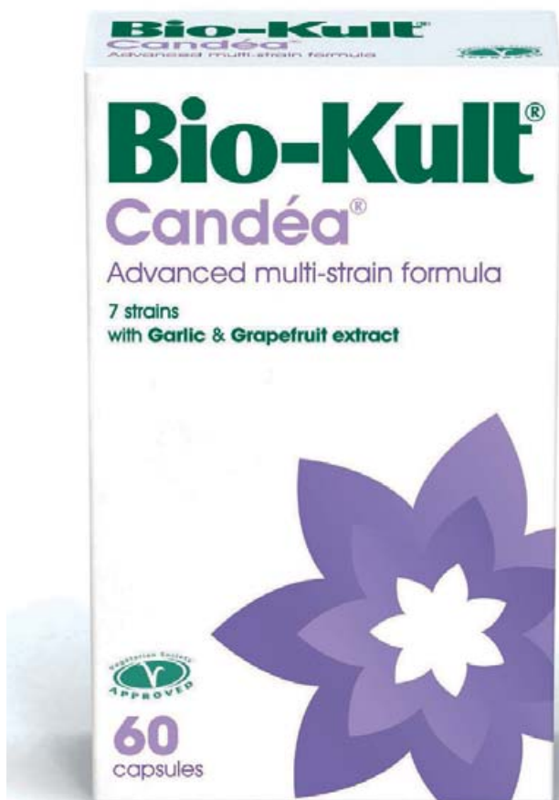
Bio-Kult Candéa hefur reynst fólki með meltingarvandamál mjög vel.