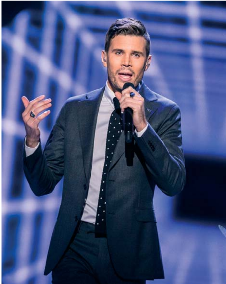
Robin Bengtsson varð í fimmta sæti í keppninni í Kiev í fyrra.