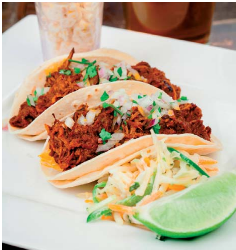
Taco er vinsæll matur hjá öllum aldri.

Steikið hakkið ásamt lauk og chili. Bætið taco-kryddinu og vatninu út í. Látið malla smástund. Setjið naslið í eldfast mót og síðan hakkið, baunirnar og salsa sósuna. Rifinn ostur fer yfir allt saman. Hitið ofninn í 225°C og bakið réttinn þar til osturinn er bráðnaður, 5-8 mínútur. Það má skipta hakkinu út fyrir kjúkling eða bara grænmeti eftir smekk.