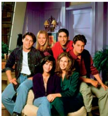
Vinirnir hafa farið hver í sína áttina.