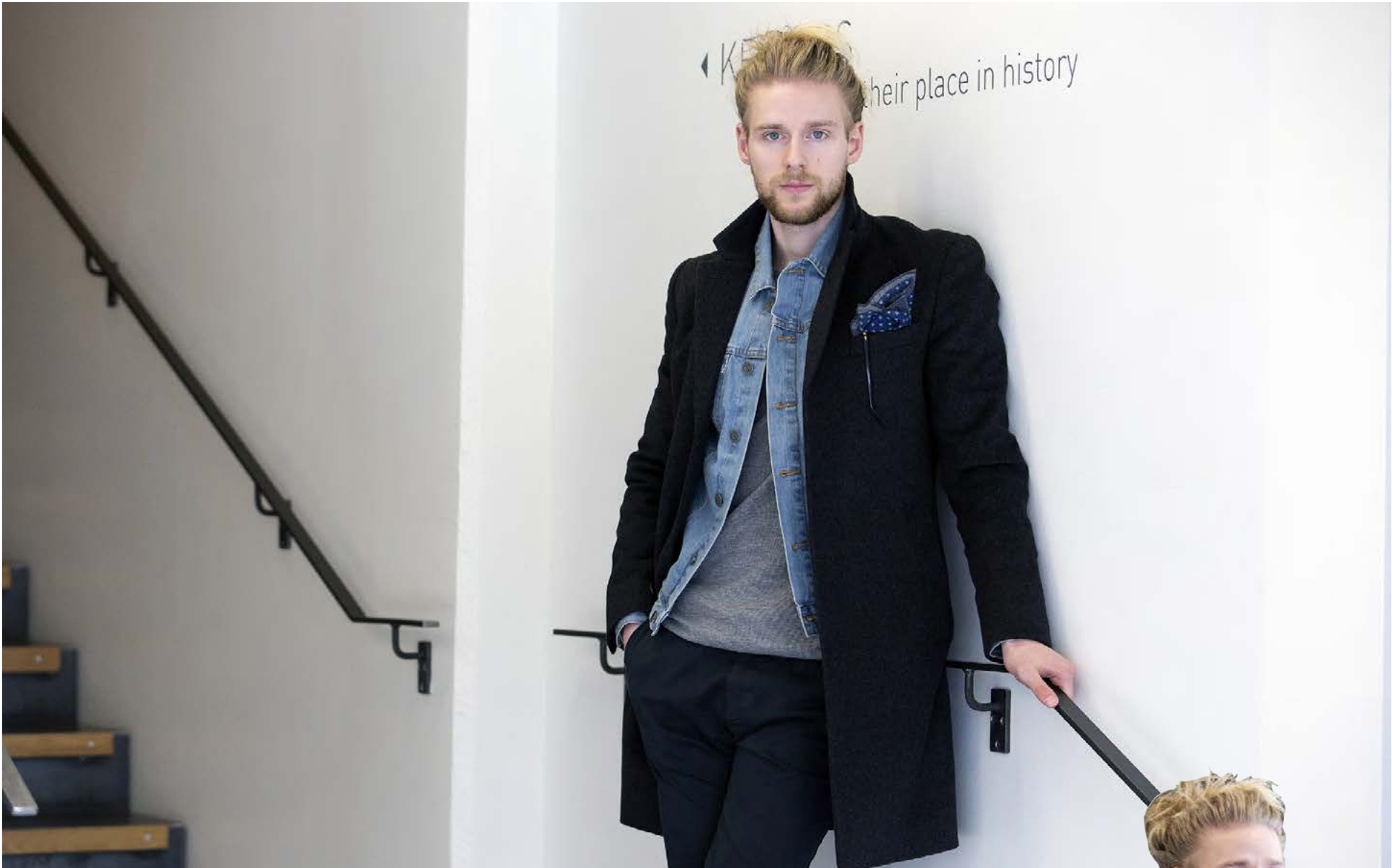
Dökkgrái frakkinn er uppáhaldsflík Bojans sem hann notar mikið við ólík tilefni. Gallajakinn er frá Calvin Klein.