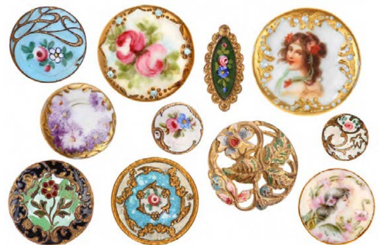
Skrauthnappar tíðkuðust mjög á fyrri öldum og voru margir mikil listaverk.

Víða um heim eru starfrækt hnappasöfn þar sem má sjá sannköluluð tölulistaverk, fallegar