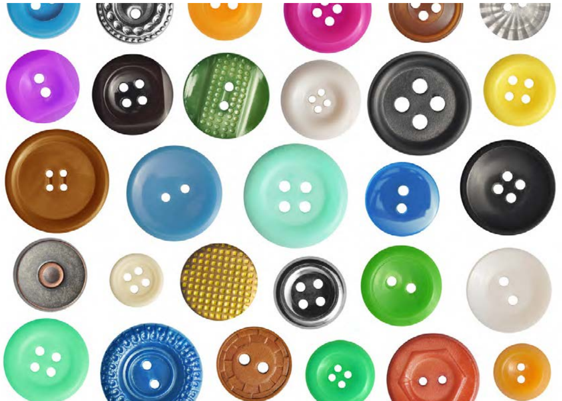
Í dag er algengast að tölur séu úr plasti en einnig finnast tölur úr málm, skel eða viði.