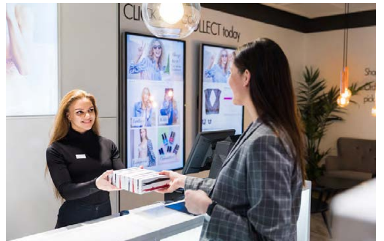
Flott og nútímalegt umhverfi hjá Lindex á Laugavegi.