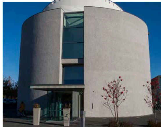
Þjóðminjasafnið við Suðurgötu.

Á 100 ára fullveldisafmæli Íslands stendur Þjóðminjasafn Íslands fyrir sérstakri dagskrá á sýningum safnsins á Suðurgötu. Valinkunnir einstaklingar, sem þekktir eru fyrir störf sín í þágu samfélagsins, veita leiðsögn og ræða við safngesti um hugðarefni sín. Dagskrána má finna á heimasíðu safnsins thjodminjasafn.is.