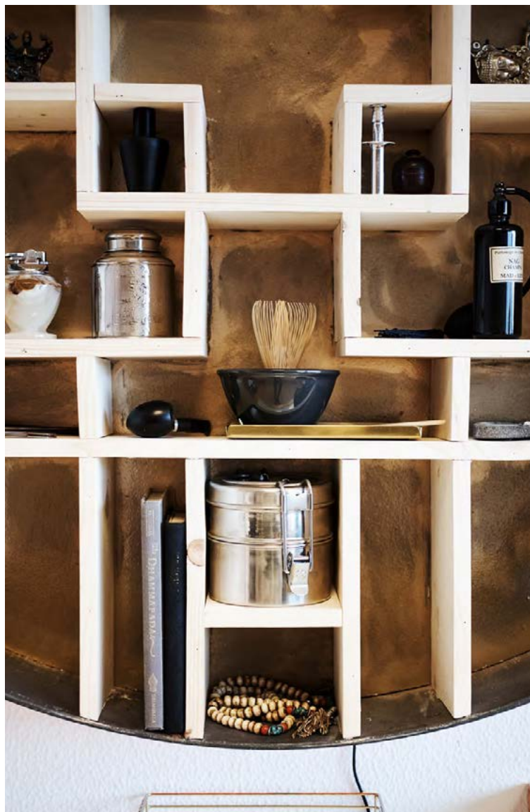
Hillan hefur vakið mikla athygli á stofunni og einnig á samfélagsmiðlum.

Þegar grunnhugmyndin var komin á blað var næsta skref að byggja ofan á hana í sameiningu. „Við hittumst nokkrum sinnum í kjölfarið og ræddum ýmsar áhugaverðar pælingar, fórum yfir praktískar aðferðir, ákváðum efni, stærðir og ljósamál og ýmislegt fleira. Þegar