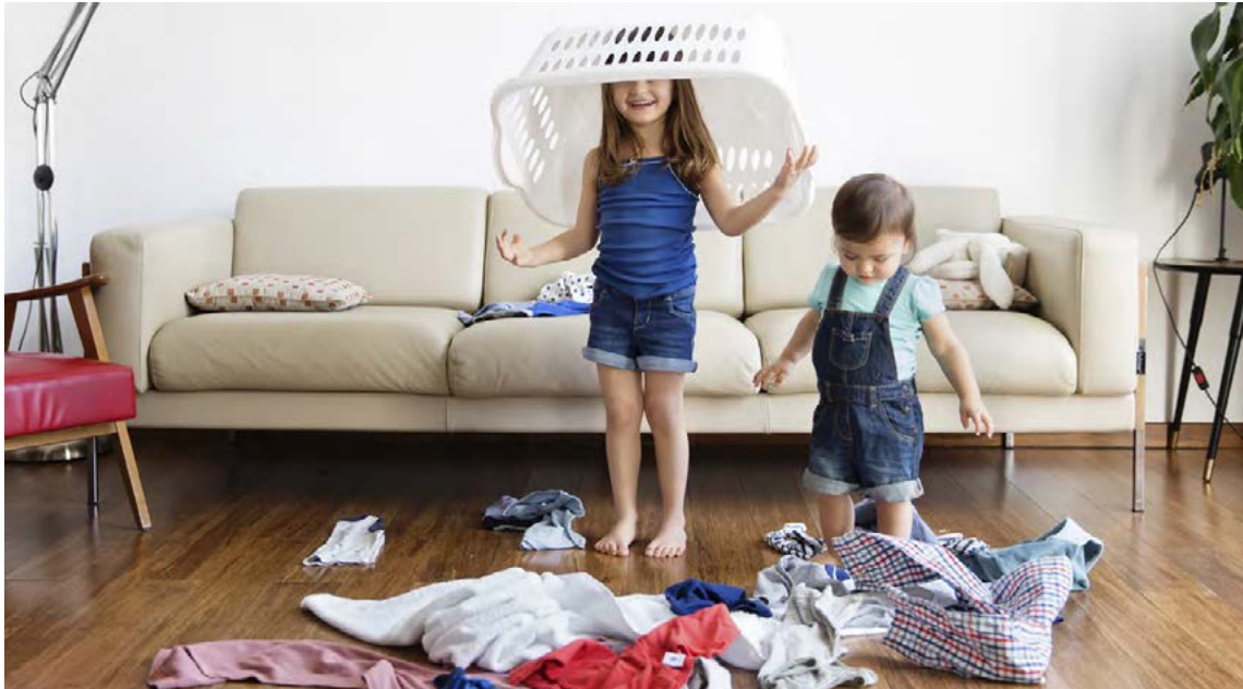
Þvottahrúgan virðist aldrei minnka en það má nota hvert handklæði oftar en einu sinni til að draga úr þvotti.

Stakir sokkar virðast hlaðast upp í þvottahúsinu. Reyndar er hægt að ganga í ósamstæðum sokkum en þeir sem ekki hafa smekk fyrir því ættu að losa sig við stöku sokkana. Ósennilegt er að hinn sokkurinn finnist nokkurn tímann. Rauði krossinn endurnýtir allan textíl svo það er engin ástæða til að fá samviskubit þótt fatnaður eða skór endi þar.