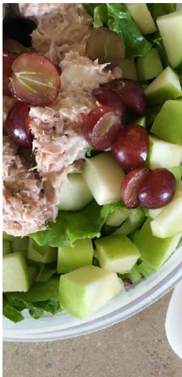
Ljúffengt túnfisksalat getur verið þægilegur millibiti um helgar.