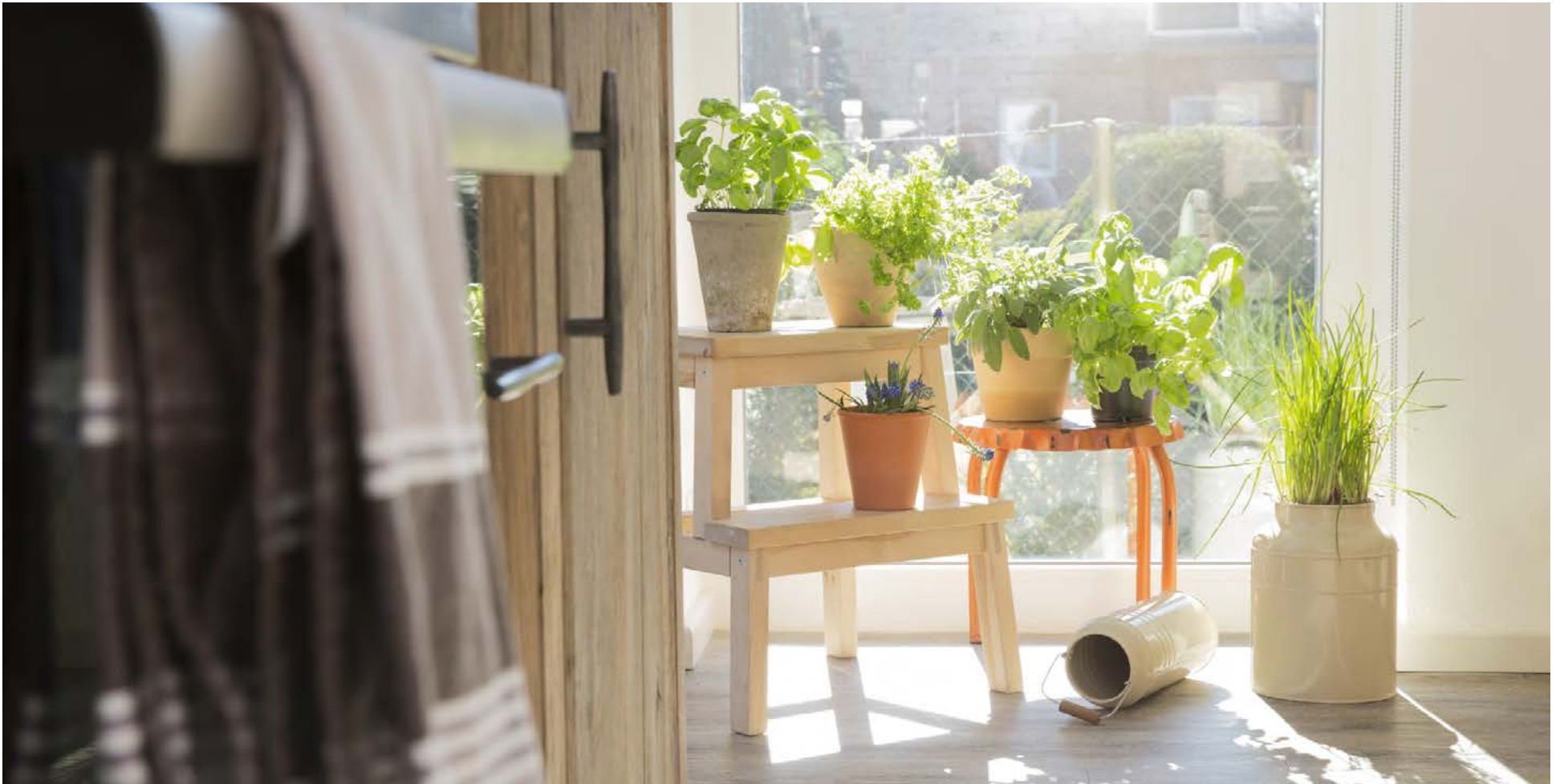
Eftir nokkrar vikur ætti blómleg ræktun að vera komin í gang í suðurglugganum.