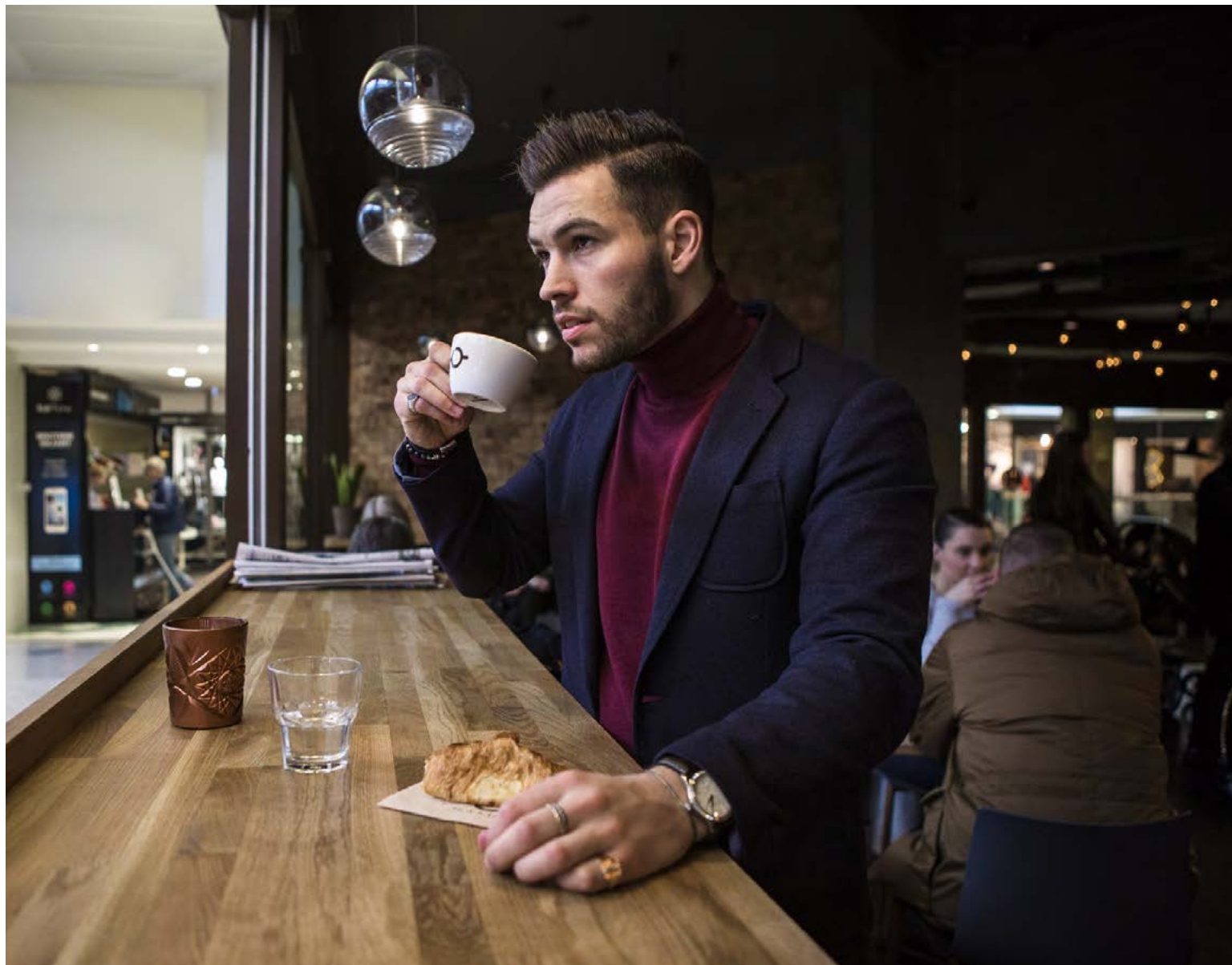
Rauða rúllukragapeysan er frá Sand og Armani Jersey jakkinn er ófóðraður og afar þægilegur.