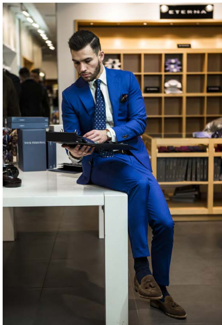
Bláu sérsaumðuð Corneliani-jakkafötin eru í mestu uppáhaldi hjá Davíð. Skyrtan og bindið eru frá Stenströms og skórnir eru frá Barker.

Hvað einkennir klæðnað ungra karla í dag? Strigaskór og belti frá frægum tiskuhúsum.