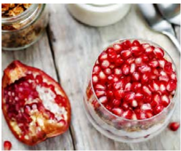
Granateplafrae eru góð í gríska jógúrt og margt annað.

Alexander er með boðskap í lagi sínu en hefur látið ævintýrin lönd og leið sem hann söng um árið 2009. Lagið nefnist That's How You Write a Song. Hann segist vera að syngja um trúna á sjálfan sig og hugmyndir sínar. Alexander hlakkar til að taka þátt í keppninni í Lissabon og vonast til að komast í aðalkeppnina.