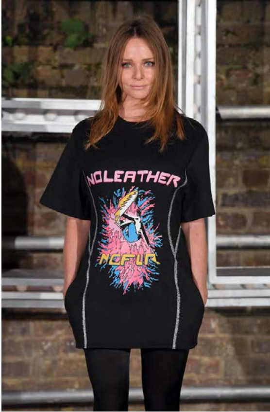
Stella McCartney hefur verið grænmetisæta alla ævi og leggur áherslu á dýravernd.