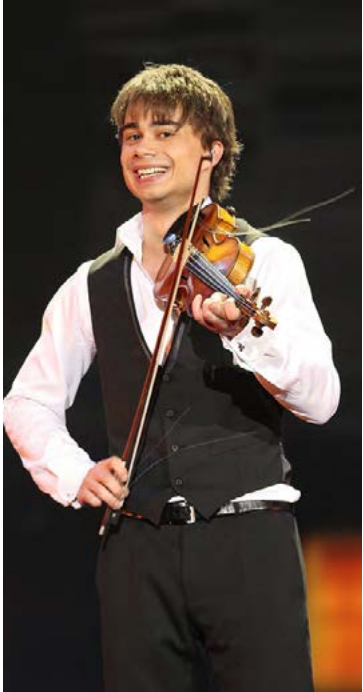
Alexander Rybak kemur endurnærð-ur til leiks í Eurovision í Lissabon.