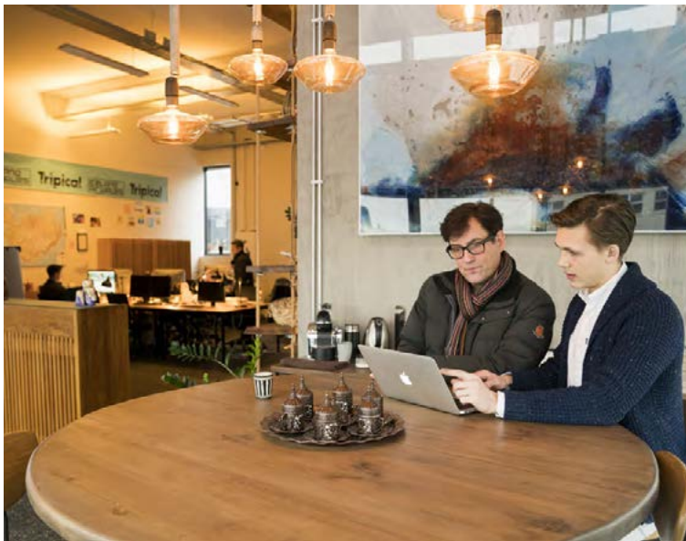
Glæsileg húsakynni ferðaskrifstofunnar Tripical í Borgartúni. MYNDIR/EYBÓR

Ferðaskrifstofan Tripical hefur verið starfandi frá árinu 2015 en hún hefur sérhæft sig í alls kyns hópferðum til A-Evrópu. „Við bjóðum meðal annars ferðir til Króatíu, Búlgaríu og Eyrstrasaltlandanna. Tripical hefur séð um ferðir fyrir útskriftarnema, árshátíðarferðir eða fyrirtækjaferðir sem hafa verið vinsælar.