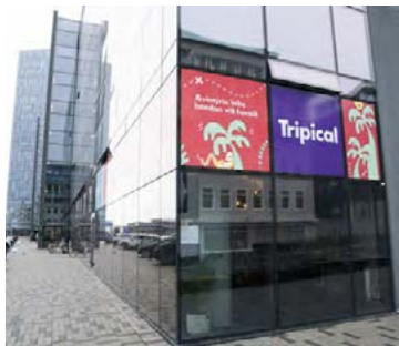
Tripical er til húsa í Borgartúni 8.

Hægt er að kaupa HM-ferðirnar á netinu hjá tripical.is en einnig er hægt að hafa samband símleiðis í síma 519 8900 eða koma á skrifstofuna í Borgartúni 8.