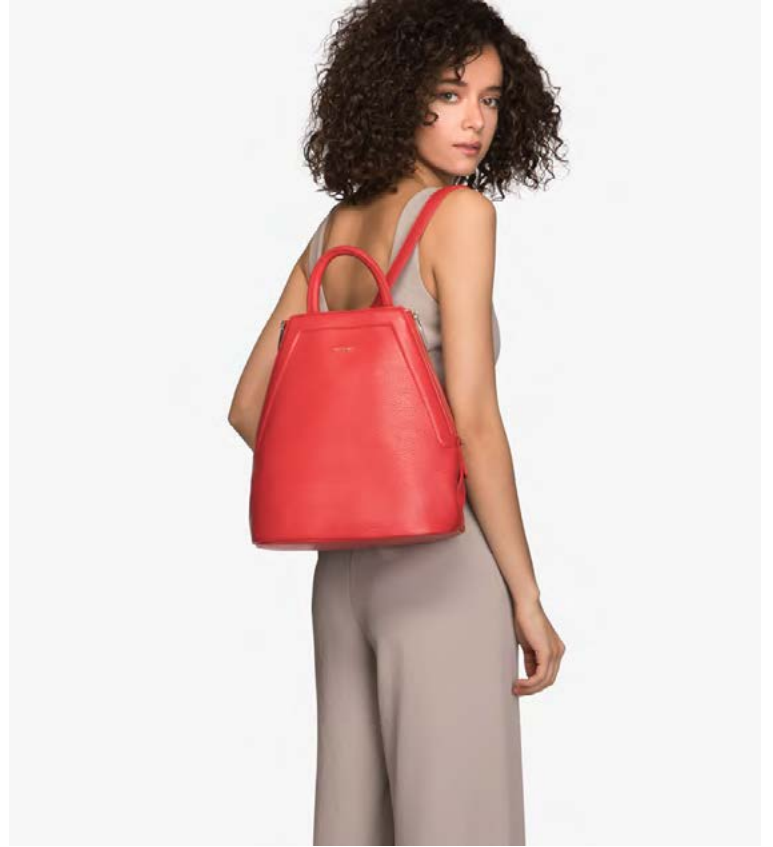
Töskurnar frá Matt & Nat eru umhverfisvænar. MYND/MATT&NAT