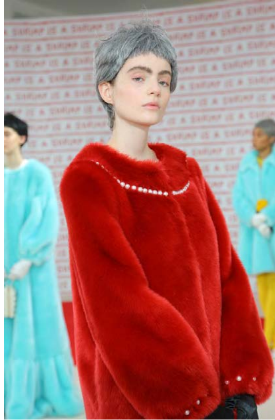
Kápurar frá Shrimps hafa vakið athygli.