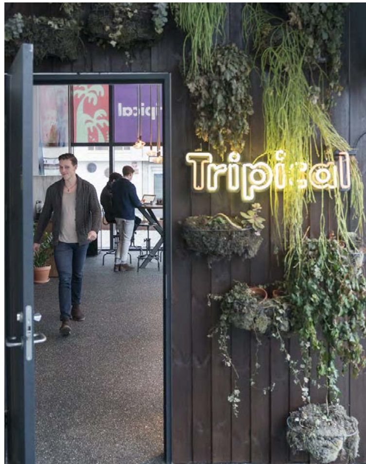
Tripical sérhæfir sig í hópferðum.