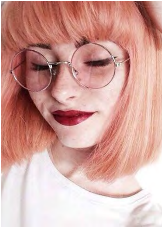
Gráir tónar vikja fyrir mildum, hlýjum litum.