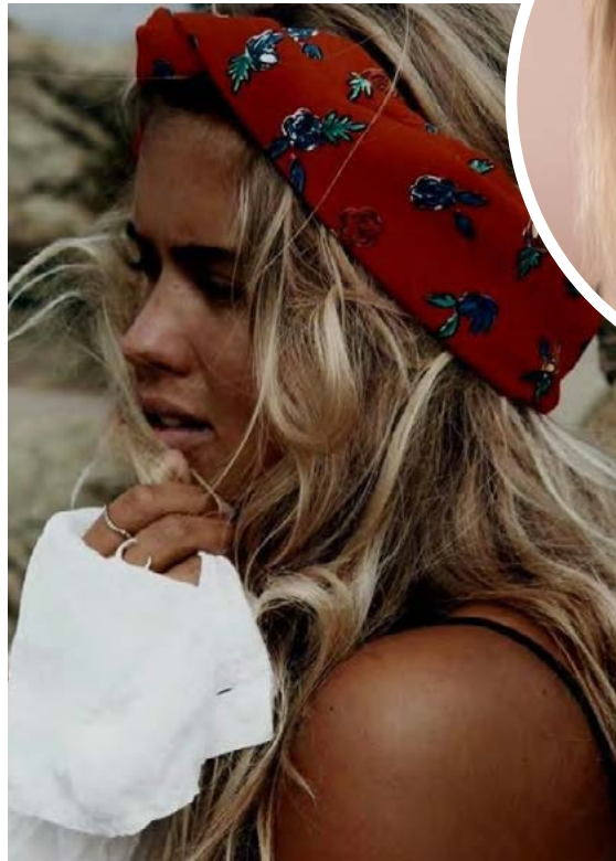
Hárskraut verður áberandi í hártískunni.