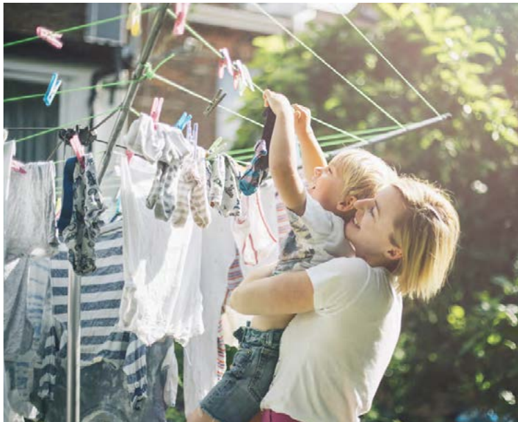
Börn geta meðal annars hjálpað til með þvottinn.

Börn geta hjálpað til við uppvaskið og jafnvel séð alveg um það.