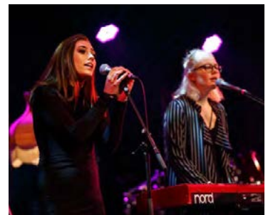
Between Mountains vann Músíktílaunir 2017 og kom sigurinn þeim á óvart.

Á meðan Katla og Ásrós eru ekki að sinna Between Mountains stunda þær nám við Menntaskólann á Ísafirði auk þess sem þær eru báðar í tónlistarnámi við Tónlistarskólann