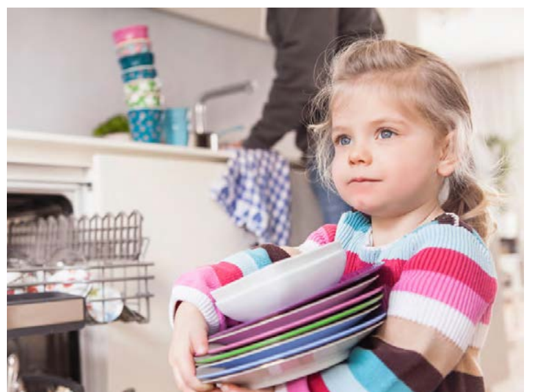
Börn geta hjálpað við húsverkin á ýmsan hátt.

GP. skartgripir & úr, Bankastræti 12 | Michelsen úrsmiðir, Kringlunni 8-12 | Jón & Óskar, Laugavegi 61 | Jón&Óskar, Kringlunni 8-12 | Jón&Óskar, Smáralind | Meba Kringlunni 8-12 og Meba Smáralind | Klukkan Hamraborg | Halldór Ólafsson, Glerártorgi Akureyri | Klassík, Egilstöðum | Guðmundur B. Hannah, Akranesi | Tímadjásn, Grímsbæ