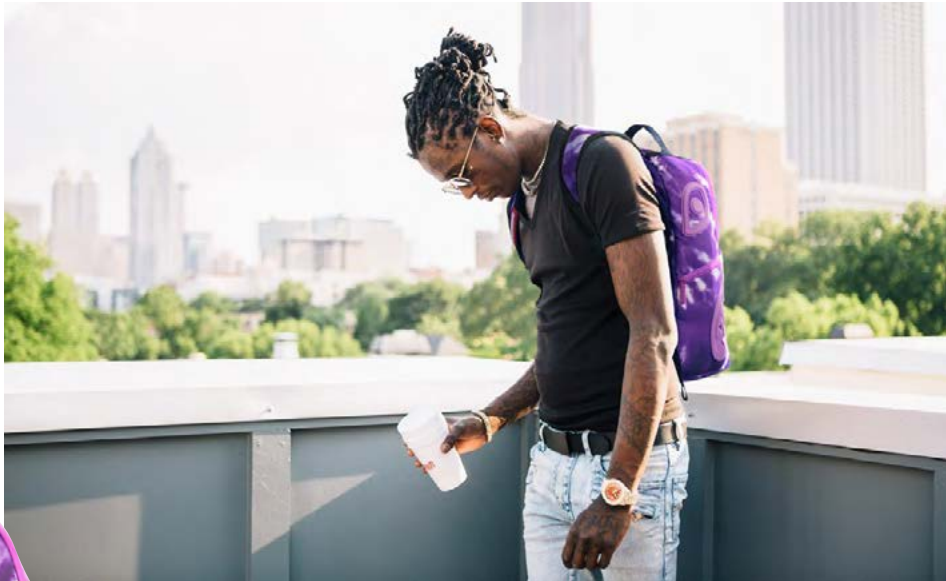
Rapparinn Young Thug með hönnun sína á bakinu.