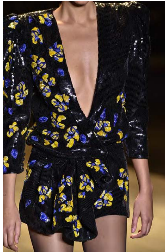
Hönnuðurinn vildi blóm og hamingju í hönnun sína.