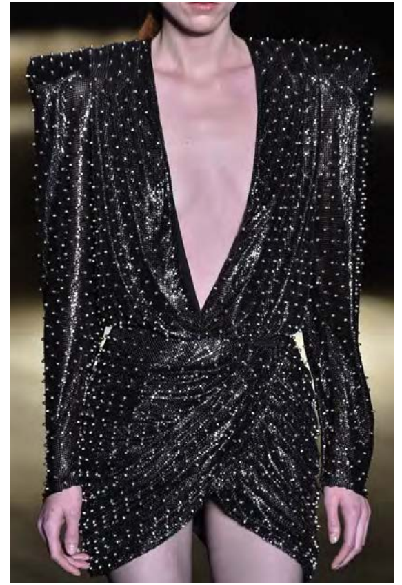
Brjóstahaldarann burt og hálsmálið er V-laga og nær nánast niður á mitti.