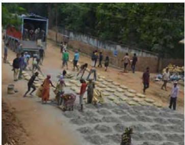
Verkamenn dreifa sementi á veg samkvæmt þýskri fyrirmynd.