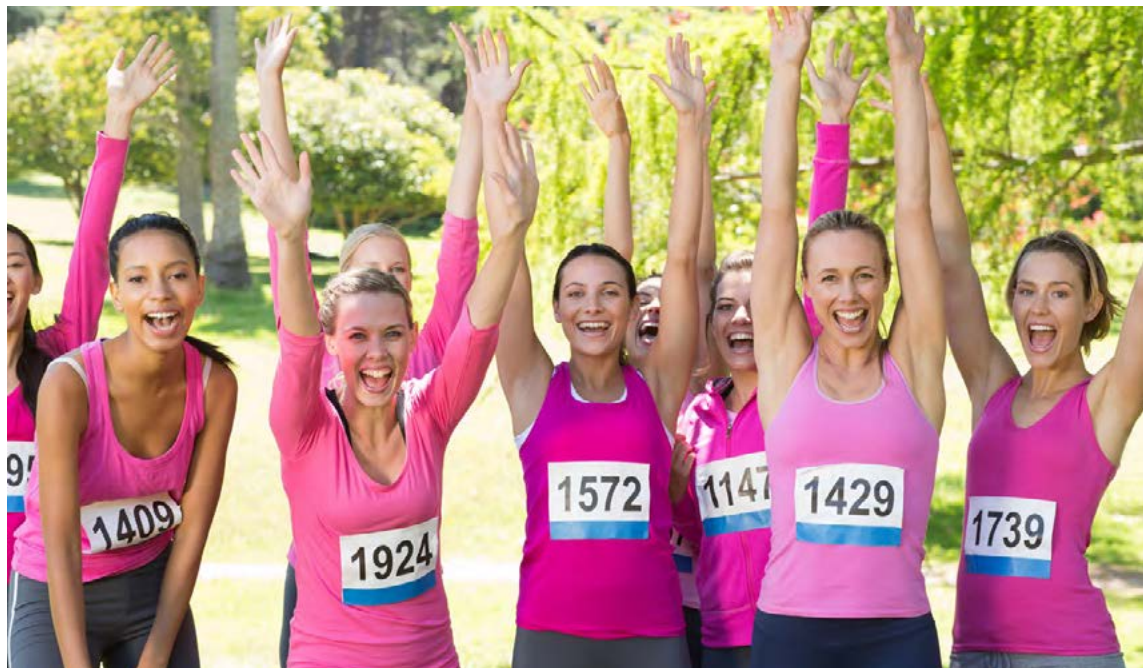
Topida frá Salcura hefur reynst vel hjá íþróttafólki sem þarf að kljást við vægar sveppasýkingar á iljum og milli tanna.