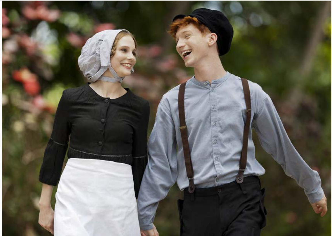
Það er margt forvitnilegt í samfélagi Amish fólksins.

Þeir sem eldast í Amish samfélaginu búa heima hjá ættingjum sem hugsa um þá. Talið er að það