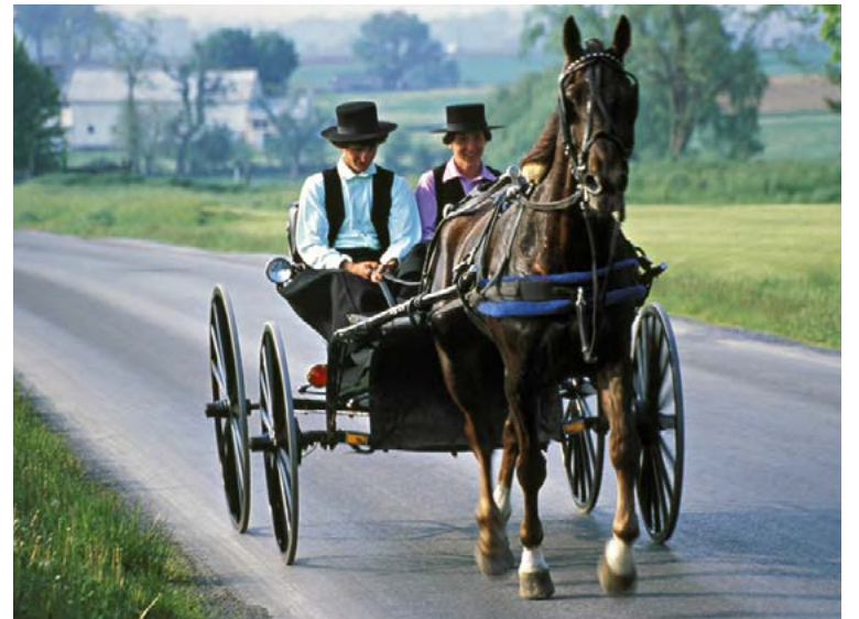
Timinn virðist standa í stað hjá Amish fólkinu enda neitar það sér um öll nútímapægindi.

geri heilmikið fyrir heilsuna að vera í öryggi fjölskyldunnar þegar aldurinn færir yfir. Í daglegum hraða bandaríks samfélags er ekki mikill tími fyrir fólk til að sinna öldruðum foreldrum en því er öðruvísi farið hjá Amish fólkinu.