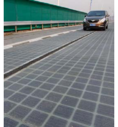
Sólarorkuvegur í Kína.

Þannig að þó að sólarorkuvegir hljómi mjög vel á blaði er enn langt í að þeir verði raunhæfur kostur. Hins vegar gæti borgað sig að reisa sólarcellurnar með fram vegum í staðinn.