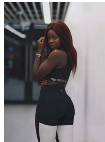
Breska samfélagsmiðlastjarnan Kaz í Define the Line-sportfatnaði Línu.

„Markmiðið er að fara meira inn á erlendar markað enda er mikil eftirspurn eftir vörumerkinu þar. Ég